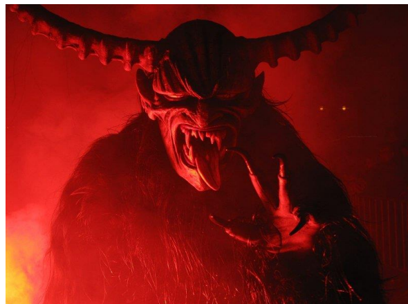
Slika broj 10. Krampuslauf