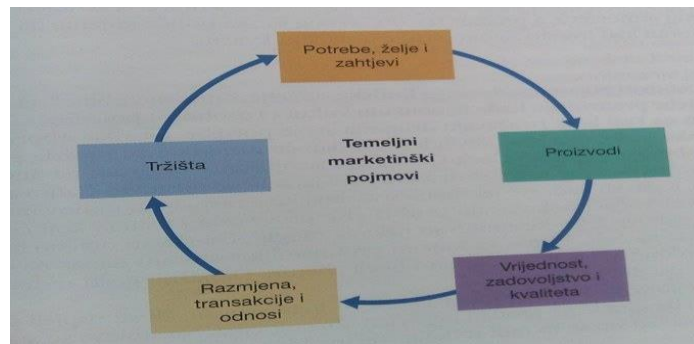
Slika broj 1. Temeljni marketinški pojmovi