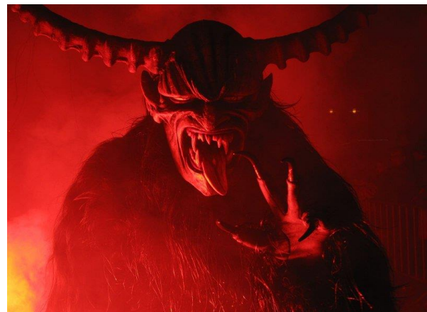
Slika broj 10. Krampuslauf