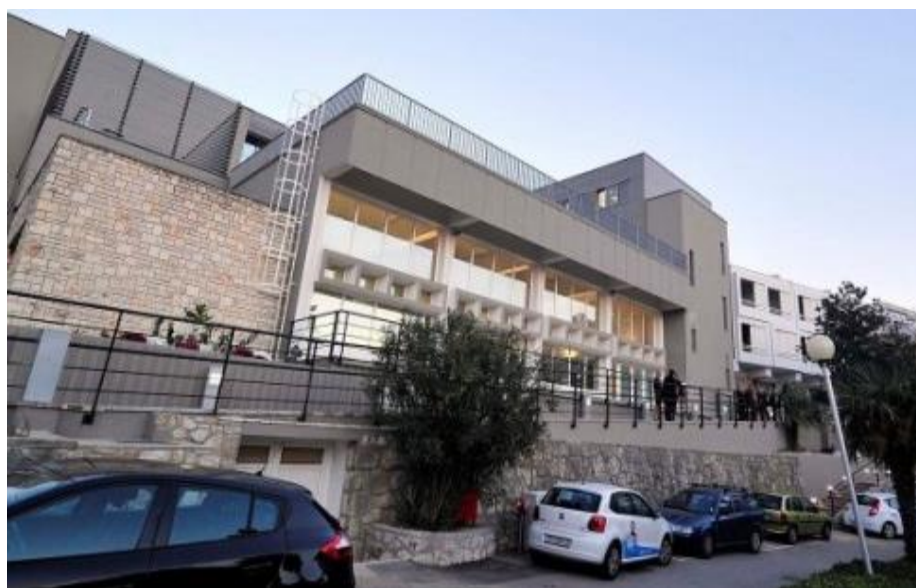
Slika 3. Thalassoterapia Crikvenica