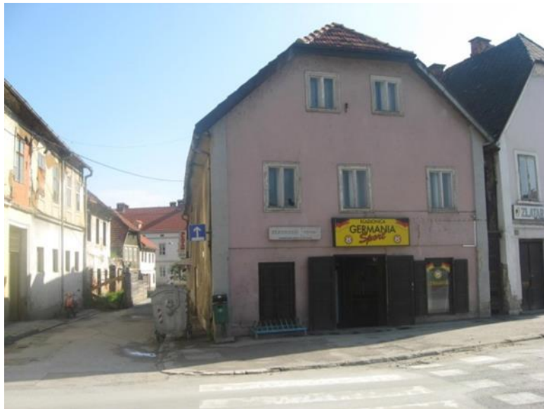
Slika 12: Rodna kuća Dragojle Jarnević

Posjetitelji bi svoju turu nastavili prema još jednoj od lokacija na kojima se jedno vrijeme nalazila Ilirska čitaonica. Ta lokacija se nalazi u samom centru grada, u ulici Stjepana Radića, gdje se nalazi kuća nekadašnjeg uglednog trgovca Mije Krešića. Osim što bi se posjetiteljima ukazalo da se tu nalazila jedno vrijeme Ilirska čitaonica, posjetitelji bi bili upoznati i s podatkom da se u toj kući osnovalo „Društvo ljubitelja nauke“ na čelu s Ivanom Mažuranićem. Poslije bi se uputili do obližnje Čitaonice za mlade u kojoj bi posjetiteljima bila predstavljena najvažnija djela i osobe tog vremena te bi bile izložene i knjige nastale u to vrijeme u Karlovcu. Na taj bi se način turistima prikazali događaji koji su se u vrijeme Ilirskog preporoda zbivali u Karlovcu ali i u Hrvatskoj. Nakon što bi se posjetiteljima kroz djela i osobe iz tog vremena поближе prikazao Ilirski preporod, tura bi se iz Čitaonice nastavila prema obližnjem Gradskom muzeju Karlovac. Posjetom Gradskom muzeju Karlovac i to njegovom stalnom postavu, posjetitelji bi upoznali ilirsku baštinu koja se čuva u jednoj od soba prvog kata muzeja. Nakon posjeta muzeju posjetitelji bi nastavili turu posjetom rodnoj kući Dragojle Jarnević. Dolaskom do rodne kuće prve ilirske pjesnikinje posjetiteljima bi se pored spomen ploče koja se nalazi na kući pročitao jedan kratki dio Dragojlinog Dnevnika, te bi se na taj način posjetiteljima prikazalo što se u to vrijeme zbivalo u Hrvatskoj ali i u Karlovcu.