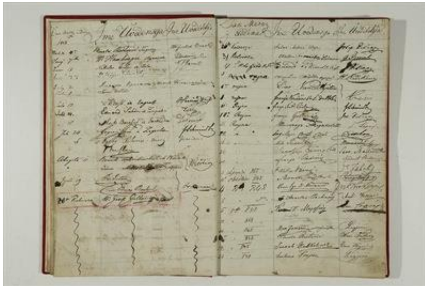
Slika 3: Upisna knjiga posjetitelja Čitaonice ilirske karlovačke