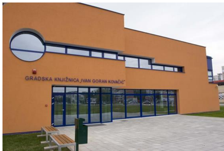
Slika 13: Gradska knjižnica „Ivan Goran Kovačić“