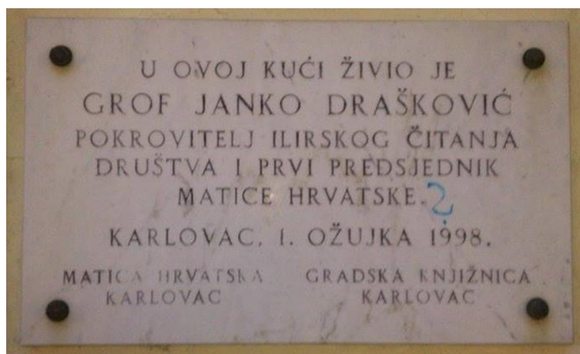
Slika 11 : Stara spomen ploča na kući Janka Draškovića

Nastavili bi dalje prema Radićevoj ulici gdje bi sljedeća lokacija bila kuća u kojoj je u Karlovcu živio grof Janko Drašković. Na kući se nalaze dvije ploče koje svjedoče da je u toj kući živio grof Janko Drašković. Ispred spomen ploča koje se nalaze na kući posjetiteljima bi se ispričala uloga grofa Janka Draškovića u vrijeme Ilirskog preporoda. Osim njegove uloge ispričao bi se i njegov život. Spomenuli bi se njegovi radovi i utjecaj u vrijeme preporoda. Posjetitelji bi bili upoznati s činjenicom da je u toj kući jedno vrijeme bila i tiskara Ivana Nepomuka Prettnera u kojoj su tiskana mnoga važna djela u vrijeme Ilirskog preporoda.