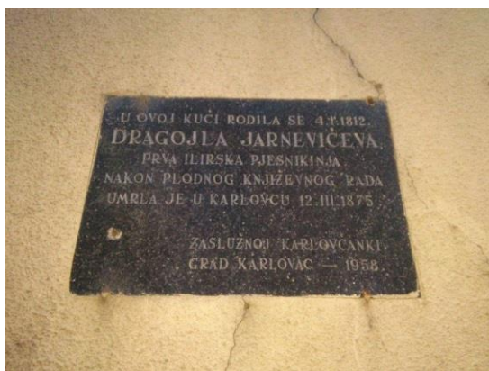
Slika 7: Spomen ploča na kući Dragojle Jarnević

U gradu se nalazi i rodna kuća prve ilirske pjesnikinje Dragojle Jarnević. Na kući stoji i stara spomen ploča iz 1958. godine koja pokazuje da je u njoj rođena i živjela Dragojla Jarnević. Treba postaviti novu spomen ploču koja će biti pisana i stranim jezicima te na taj način i stranim turistima omogućiti da saznaju tko je u toj kući rođen. Rodna kuća Dragojle Jarnević nalazi se na uglu današnjih ulica Ljudevita Gaja i Dragojle Jarnević. U Šimunićevoj ulici na kućnom broju 3 nalazila se sobica u kojoj je preminula Dragojla Jarnević. Na kuću treba postaviti spomen ploču koja će svjedočiti da je Dragojla Jarnević u njoj preminula. Osim kuće u kojoj se Dragojla Jarnević rodila i u kojoj je preminula, u Karlovcu se nalazi i osnovna škola koja je po poznatoj ilirkinji dobila ime Osnovna škola Dragojle Jarnević, a ispred škole se nalazi i bista same Dragojle.