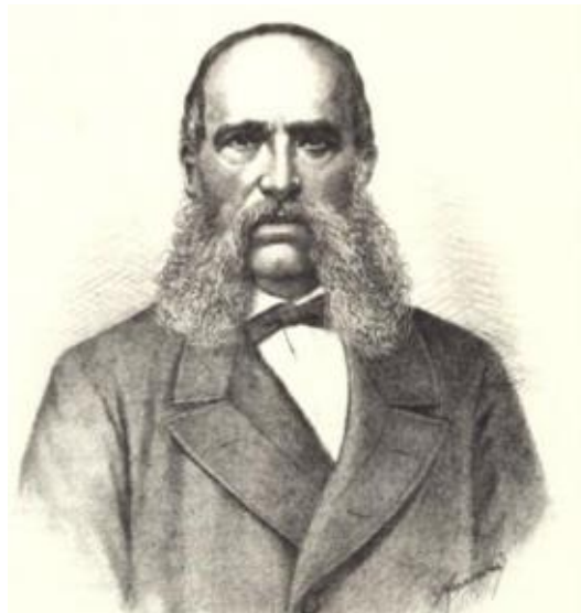
Slika 15: Ivan Mažuranić