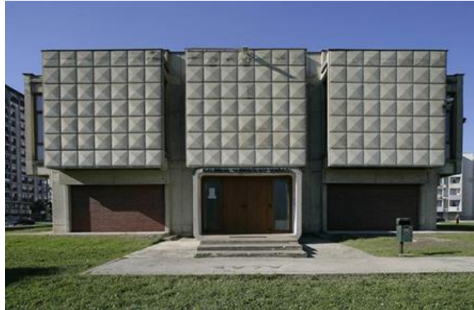
Slika 14: Galerija „Vjekoslav Karas“

bi priča o ilirskoj baštini grada Karlovca, ali i njezino prikazivanje posjetiteljima grada i ljubiteljima kulturne baštine.