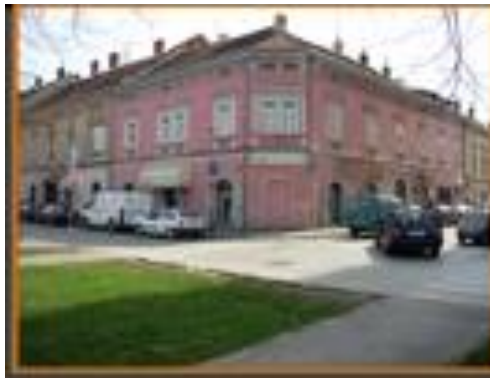
Slika 5: Mjesto na kojem je stajala kuća u kojoj je osnovano "Ilirsko čitanja društvo"

Gradska knjižnica „Ivan Goran Kovačić“ također vrednuje ilirsku baštinu grada Karlovca. Na internet stranici Gradske knjižnice „Ivan Goran Kovačić“ nalazi se povijest knjižnice od njenog osnutka 1. ožujka 1838. godine kao "Ilirsko čitanja društvo" kojom je postala najznačajnija ustanova u gradu. Osim osnutka i razvoja knjižnice kroz godine prikazano je mijenjanje njenih lokacija kroz godine. Navedene ustanove posjetiteljima i građanima približavaju ilirski preporod.