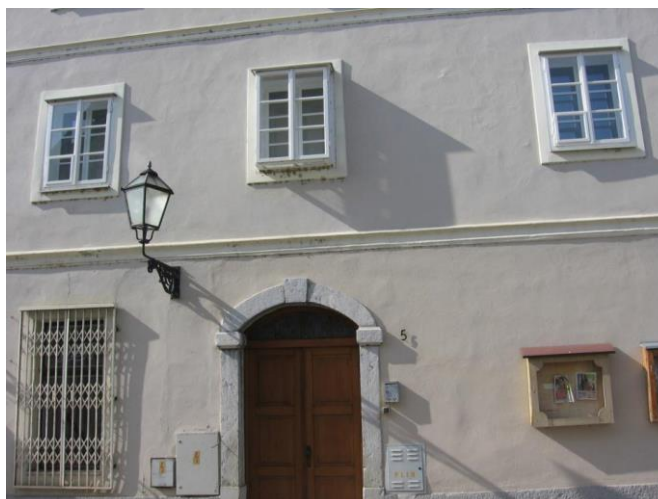
Slika 6: Kuća uglednog trgovca Mije Krešića