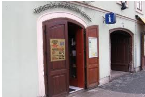
Slika 16: Turistička zajednica grada Karlovca