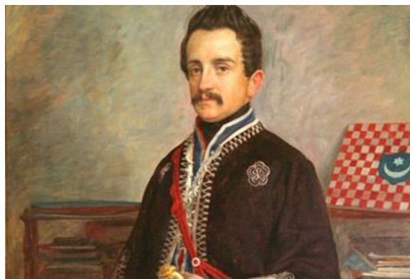
Slika 1: Ljudevit Gaj