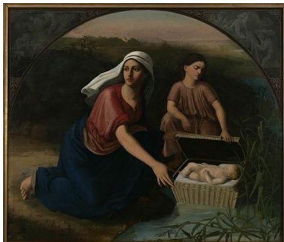
Slika 4: Majka izlaže Mojsija na obalu rijeke Nil

Osim u Gradskom muzeju Karlovac, vrednovanje ilirske baštine vidljivo je i u Galeriji „Vjekoslav Karas“. U sklopu Galerije „Vjekoslav Karas“, Gradskog muzeja Karlovac nalaze se i druga djela slikara Vjekoslava Karasa i to Majka izlaže Mojsija na obalu rijeke Nil, Autoportret i Portret Jozefine Barac Bernardić koje se nalaze u Zbirci slika 18. i 19. stoljeća. Slike nisu izložene zbog toga što se povremeno održavaju likovne i muzejske izložbe. Djela su vidljiva na internet stranici Gradskog muzeja Karlovac ( www.gmk.hr. ).