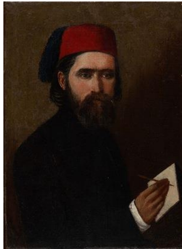
Slika 2: Vjekoslav Karas, autoportret

Karlovcjanin Vjekoslav Karas također je jedna od najistaknutijih ličnosti hrvatskog Ilirizma. Smatra se prvim hrvatskim slikarom, stvorio je prvi psihološki portret, te njegovo slikarstvo predstavlja likovni vrhunac hrvatskog slikarstva 19. stoljeća.