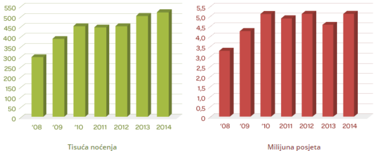
Slika 6-8. Broj posjeta stranice turističke agencije Adriatic i broj noćenja koja su ostvarena pute te agencije