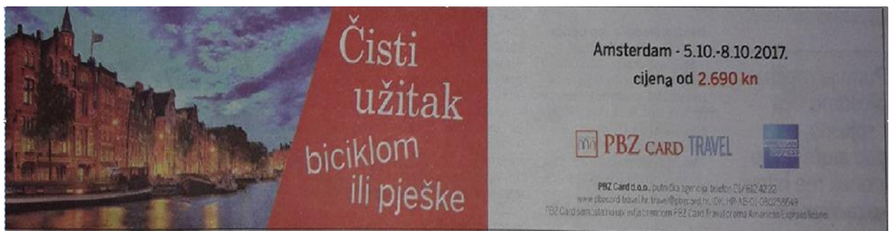
Slika 6-5. Primjer oglasa PBZ card travel, putničke agencije, u dnevnim novinama

Osim oglašavanja putem interneta kao najjeftinijeg i najrasprostranjenijeg oblika oglašavanja, mnoge agencije još uvijek koriste i oglašavanja na radio stanicama, dnevnim novinama, časopisima, televizijskim programima i slično. Što se oglašavanja putem televizijskih programa tiče, zasigurno je u posljednje vrijeme najvidljivije oglašavanje turističkih agencija na televiziji Nova Tv putem portala za grupnu kupnju pod nazivom “Crno jaje”. Također, mnoge agencije još uvijek oglašavanje vrše putem dnevnih tiskovina pa se tako svakodnevno može pronaći u novinama Večernji list oglas putničke agencije PBZ card travel koja djeluje pod okriljem PBZ banke.