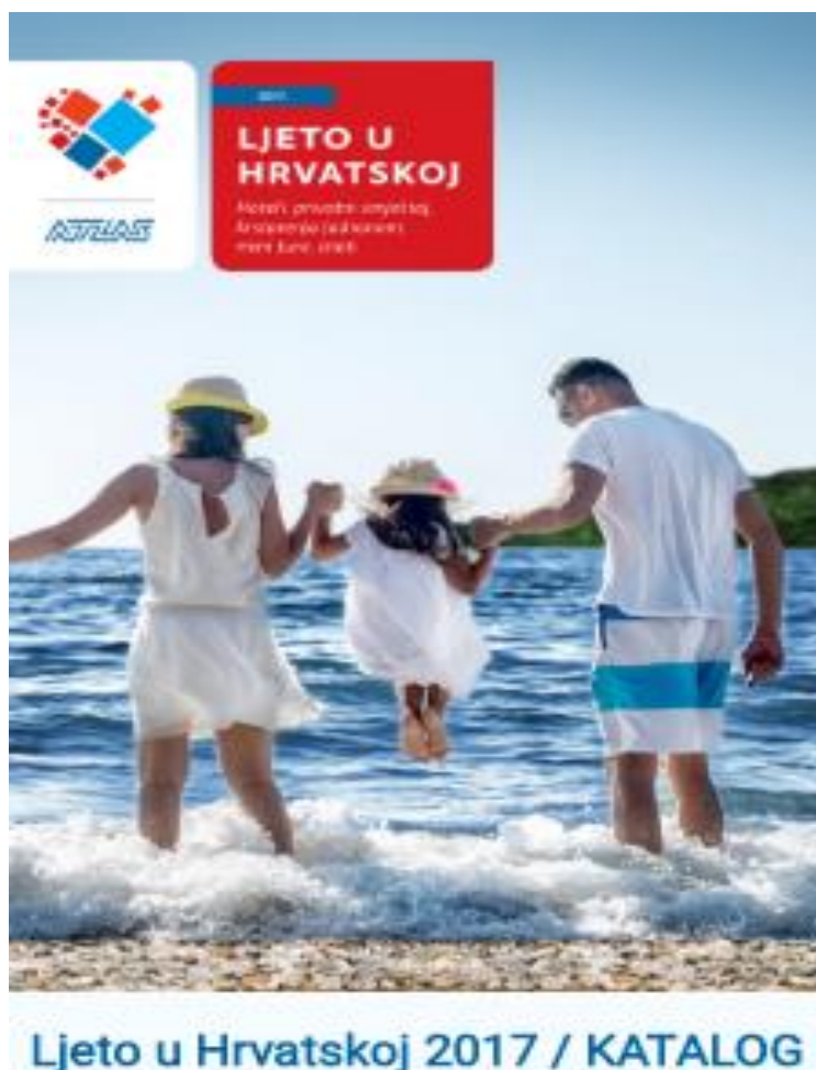
Slika 6-7. Primjer kataloga turističke agencije Atlas, “Ljeto u Hrvatskoj”

Uz sve nabrojane oblike promotivnih aktivnosti, još uvijek se veliki broj agencija odlučuje na izradu kataloga koji sadrže ponudu cjelokupnog turističkog proizvoda sa cijenama.