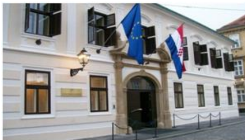
Slika 11: Banski dvori