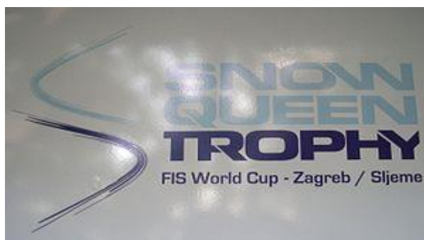
Slika 2 – Logo sportskog natjecanja Snow Queen trophy