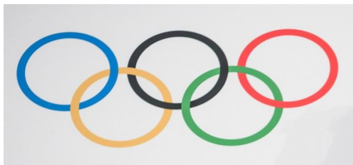
Slika 4: Olimpijski krugovi