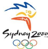
Slika 5: Logo Olimpijskih igara u Sydneyu