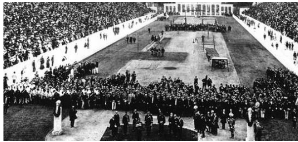
Slika 3: Otvaranje prvih modernih igara u Grčkoj 1896. godine