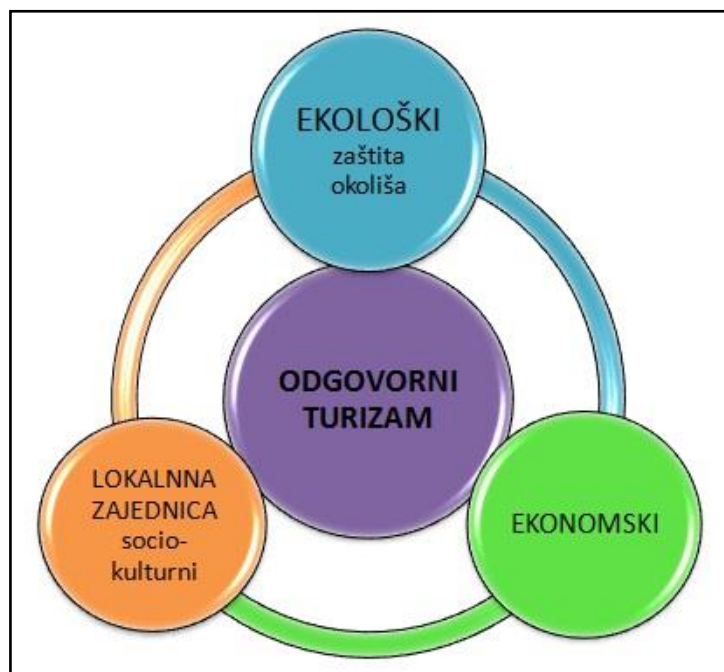
Slika br. 4. Strateški ciljevi odgovornog turizma

(Izvor: Ciljevi odgovornog turizma ; www.ek0n0mska.wixsite.com ; 2.6.2018)