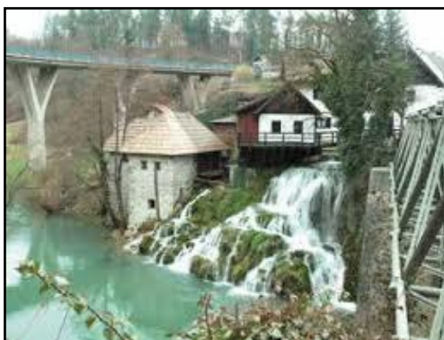
Slika br. 2. Štefančeva mlinica na Ratokama

Rastoke su spomenik kulture zbog osobitosti tradicijske arhitekture, čime se čovjek u potpunosti prilagodio prilikom gradnje prirodi, stoga prirodno okruženje i veličina površina otoka uvjetovala je položaj i veličinu izgrađenih objekata. Pa je tako položaj mlina, prizemne građevine kvadratnog ili pravokutnog tlocrta koji je uvjetovao smjer vodenog toka. Obično se uz mlin nalazi kuća, najčešće katnica također pravocrtnog tlocrta s karakterističnom ganjkom (drvenim balkonom) uzduž jednog pročelja. Isto tako se uz mlin i kuću za potrebe mlinarenja nalazila suša (nastrešnica za kola, štala). Pošto su parcele ograničene otocima svaki prostor se maksimalno iskoristio, pa su potkrovlja mlinova služila kao spremište žita, a potkrovlja suša za držanje sijena. Također u skladu s prirodnim okruženjem temelji i prizemlja građevina su od kamena ili sedre (tufa), a katovi od drvenih hrastovih planjki spojenih na ugao, te dvostrešnih krovova pokrivenih glinenim prešanim crijepom s utorima.