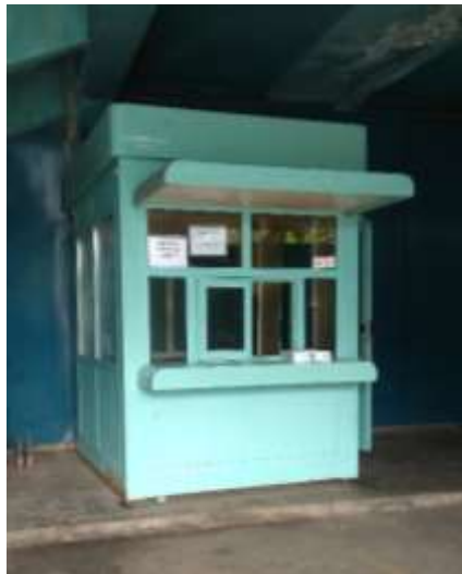
Sl. 5. Porta na ulazu od hitne pomoći [13]

Dolazak vozilom do hitne pomoći je moguć kroz tunel za vozila i to iz oba smjera Avenije Gojka Šuška. Porta na ulazu od hitne pomoći nalazi se uz istočni dio „I“ objekta bolnice na kraju tunela za vozila odnosno na početku parkirnih mjesta za vozila hitne pomoći. Ovo je prilično složeno radno mjesto jer kroz dnevnu i noćnu smjenu kroz taj ulaz prođe velik broj ljudi. Postoji opasnost da osobe unesu razne opasne predmete na objekt, a pošto su velik broj tih osoba pacijenti koji imaju neku vrstu hitnosti veoma je teško svaku osobu pregledati te zbog toga zaštitar na ovom radnom mjestu treba biti iskusan i procijeniti svaku osobu koja ulazi kroz ulaz hitne pomoći i na vrijeme uočiti je li ta osoba prijetnja sigurnosti ljudi i imovine. [4]