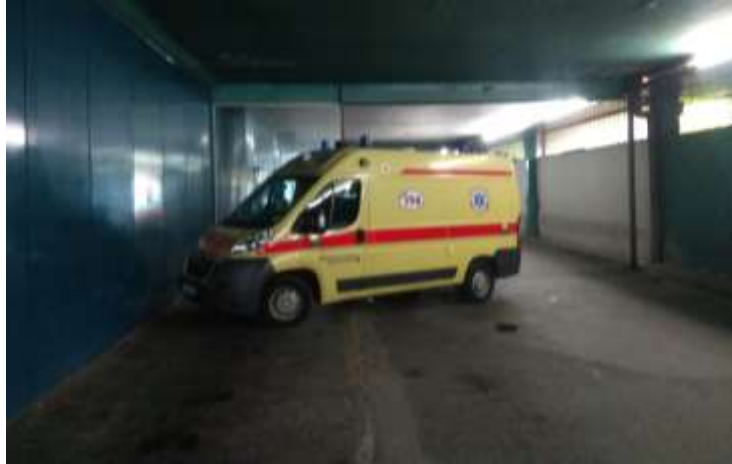
Sl. 6. Tunel za vozila hitne pomoći [13]

kroz taj tunel. Zbog toga, zaštitar mora odmah upućivati privatne automobile na produže kroz tunel na sjeverni parking bolnice. [4]