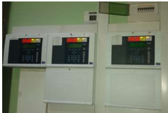
Sl. 9. Centrale za dojavu požara [13]

S obzirom na prostornu distributivnost predmetnih objekata na lokaciji KB Dubrava (objekti A, B, C, D, E, F, G, H i I), velik broj požarnih sektora i zona, velik broj elemenata u cijelom sustavu, velik broj sučeljenih podsustava te nužnost brze odluke i intervencije lokalne vatrogasne postrojbe (interventne jedinice), predmetni sustav za dojavu požara podijeljen je na prostorno distribuirane podsustave povezane na zasebne centrale (slika 9.) za dojavu požara, međusobno umrežene, te osigurava prikaz događaja sa svih centrala na središnjem sustavu za grafičku vizualizaciju 15 (LMS – local monitoring system). [1]