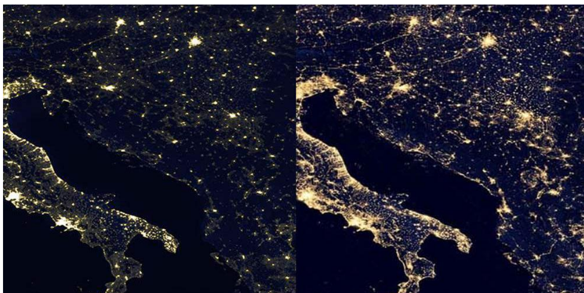
Slika 5. Svjetlosno onečišćenje