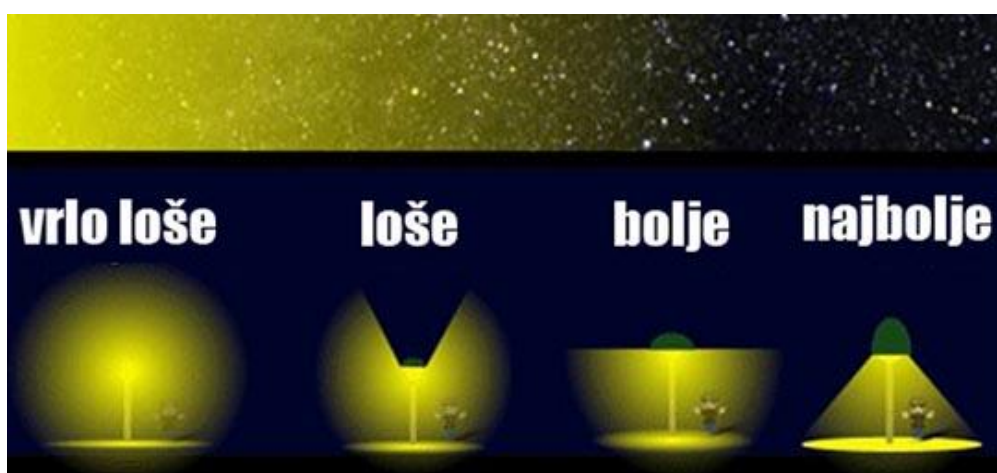
Slika 4. Pravilno postavljanje javne rasvjete

Prateći trendove i uporabom solarne energije za pretvorbu električne uvelike se zadovoljava ekonomičnost sistema, energetska efikasnost te ekološka prihvatljivost. Ekološka prihvatljivost i njezini kriteriji za uspostavljanje sistema mora biti na razini. Samim ekološkim kriterijima pomičemo granice i na taj način djelujemo na očuvanje samog ekosistema, koji u protivnom snosi dugoročne posljedice koje su ponekada i nevidljive.