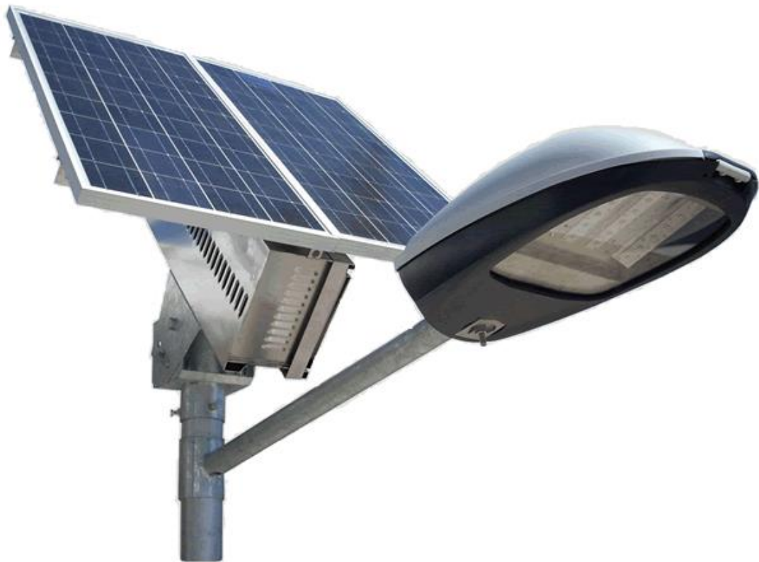
Slika 2. Solarni rasvjetni stup s FN modulom na vrhu stupa

Solarna javna rasvjeta se pokazuje kao isplativo, ekonomično i trajno rješenje u situacijama gdje je investicija za postavljanje električne energije preskupa ili je teren nepristupačan za postavljanje kabela ili elektrifikacijskih stupova. Također princip osvjetljavanja prometnica, parkirališta, šetnica, parkova i drugih javnih površina predstavljaju područja na kojima je moguća realizacija postavljanja sustava solarne javne rasvjete zbog jednostavnosti postavljanja i dugoročne ekonomske isplativosti. Cjelokupni proces postavljanja klasične ulične rasvjete iziskuje velike troškove i smatra se ekonomski neisplativom. Sami proces postavljanja zahtjeva kopanje, asfaltiranje, duljine kablova i dalekovoda. Instalacija ulične rasvjete nema takvih problema zato jer je jednostavna i brza. Zbog autonomnosti solarnoj rasvjeti ne smeta prekid u radu elektronske mreže, te je i tim situacijama potpuno funkcionalna.