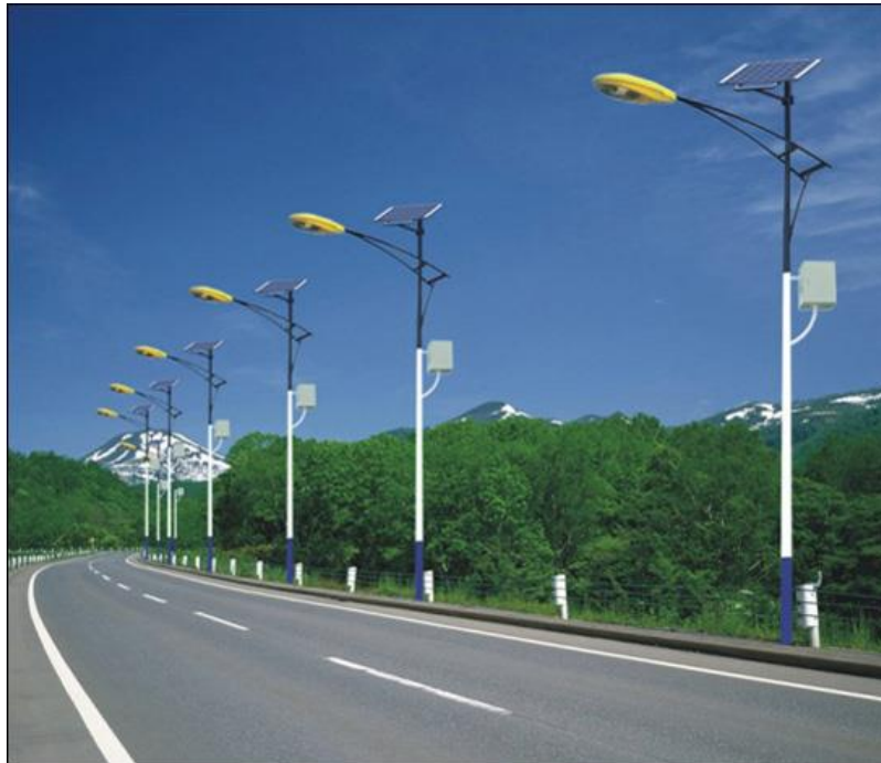
Slika 3. Primjena solarne javne rasvjete uz prometnicu

Prateći trendove i uporabom solarne energije za pretvorbu električne uvelike se zadovoljava ekonomičnost sistema, energetska efikasnost te ekološka prihvatljivost. Ekološka prihvatljivost i njezini kriteriji za uspostavljanje sistema mora biti na razini. Samim ekološkim kriterijima pomičemo granice i na taj način djelujemo na očuvanje samog ekosistema, koji u protivnom snosi dugoročne posljedice koje su ponekada i nevidljive.