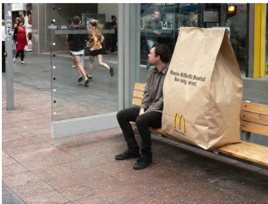
Slika 6. McDonald's ova vrećica za van