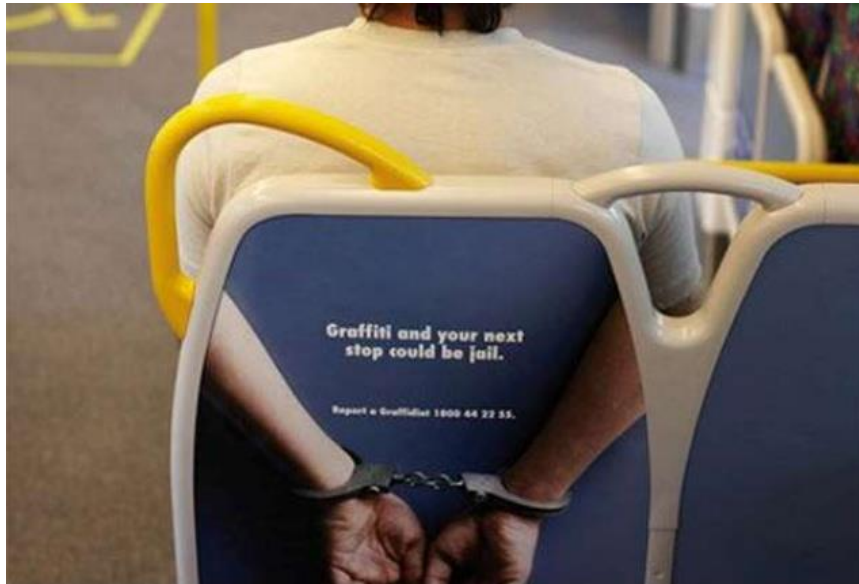
Slika 8. Naljepnice na sjedalima australskih autobusa i vlakova

Izvor: StickerYou, www.stickeryou.com (8.6.2019.)