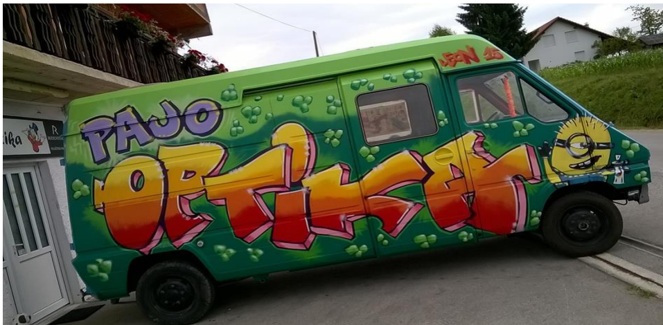
Slika 28. Kombi PAJO Optike