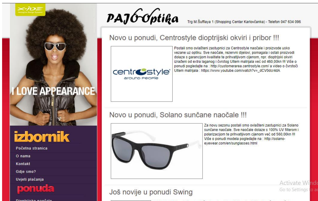
Slika 26. Službena stranica PAJO Optike