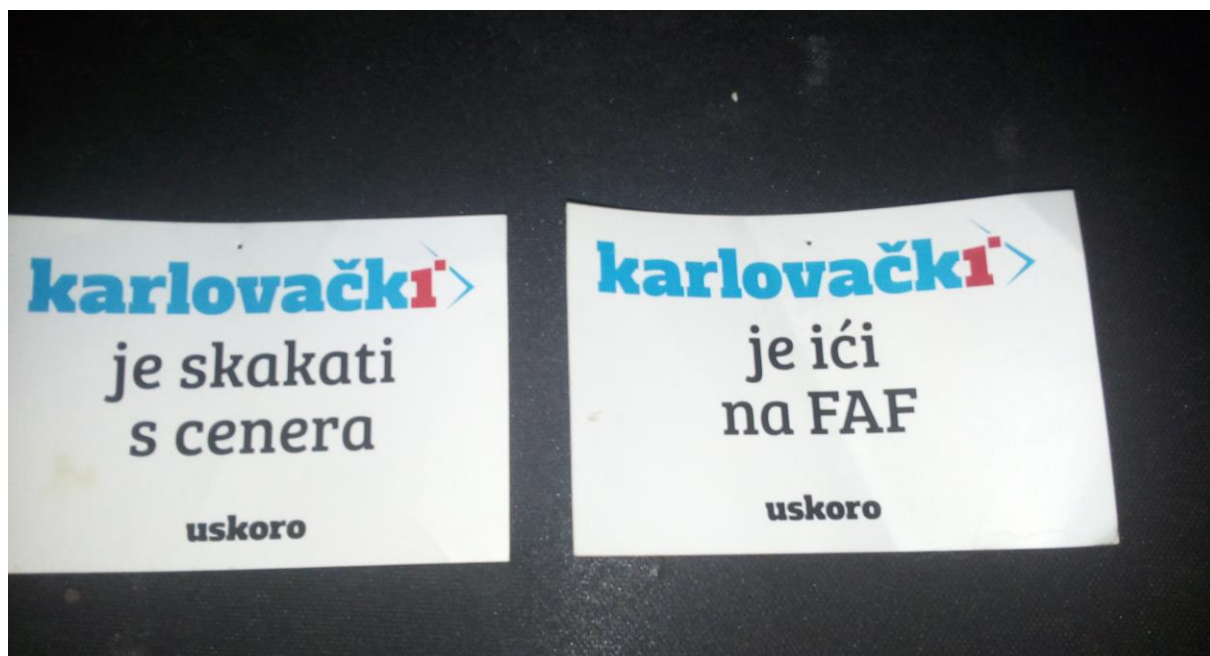
Slika 25. Naljepnice

Promotivna je kampanja krenula ranije. Na zgradama, stupovima, klupama, izlozima, mogle su se vidjeti naljepnice na kojima su se mogle pročitati izjave s kojima su se građani Karlovca mogli povezati jer su označavale riječi, navike, stvari i pojave su specifični za karlovačko područje te tako karakteriziraju Karlovčane, na primjer „Karlovački je skakati s cenera“. Iako je na naljepnicama bio vidljiv logo novog gradskog brenda, a da je to logo se saznalo tek kasnije, održala se tajnovitost i probudila znatiželja kod građana. Promotivna je kampanja imala završetak 4. veljače, a obilježena je nastupom grupe Hladno pivo. 61