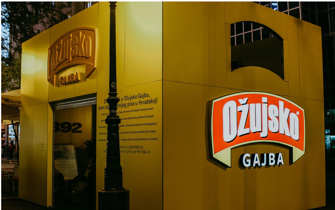
Slika 9. Ožujsko Gajba