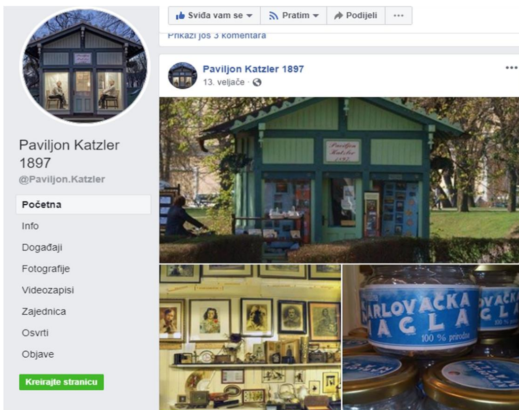
Slika 12. Facebook stranica Paviljona Katzler 1897.