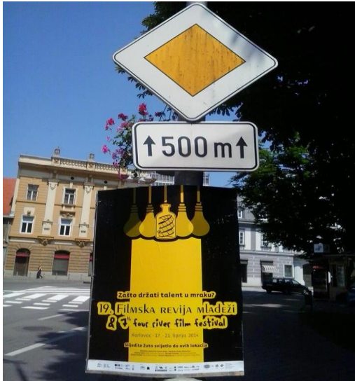
Slika 19. Plakat FRFF-a & FraME