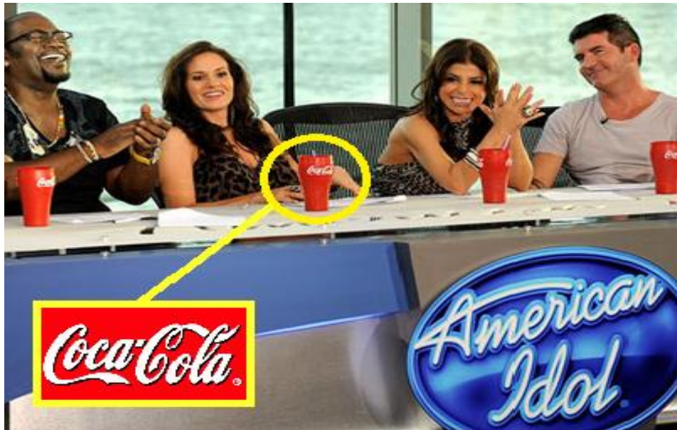
Slika 10. Prikriveni marketing Coca-Cole u TV-emisiji American Idol