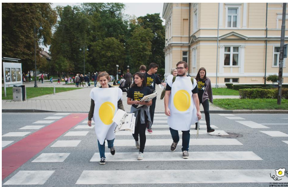
Slika 22. Volonteri u kostimima