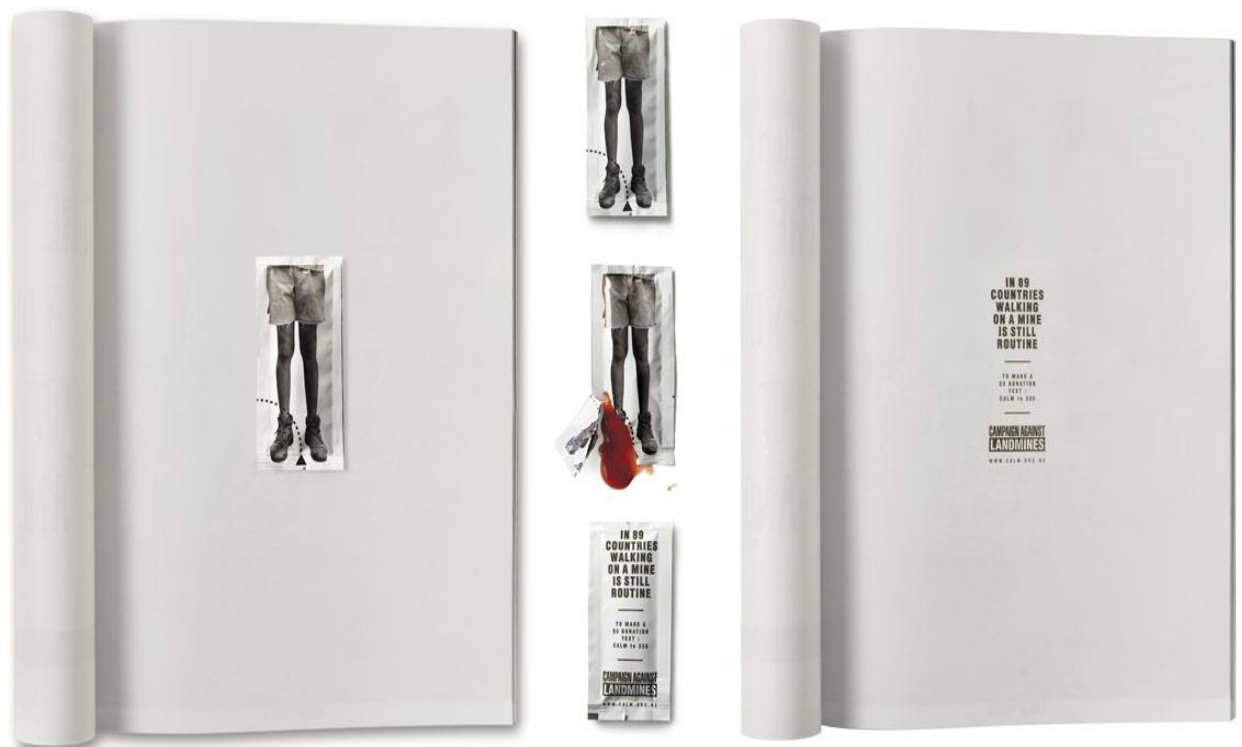
Slika 7. CALM kampanja