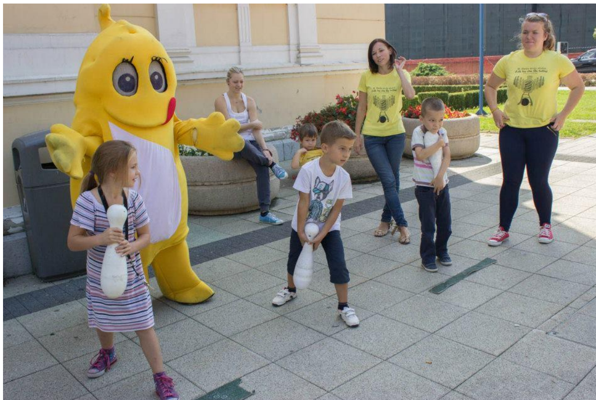
Slika 24. Kuglanje