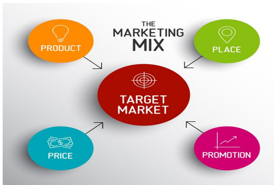
Slika 1. Marketing miks