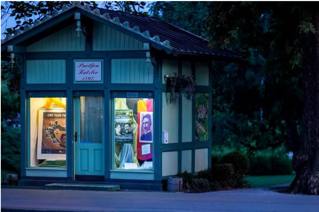
Slika 11. Paviljon Katzler 1897.