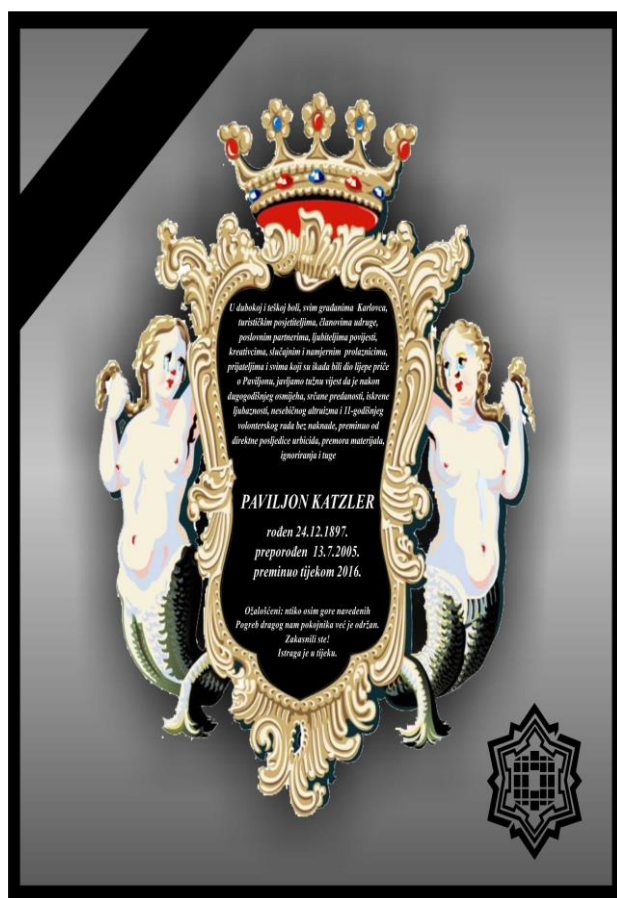
Slika 13. Osmrtnica paviljonu