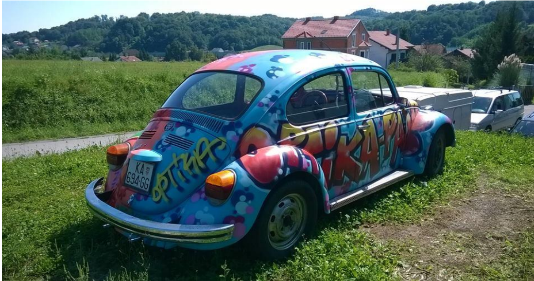
Slika 27. Automobil PAJO Optike