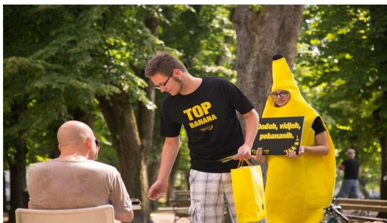
Slika 21. Volonteri dijele letke