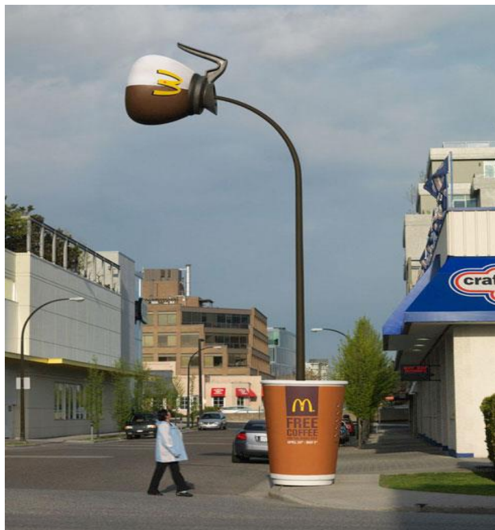
Slika 4. Ulična rasvjeta u obliku McDonald's ove šalice kave