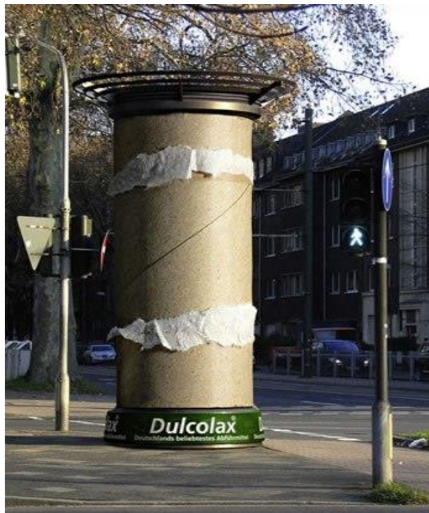
Slika 3. Dulcolax ova kampanja