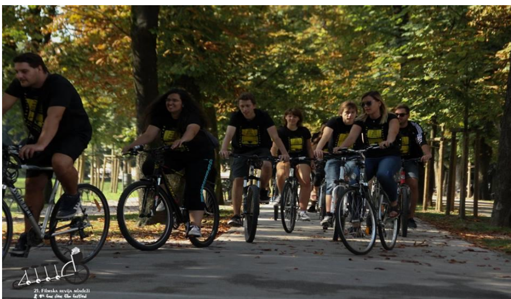
Slika 23. Mini biciklijada kroz centar grada