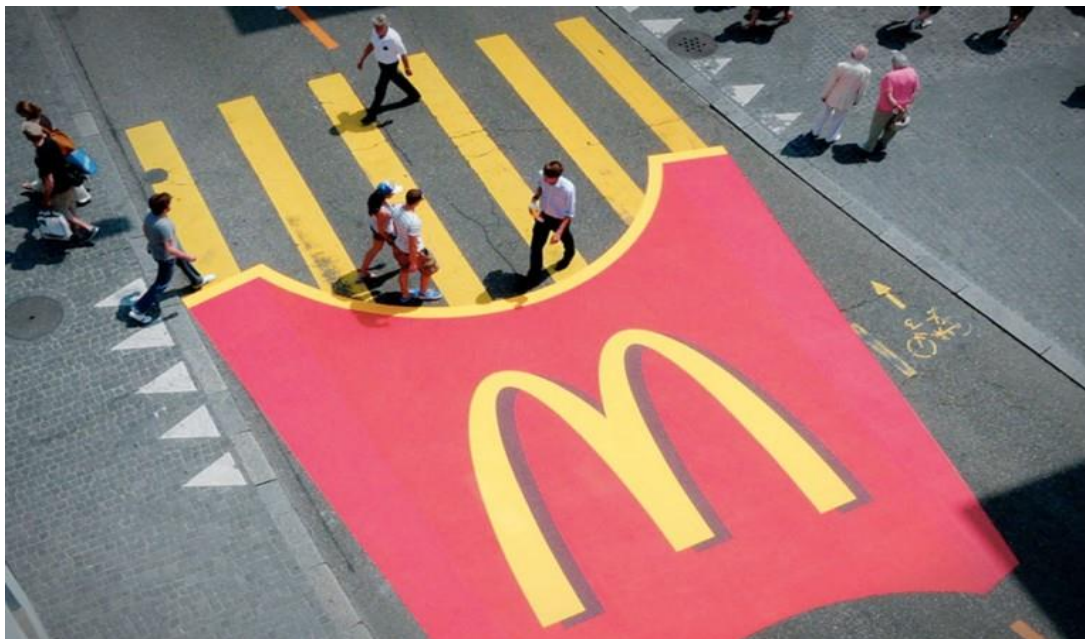
Slika 5. Zebra u obliku McDonald's ovih krumpirića