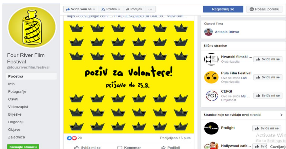
Slika 18. Facebook stranica FRFF-a