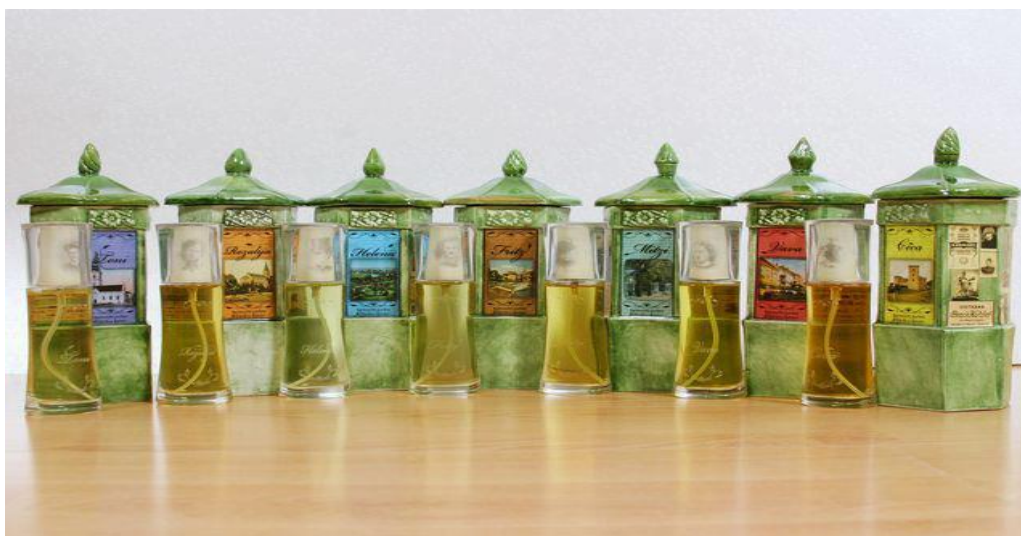
Slika 15. Parfemi s mirisom grada Karlovca