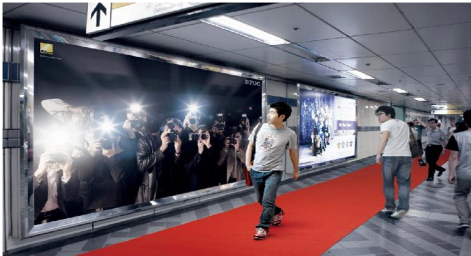
Slika 2. Nikonova kampanja Paparazzi