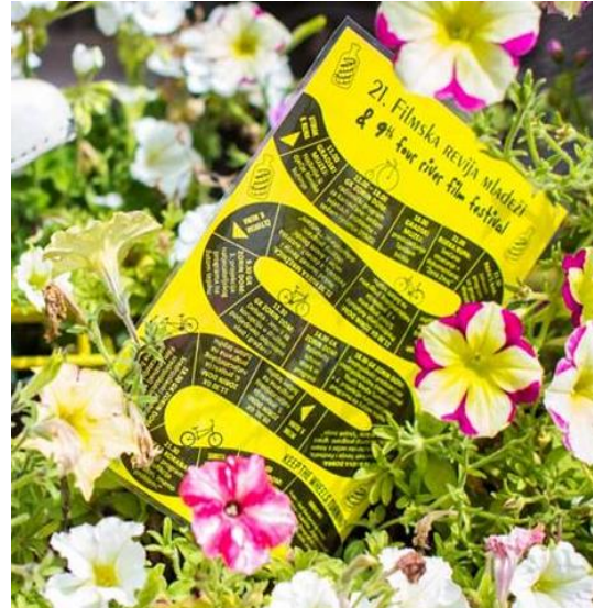
Slika 20. Letci FRFF-a & FraME