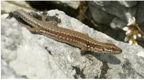
Slika 9. Siva gušterica

Na Papuku je zabilježena na Jankovcu – 21 jedinka, Zvečevu – 4 jedinke i Svinjarevcu – 9 jedinki (BOGDANOVIĆ, 2013.).