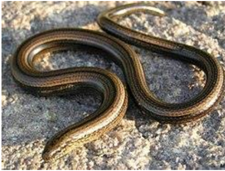
Slika 8. Obični sljepić

jedinki, Sekulinci potoku – 6 jedinki i Slatinskom Drenovcu – 9 jedinki (BOGDANOVIĆ, 2013.).