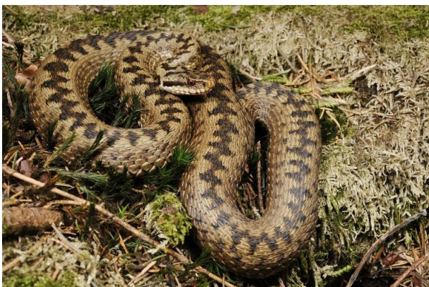
Slika 7. Šarena riđovka

Na Papuku je zabilježena na Jankovcu – 2 jedinke, Zvečevu – 1 jedinka, Bistri – 2 jedinke i Svinjarevcu – 3 jedinke (BOGDANOVIĆ, 2013.).