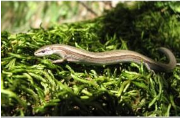
Slika 2. Ivanjski rovaš ( Ablepharus kitaibelii )