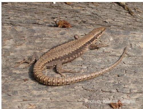
Slika 12. Zidna gušterica