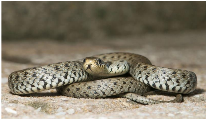
Slika 3. Obična bjelouška ( Natrix natrix )

Na Papuku je zabilježena na Jankovcu- 26 jedinki, Zvečevu- 20 jedinki, Bistri - 18 jedinki, Vetovu ribnjacima - 19 jedinki, Kutjevo potoku - 9 jedinki, Dubočanka potoku - 19 jedinki, , Orahovačkom jezeru - 16 jedinki, Duboka potoku - 8 jedinki, Djedovici - 13 jedinki, Voćin jezeru-12 jedinki, Sekulinci potok - 11 jedinki i Slatinskom drenovcu - 12 jedinki (BOGDANOVIĆ, 2013.).