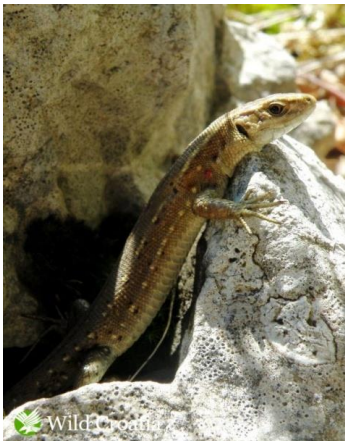
Slika 11. Živorodna gušterica

Na Papuku je zabilježena na Jankovcu – 24 jedinke, Zvečevu – 23 jedinke, Djedovici – 15 jedinki, Dubočanka potoku – 7 jedinki, Fosilnom nalazištu – 20 jedinki, Voćin jezeru – 11 jedinki i Slatinski Drenovac -12 jedinki (BOGDANOVIĆ, 2013.).