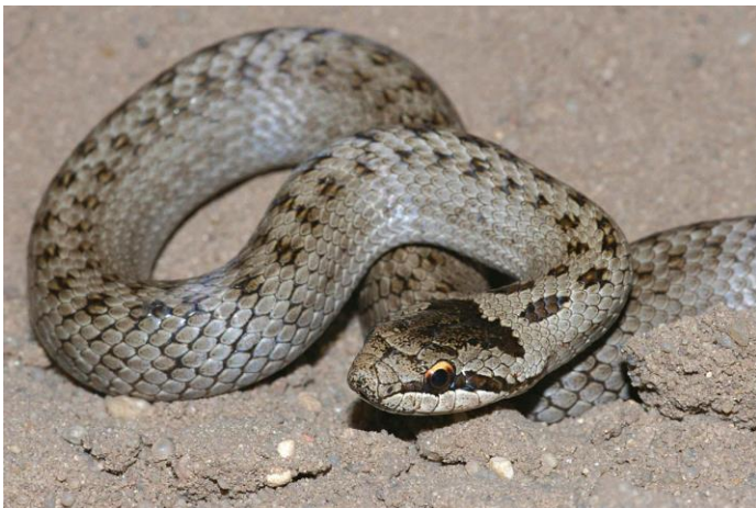
Slika 6. Obična smukulja

Na Papuku je zabilježena na Jankovcu – 2 jedinke, Zvečevu – 3 jedinke, Bistri – 3 jedinke, Svinjarevcu – 1 jedinka, Vetovo ribnjacima – 4 jedinke, Kutjevo potoku – 3 jedinke, Dubočanka potoku – 3 jedinke, Brzaji – 2 jedinke, Orahovačkom jezeru – 1 jedinka i Foslinom nalazištu – 1 jedinka (BOGDANOVIĆ, 2013.).