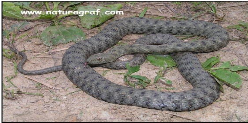
Slika 4. Kockasta vodenjača ( Natrix tessellata LAURENTI, 1768).