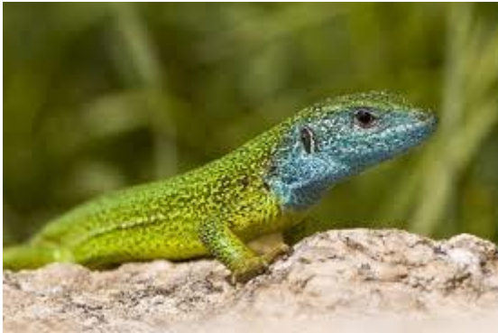
Slika 10. Obični zelembać

Na Papuku je zabilježen na Jankvcu – 24 jedinke, Zvečevu – 31 jedinka, Bistri – 14 jedinki, Orahovačkom jezeru – 21 jedinka, Vetovo ribnjacima – 21 jedinka, Kutjevo potoku – 27 jedinki, Brzaji – 17 jedinki, Djedovica – 11 jedinki, Fosilnom nalazištu – 7 jedinki, Svinjarevcu – 12 jedinki, Voćin jezeru – 16 jedinki, Sekulinci potoku – 22 jedinke i Slatinski Drenovac – 22 jedinke (BOGDANOVIĆ, 2013.).