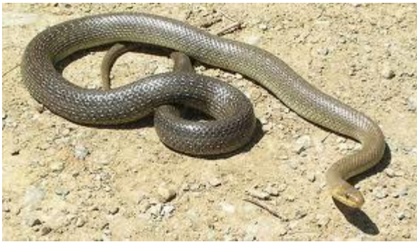
Slika 5. Obična bjelica

Na Papuku je zabilježena na Jankovcu - 7 jedinki, Zvečevu - 3 jedinke, Bistri - 2 jedinke, Svinjarevcu - 5 jedinki, Vetovo ribnjacima - 7 jedinki, Kutjevo potoku - 4 jedinke, Dubočanka potoku - 5 jedinki, Brzaji - 6 jedinki, Orahovačkom jezeru - 6 jedinki, Duboka potoku - 4 jedinke, Djedovici - 3 jedinke, Voćin jezeru - 4 jedinke i Sekulinci potoku - 6 jedinki (BOGDANOVIĆ, 2013.).