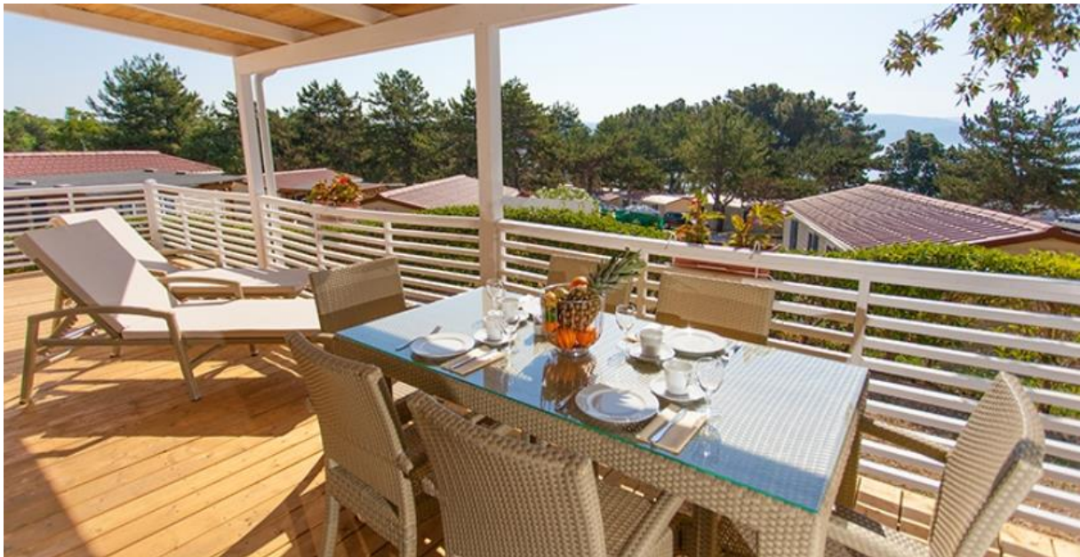
Slika 2: Mobilna kućica Lungomare Premium Family