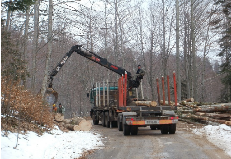
Slika 15. Utovar drvnih sortimenata