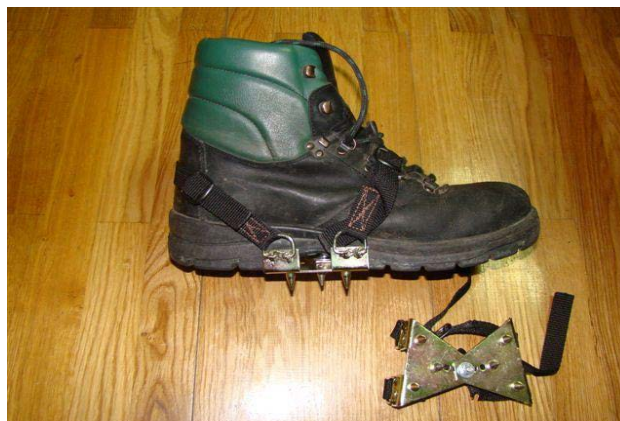
Slika 24. Dereze

U određenim uvjetima, na strminama, klizavim i kamenitim terenima, stabilnost radnika se može poboljšati primjerenom obućom koja ima đon za sprečavanje klizanja. Na velikim strminama treba upotrebljavati dereze.[10]