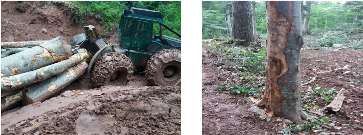
Slika 13. Štete nastale na tlu i na rubnim stablima uz vlak

okolnih stabala na radilištima, pažnja da ne bi došlo do narušavanja šumskog ekosustava, zadaće je koje se provode u svrhu očuvanja FSC certifikata.