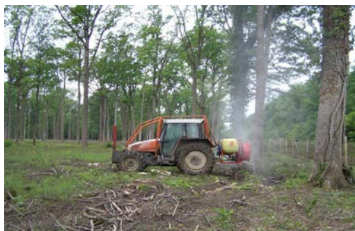
Slika 19. Kemijska priprema tla traktorom s amortizerom