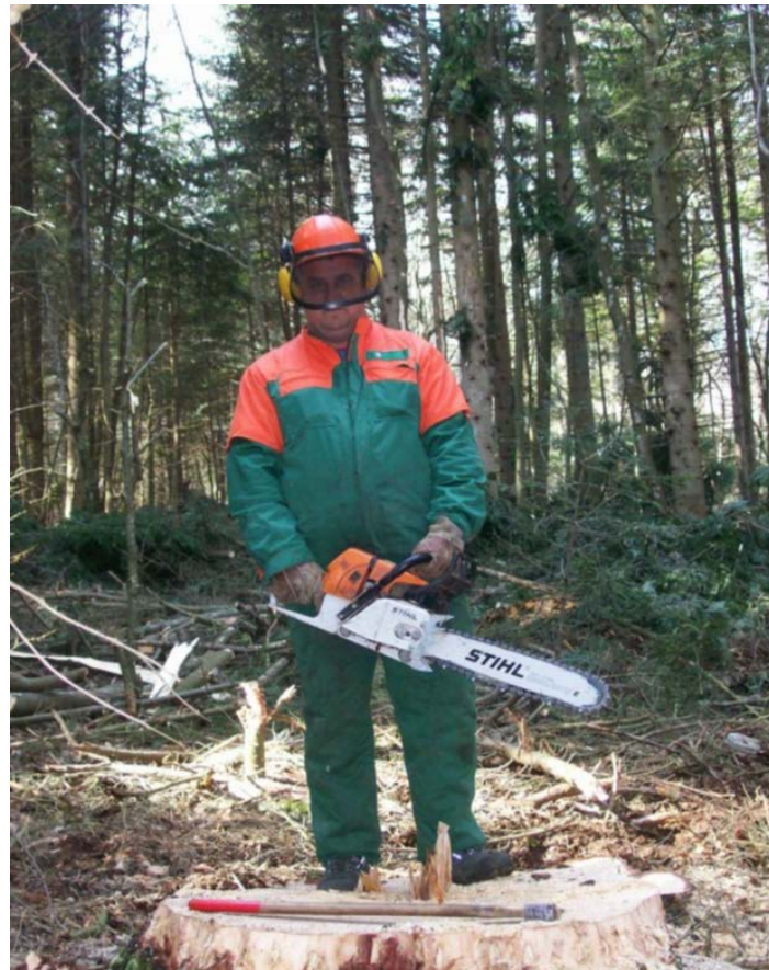
Slika 7. Radnik-sjekač s potpunom zaštitnom opremom

U šumariji Gospić (gdje su rađeni terenski radovi i očevidi) radnici koji rade na poslovima sječe i izrade drvnih sortimenata u potpunosti su i na vrijeme opskrbljeni osobnim zaštitnim sredstvima, ali prilikom obavljanja nadzora, u više je navrata, zabilježeno da ih radnici ne koriste ili rade s neispravnim sredstvima.