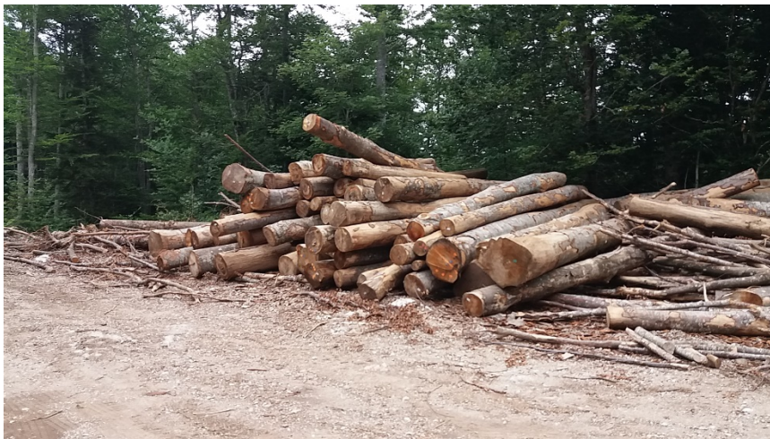
Slika 12. Pomoćno stovarište

Na pomoćnom stovarištu drveni sortimenti slažu se na hrpu, a uhrpavanje i prigravanje drvnih sortimenata obavlja se hidrauličkim dizalicama.