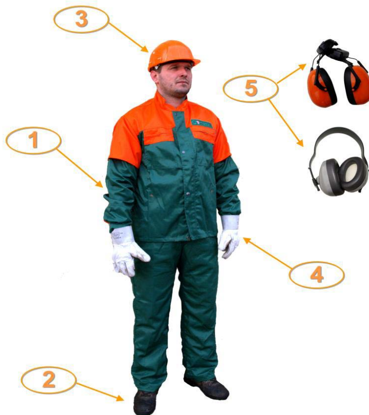
Slika 14. Zaštitno odijelo traktorista i kopčša