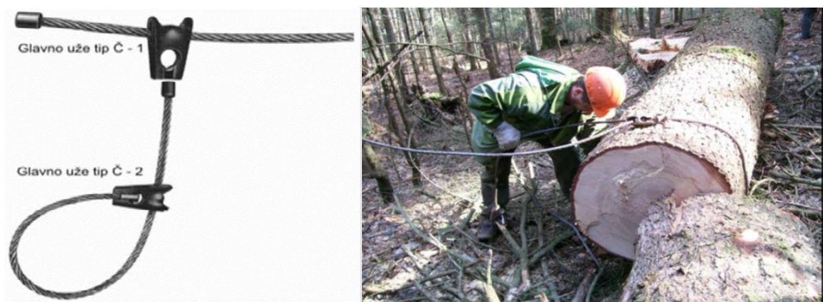
Slika 10. Prikaz glavnog vučnog užeta i čelične omče

Kopčlaš pronalazi izrađene drvene sortimente i navodi traktoristu do istih. Nakon toga kopčlaš razvlači glavno vučno čelično uže – sajlu do drvnih sortimenata, a svaki drveni sortiment veže čeličnom omčom (tzv. Čoker).