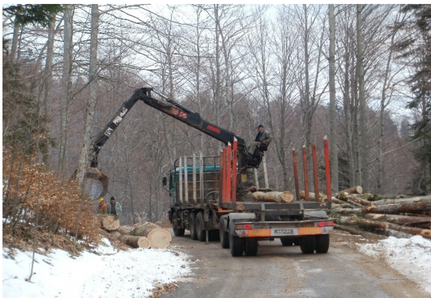
Slika 15. Utovar drvnih sortimenata