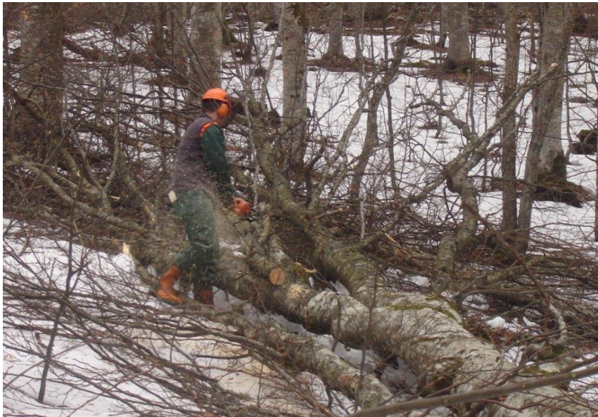
Slika 6. Kresanje grana

čvrsto objema rukama, tako da palci zatvaraju krug s ostalim prstima šake. Najbolje je da je motorna pila prilikom kresanja naslonjena na deblo ili se nalazi uz tijelo. Prije početka piljenja grana potrebno je motoru pile osigurati puni broj okretaja (puni gas). [7]