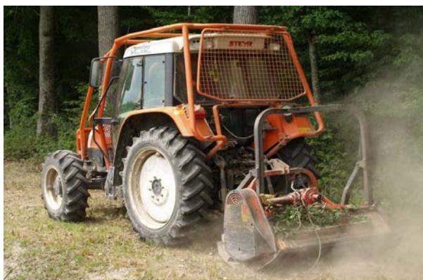
Slika 17. Strojna priprema staništa

Kemijska priprema staništa obavlja se atomizerima i prskalicama ručnim ili strojno pogonjenim uz uporabu pesticida.