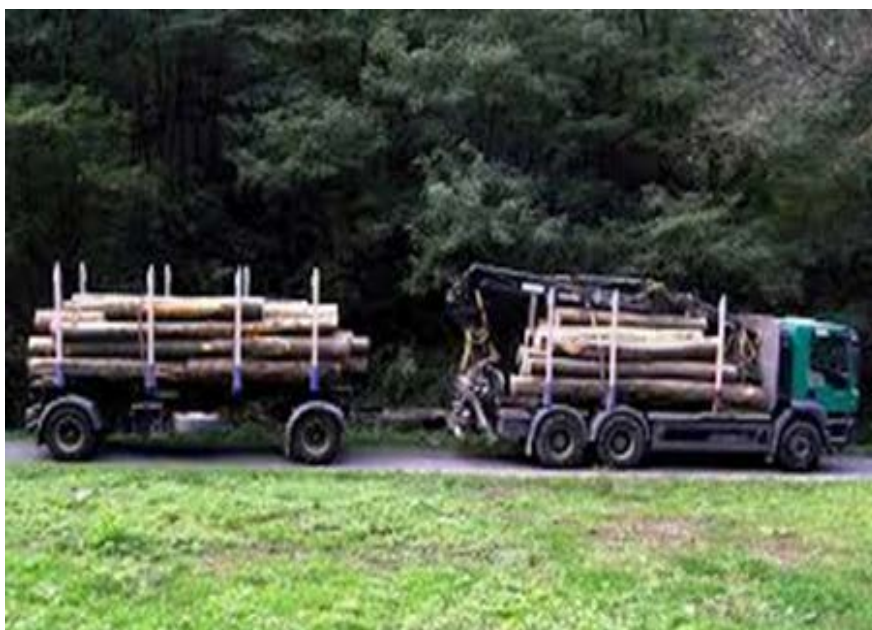
Slika 16. Prijevoz drvnih sortimenata