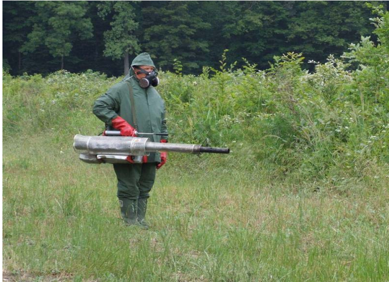
Slika 28. Osobna zaštitna sredstva pri radu s kemijskim sredstvima

Prilikom rada kemijskim sredstvima (pesticidima) zabranjeno je: jesti, pušiti i piti. Nakon obavljenog posla potrebno je skinuti zaštitnu opremu i temeljito oprati ruke i lice vodom i sapunom.