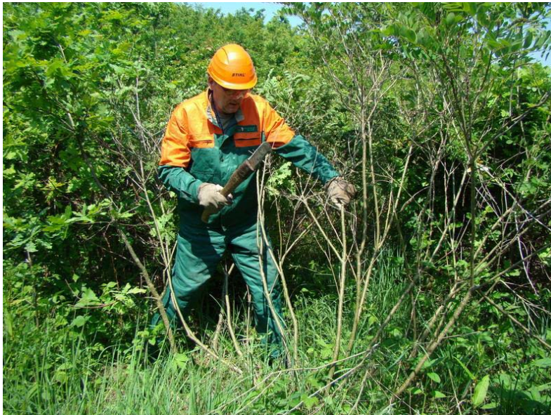
Slika 21. Njega mladika kosirom, ručno

Na njezi šuma najčešće ozljede na radu se događaju na njezi ponika i pomlatka te njezi mladika i čišćenju šuma. [9]