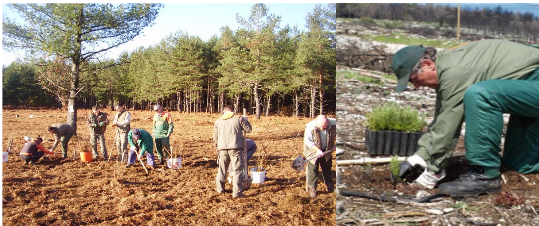
Slika 20. Ručna sadnja sadnica

Sjetva sjemena i sadnja sadnica može se obavljati ručno i strojno. Šumski radnici prilikom rada na sjetvi i sadnji upotrebljavaju razne alate i strojeve: motiku, kramp, štijaću, klinolike lopate, trnokop, škare raznih veličina (ručne i hidraulične), sjekire i druge pomoćne alate.