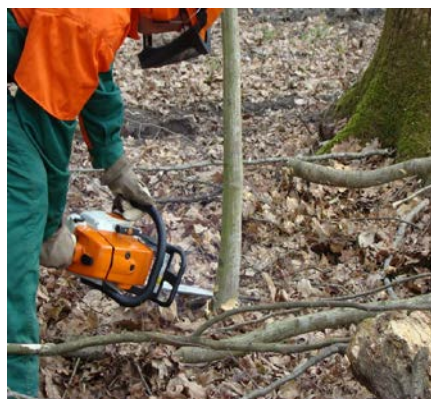
Slika 18. Ručna priprema staništa