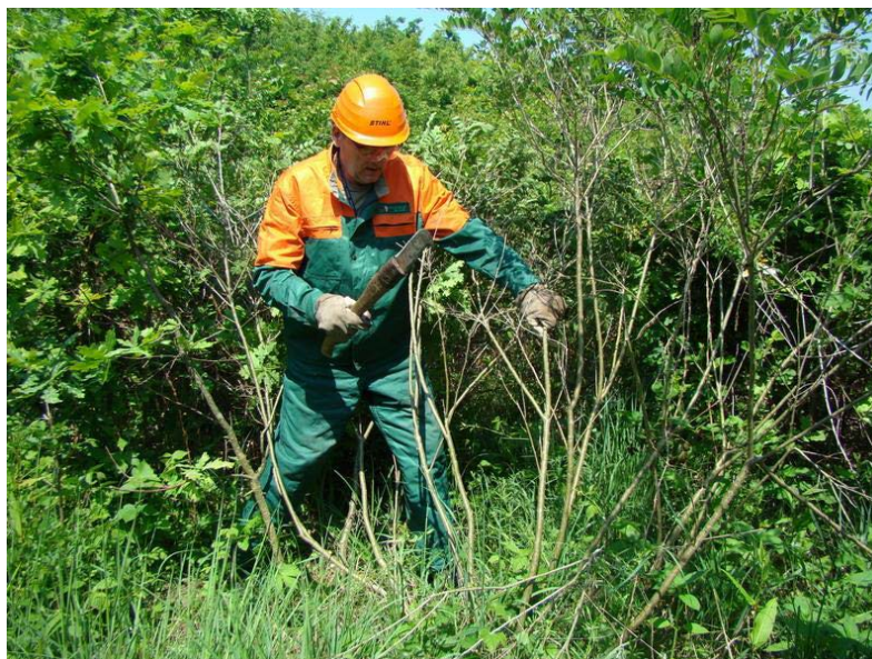
Slika 21. Njega mladika kosirom, ručno

Na njezi šuma najčešće ozljede na radu se događaju na njezi ponika i pomlatka te njezi mladika i čišćenju šuma. [9]