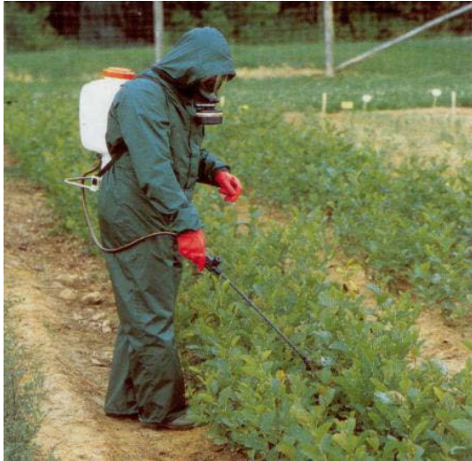
Slika 26. Ručna prskalice