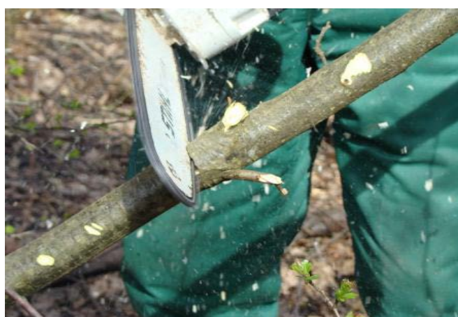
Slika 22. Pikraćivanje stabalca

Pikraćivanje stabalca radimo postupkom rezova odozgo i odozdo, ponavljajući rezove dok krošnja ne padne na zemlju. Prilikom pikraćivanja stabalaca treba obratiti posebnu pažnju na opasnost od ozljede nogu, kao i na opasnosti od bočne napetosti stabalaca. [9]