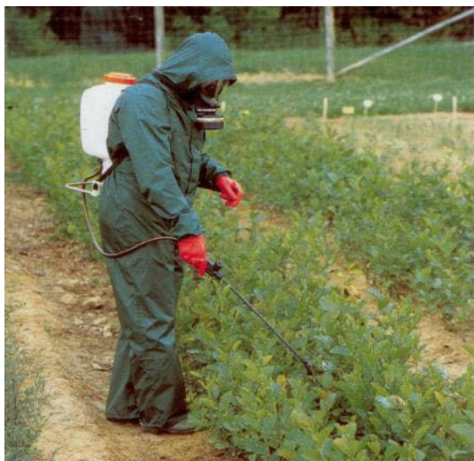
Slika 26. Ručna prskalice