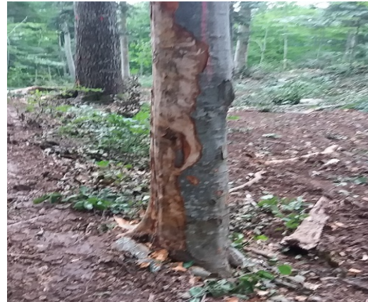
Slika 13. Štete nastale na tlu i na rubnim stablima uz vlak