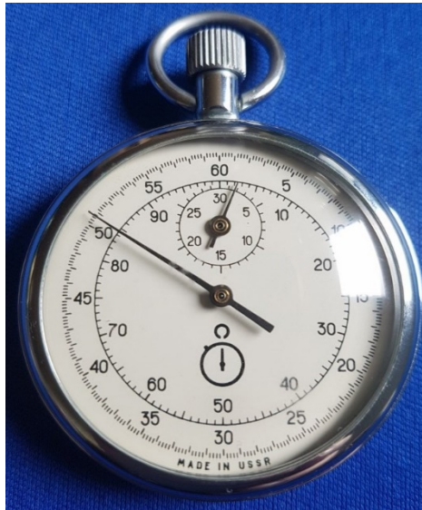
Slika 29. Kronometar (štoperica)

Kronometar koji mjeri vrijeme u minutama i centiminutama. Oni su najjednostavniji jer svakim zaustavljanjem vremena ostaje očitavanje na ekranu, a kronometar se sam resetira i odmah teče novo vrijeme. Vrijeme izraženo u centiminutama odmah je primjenjivo za konačan obračun.