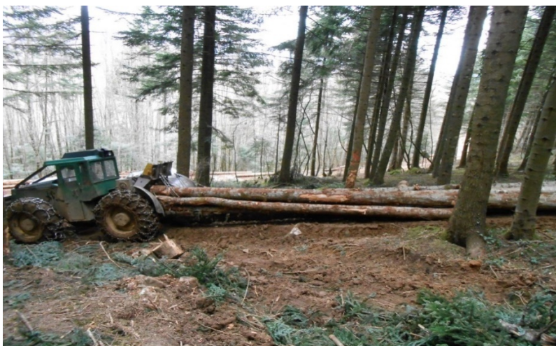
Slika 9. Privlačenje drvnih sortimenata

Zavisno od utvrđenog načina privlačenja drvnih sortimenata izrađuju se putevi – vlake po kojima će se vršiti izvlačenje. Širina vlake ovisi o vrsti stroja kojim će se vršiti izvlačenje, a mora biti najmanje metar šira od stroja. Elementi vlaka i pravci privlačenja moraju biti prilagođeni tehničkim mogućnostima sredstava za privlačenje.