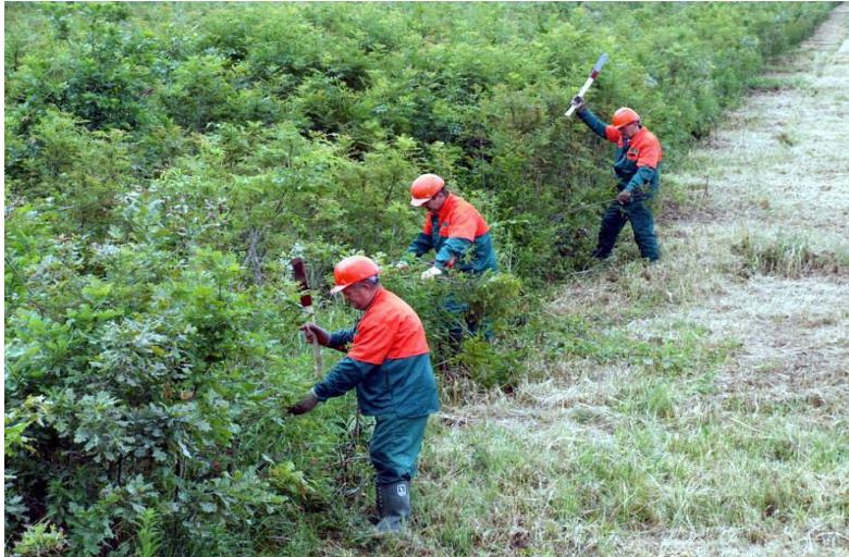
Slika 23. Pravilan razmak radnika

U određenim uvjetima, na strminama, klizavim i kamenitim terenima, stabilnost radnika se može poboljšati primjerenom obućom koja ima đon za sprečavanje klizanja. Na velikim strminama treba upotrebljavati dereze.[10]