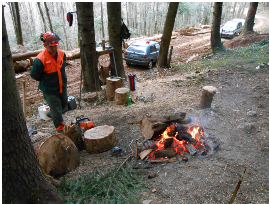
Slika 1. Šumsko radilište

Šumsko radilište je prostorno i vremenski zaokružena površina šume, unutar jedne gospodarske jedinice sa određenim početkom i završetkom izvođenja radova. Šumsko se radilište može sastojati od jednog ili više odjela/odsjeka, odnosno katastarskih čestica na