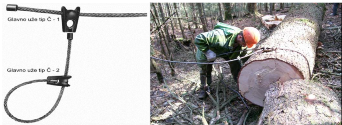
Slika 10. Prikaz glavnog vučnog užeta i čelične omče

Kopčlaš pronalazi izrađene drvene sortimente i navodi traktoristu do istih. Nakon toga kopčlaš razvlači glavno vučno čelično uže – sajlu do drvnih sortimenata, a svaki drveni sortiment veže čeličnom omčom (tzv. Čoker).