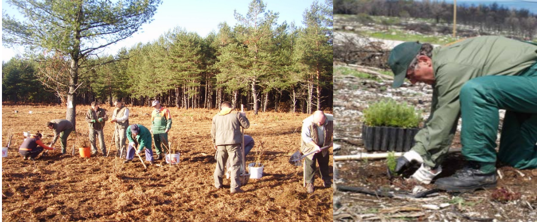
Slika 20. Ručna sadnja sadnica

Sjetva sjemena i sadnja sadnica može se obavljati ručno i strojno. Šumski radnici prilikom rada na sjetvi i sadnji upotrebljavaju razne alate i strojeve: motiku, kramp, štijaću, klinolike lopate, trnokop, škare raznih veličina (ručne i hidraulične), sjekire i druge pomoćne alate.