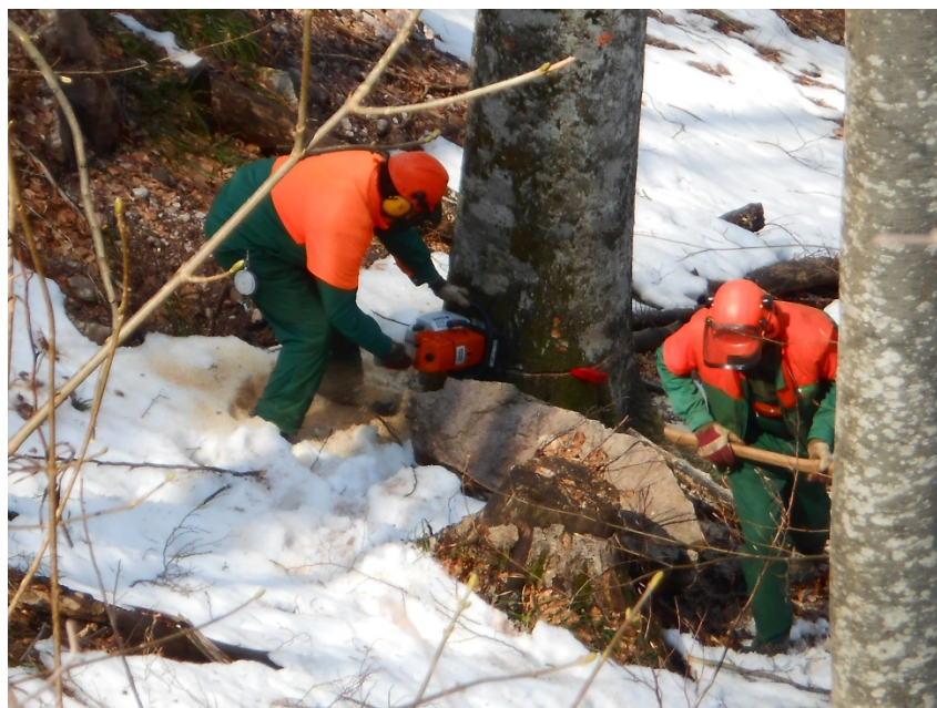
Slika 5. Rad sjekača na sječi stabla