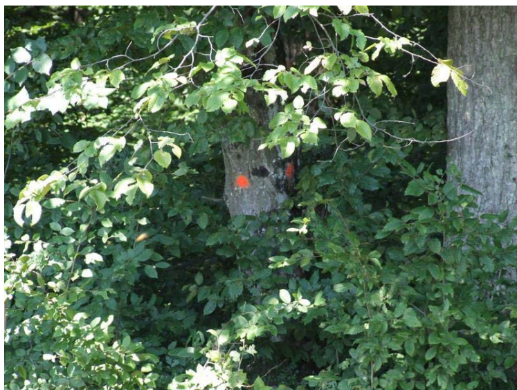
Slika 2. Doznačeno stablo