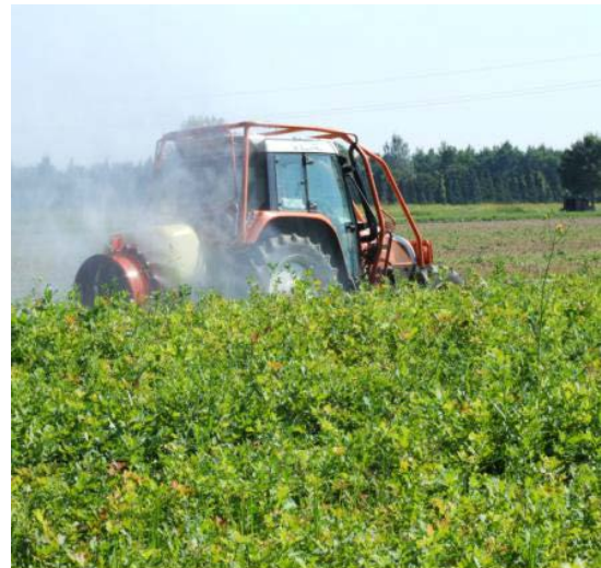
Slika 27. Atomizer

U šumarstvu se za zaštitu bilja od uzročnika bolesti, štetnika i drugih nepoželjnih organizama koriste biološka i kemijska sredstva pod imenom pesticidi. Pesticidi su zajednički naziv za: insekticide, fungicide, herbicide, rodenticide, itd. To su štetna i otrovna sredstva. Radovi s kemijskim sredstvima su poslovi s posebnim uvjetima rada i ljeti se ne mogu obavljati na temperaturama iznad 30 °C i za vrijeme vjetrova. [9] Radnici koji obavljaju poslove s pesticidima trebaju zadovoljavati posebne uvjete sukladno Pravilniku o poslovima s posebnim uvjetima rada.