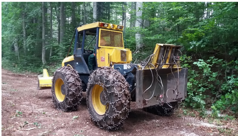
Slika 8. Ekotracer 120

U procesu pridobivanja drveta, nakon sječe i izrade, slijedi faza privlačenja i prijevoza drvnih sortimenata. Privlačenje drvnih sortimenata predstavlja njihovo pomicanje od panja do pomoćnog stovarišta. Radovi na privlačenju i prijevozu drveta obavljaju se na otvorenom prostoru, neuređenom terenu, a nerijetko i po lošim vremenskim uvjetima što može dovesti u opasnost radnike koji obavljaju taj posao. [8] Privlačenje drvnih sortimenata s radilišta do pomoćnog stovarišta obavlja se mehanizirano, a koriste se najčešće šumski traktori koji imaju ugrađeno dvobubanjno vitlo. Pravac, mjesto i način privlačenja drvnih sortimenata određuje se na osnovi plana o uređenju radilišta. On treba obuhvatiti elemente zaštite na radu ali i voditi računa prilagodljivosti upotrijebljenih strojeva, stanju sastojine i terena te eventualnim štetama koje mogu nastati na stablima i na tlu.