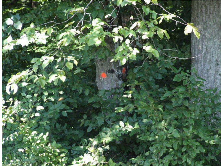
Slika 2. Doznačeno stablo