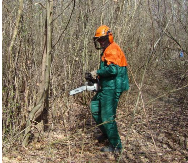
Slika 25. Osobna zaštitna sredstva