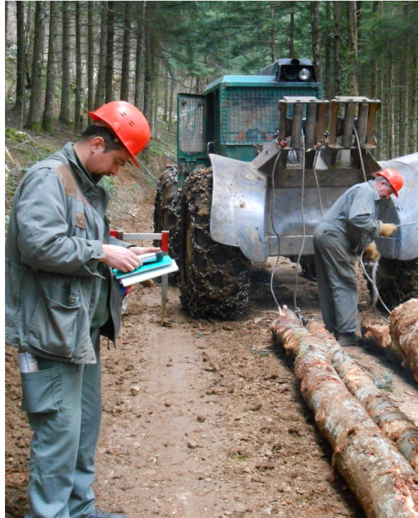
Slika 11. Otkopčavanje i zaprimanje privučene drvne mase

Na pomoćnom stovarištu drvni sortimenti slažu se na hrpu, a uhrpavanje i prigravanje drvnih sortimenata obavlja se hidrauličkim dizalicama.