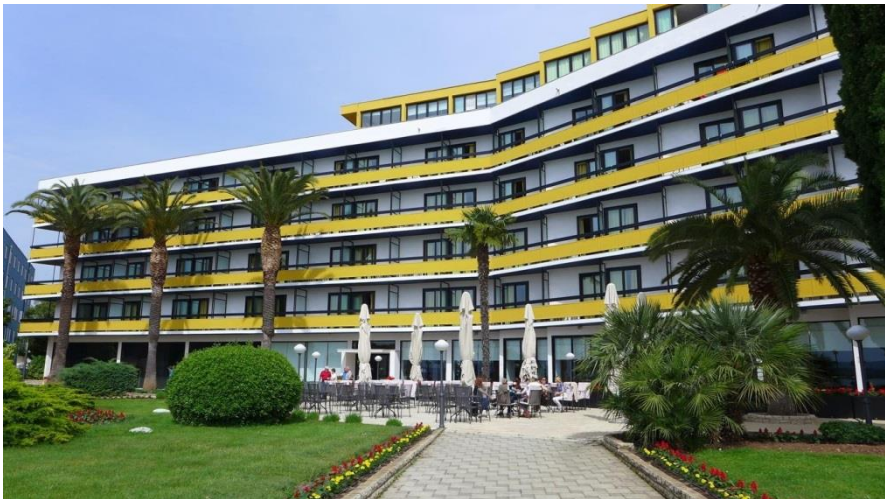
Slika 7: Hotel Ilirija (Biograd na Moru)