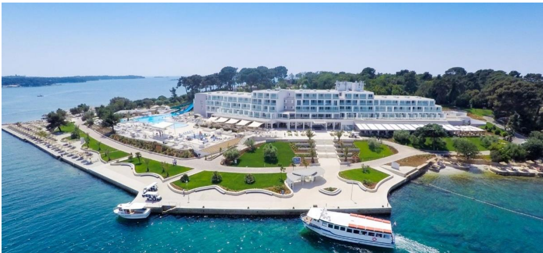
Slika 5: Valamar Isabella Island Resort (Poreč)