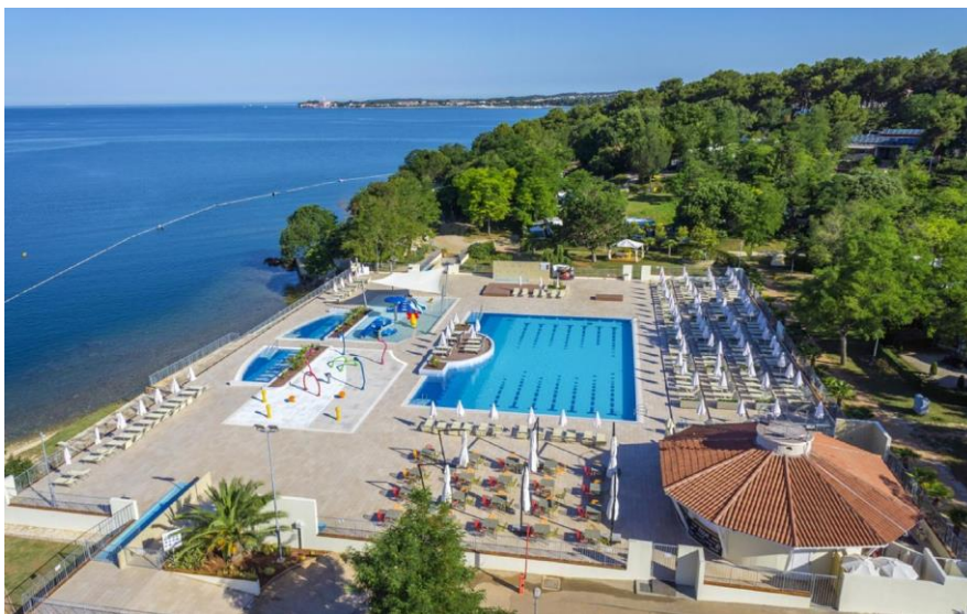
Slika 6: Lanterna Premium Camping Resort (Poreč)