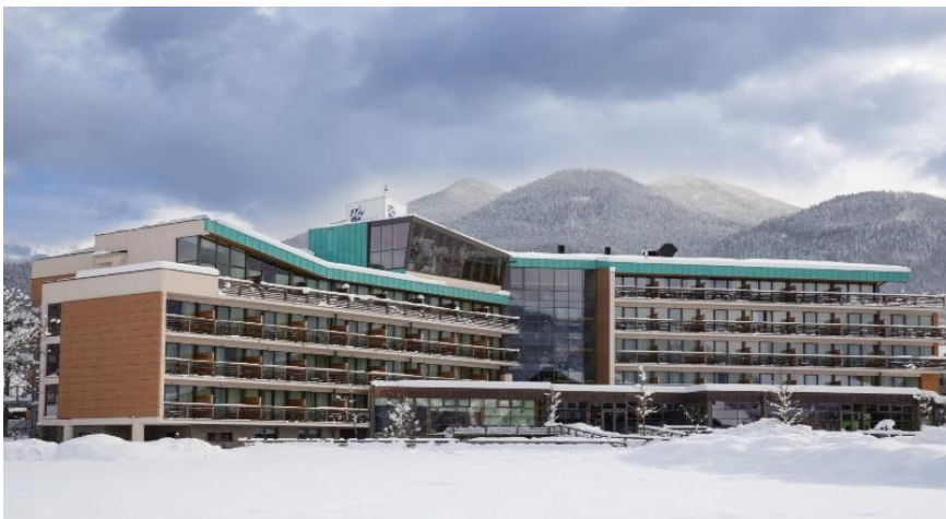
Slika 1: Bohinj Eco Hotel (Slovenija)