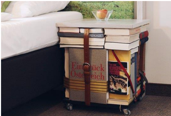
Slika 4: Primjer upcyclinga