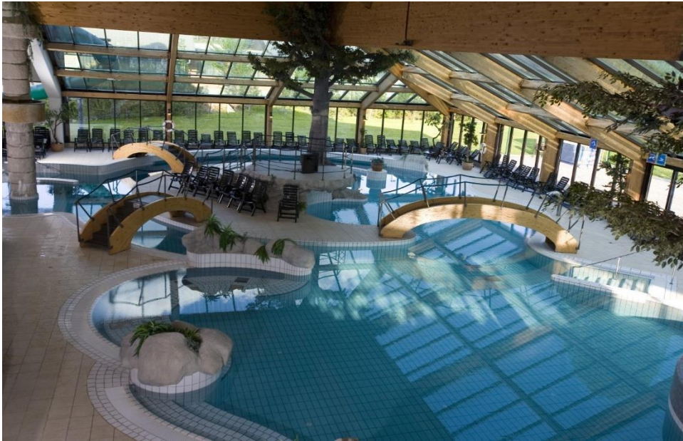
Slika 2: Bohinj Eco Hotel