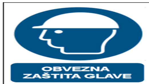
Slika 5 Znak obavijesti o obvezi zaštite glave