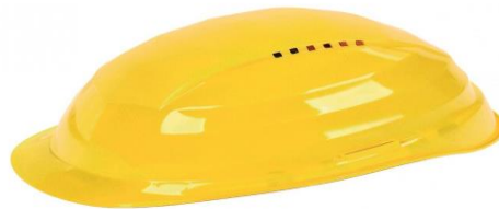
Slika 6 Zaštitna kaciga za osobnu zaštitu norma EN 397