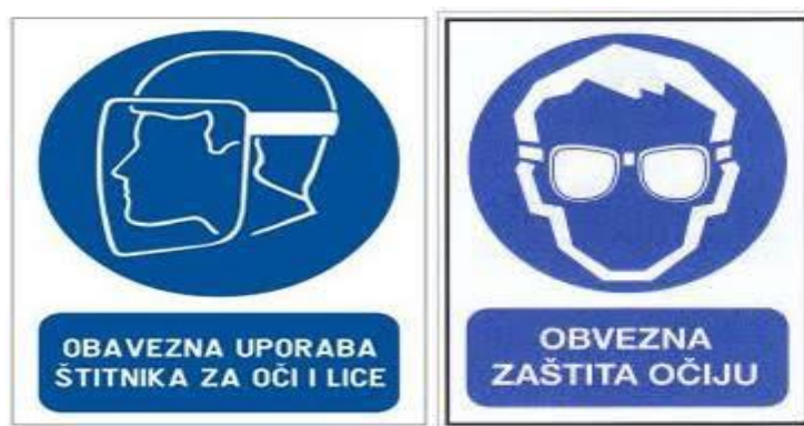
Slika 9 Znak obavijesti o obvezi zaštite očiju i sluha