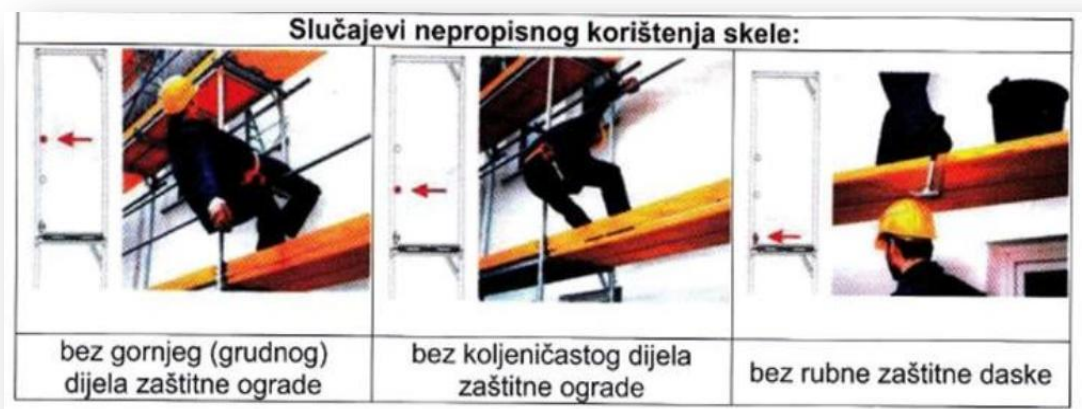
Slika 3 Korištenje skele na zidarskim radovima

Skele su pomoćne konstrukcije koje služe za vršenje radova u građevinarstvu na visini većoj od 150 cm iznad tla. Moraju biti građene i postavljene prema planovima koji sadrže: dimenzije skele i svih njenih sastavnih elemenata, sredstva za međusobno spajanje sastavnih elemenata, način pričvršćivanja skele za objekt odnosno tlo, najveće dopušteno opterećenje, vrste materijala i njihov kvaliteta, statički proračun nosećih elemenata, te uputstvo za montažu i demontažu skele. Skele mogu postavljati, prepravljati, dopunjavati i demontirati samo stručno obučeni radnici, zdravstveno sposobni rad na visini i to pod nadzorom određene stručne osobe na gradilištu. Ako se pri postavljanju skele naiđe na električne vodove ili druge prepreke onda se mora obustaviti rad i poduzeti kod nadležne organizacije mjere za isključenje struje odnosno uklanjanje prepreka. Udaljenost poda skele od zida objekta ne smije biti veća od 20 cm. Čista širina poda skele ne smije biti manja od 80 cm 82 .