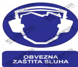
Slika 7 Znak obavijesti o obvezi zaštite sluha