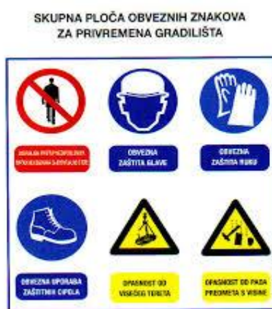
Slika 2 Znakovi obavijesti zaštite na radu