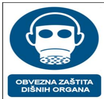
Slika 10 Znak obavijesti o obvezi zaštite organa disanja