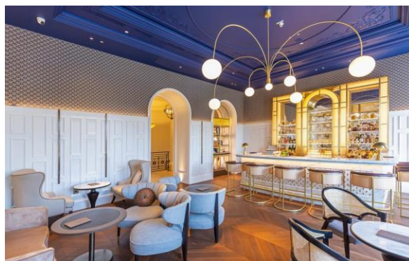
Slika 3. Interijer bara u Hilton Imperial hotelu u Dubrovniku