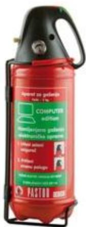
Slika 8. Vatrogasni aparat sa zamjenskim sredstvom za halon. [6]

Vatrogasni aparati sa halonom više se ne proizvode i ne mogu se stavljati u prodaju jer je istraživanjima utvrđeno da haloni oštećuju ozonski omotač. Upotrebljavali su se halon 1301 u stabilnim sustavima za gašenje požara i halon 1211 u vatrogasnim aparatima. Danas se još koriste u nekim industrijama poput vojne, avionske i svemirska gdje zamjenska sredstva ne mogu djelovati efikasno kao haloni, a da se ne ugroze ljudski životi. [4]