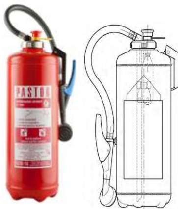
Slika 10. Vatrogasni aparat sa vodom. [5]

Konstrukcija ovog vatrogasnoga aparata slična je kao vatrogasnog aparata s bočicom koji koristi prah kao sredstvo za gašenje te je i aktiviranje identično. Razlika je samo u mlaznici gdje kod vatrogasnih aparata sa vodom imamo mlaznicu za raspršenu vodu, tzv. tuš mlaznicu te je unutrašnjost spremnika zaštićena od korozije. Nikako nisu pogodni za gašenje uređaja pod naponom te trebaju imati upozorenje na uputstvu ili dodatnu naljepnicu da se ne smiju gasiti uređaji pod naponom. Ovi vatrogasni aparati pogodni su za gašenje požara razreda A i B. Vodi se mogu dodati dodatci kojima se poveća efekt gašenja. [4]