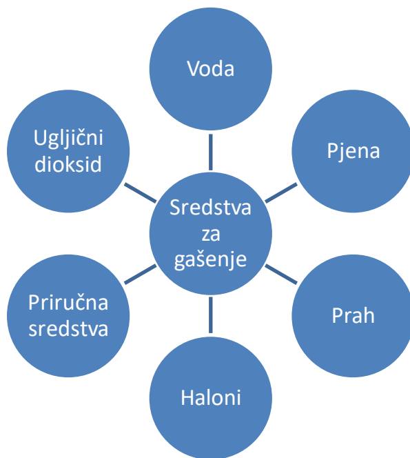
Slika 4. Pregled i podjela sredstava za gašenje. [1]