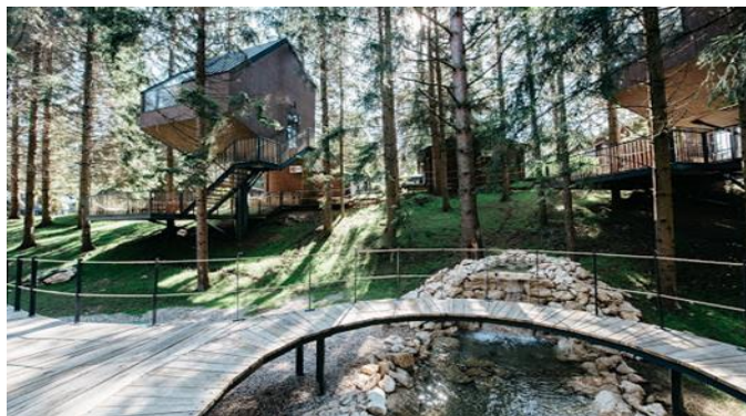
Slika 3: Glamping - Plitvice Holiday Resort