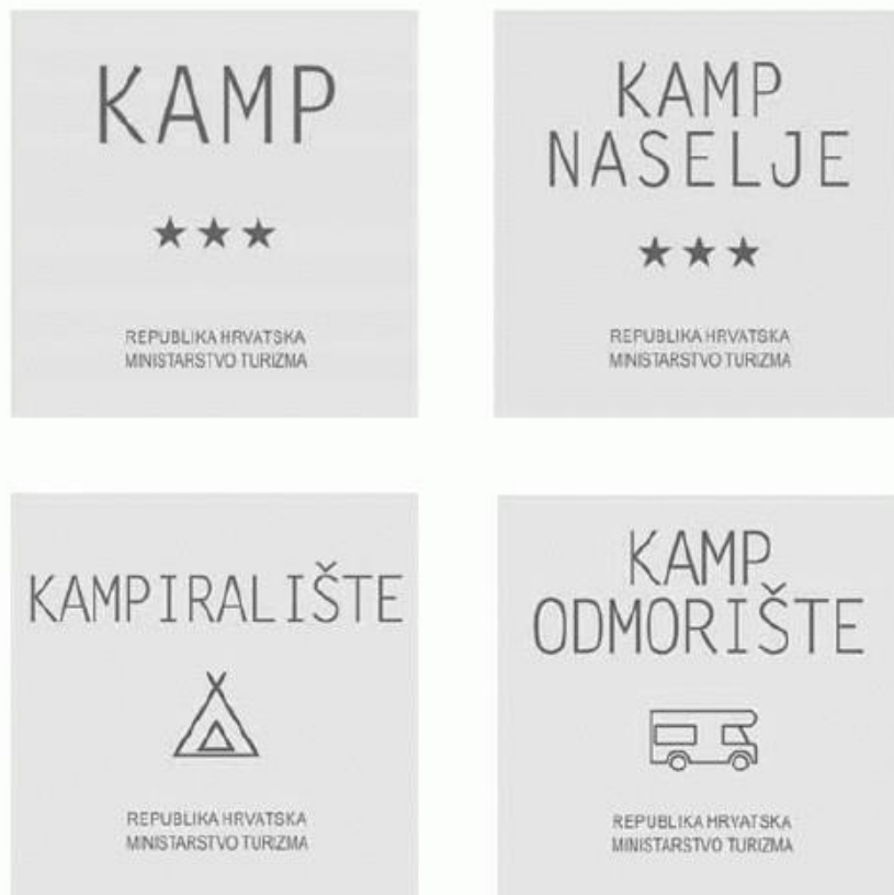
Slika 2: Grafička rješenja standardiziranih ploča za pojedine vrste kampa