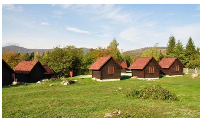
Slika 6: Autokamp Korana