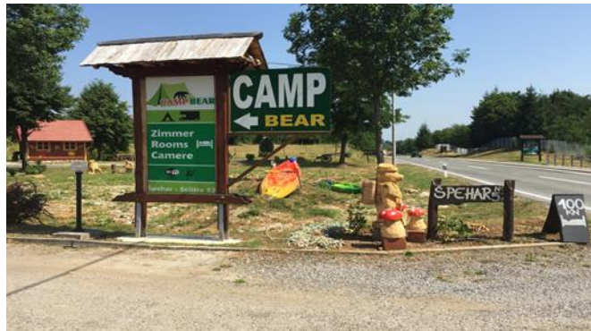
Slika 8: Kamp Bear