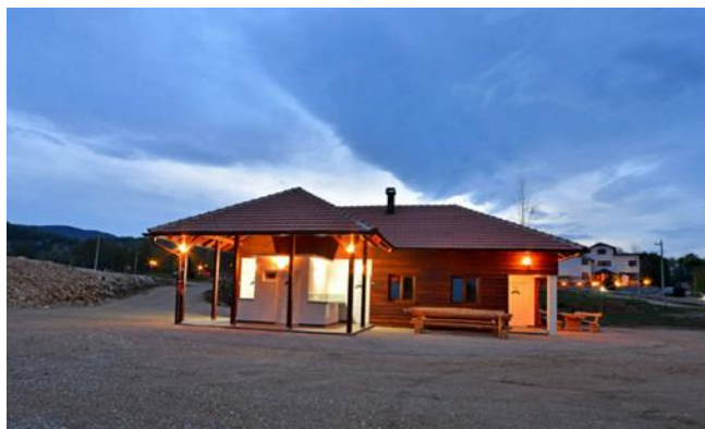
Slika 9: Kampiralište Korita