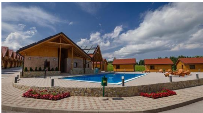
Slika 10: Holiday park Macola