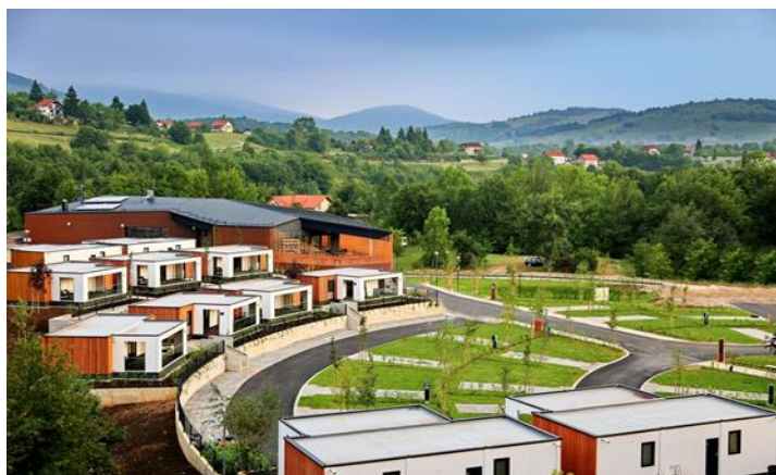
Slika 5: Camping Plitvice