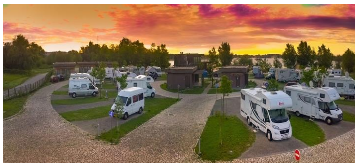
Slika 1: Kamp Zagreb