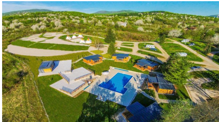
Slika 4: Plitvice Holiday Resort