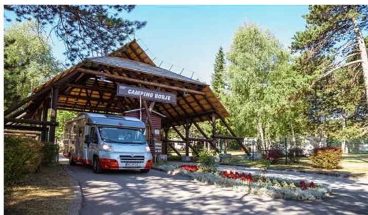
Slika 7: Autokamp Borje