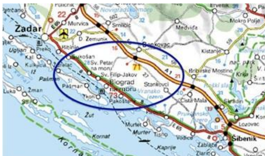
Slika 1. Geografski položaj Biograda na Moru