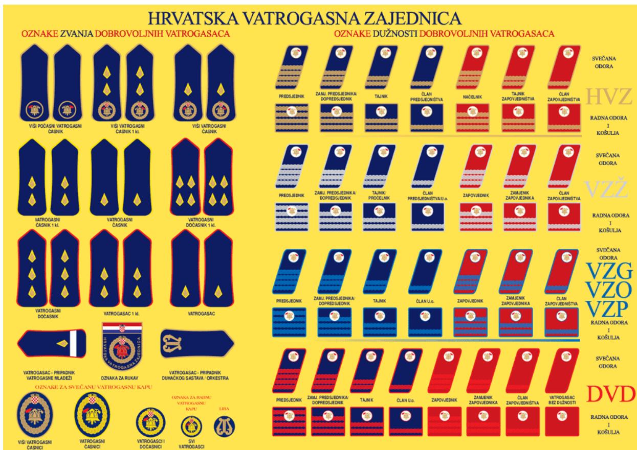
Slika 3. Vatrogasne oznake [13]

časnik i vatrogasni časnik prve klase imaju baklje opšivene ispuskom zlatne boje. Jedna baklja označava vatrogasnog časnika, dok dvije baklje označavaju vatrogasnog časnika prve klase. Viši vatrogasni časnik i viši vatrogasni časnik prve klase imaju vatrogasni znak zlatne boje i simbolizirane plamene baklje. Počasni viši vatrogasni časnik ima tri baklje s ispuskom zlatne boje. Vatrogasac pripadnik vatrogasne mladeži ima jednu traku bijele boje. Vatrogasci svoje oznake nose na vatrogasnim svečanim i radnim odorama. Izgled oznaka možemo vidjeti na Slici 3. Svečana odora nosi se prilikom vatrogasnih svečanosti kao što su obljetnice, svečani prijem i sprovodi. Svečana odora može biti muška ili ženska. Sastoji se od bluze i hlača, odnosno suknje te od svečane kape za muškarce i šeširića za žene. Radna odora jednaka je za muškarce i žene. Sastoji se od bluze, hlača i domobranke. Nosi se prilikom obavljanja svakodnevnih aktivnosti kao i kod stručnog osposobljavanja. Važno je za napomenuti da dobrovoljni vatrogasci nose i zaštitnu odoru za prilaz vatri, prolaz kroz vatru te za rad s opasnim tvarima. [1], [15]