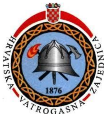
Slika 1. Oznaka Hrvatske vatrogasne zajednice [1]

vatrogasce“ izdan je 1882. godine. Obrađivao je teme kao što su: zadaci vatrogasnih društava, sredstva za gašenje i njihova upotreba, taktika gašenja požara te ustroj i oprema vatrogasnih postrojbi. Kako bi se unaprijedilo dobrovoljno vatrogastvo te zaštitili interesi dobrovoljnih vatrogasnih društava, Hrvatsko-slavonska vatrogasna zajednica je na skupštini 1899. godine utvrdila nacrt Gasnika za Kraljevinu Hrvatsku i Slavoniju. Zatražili su od Vlade da zakonom urede vatrogastvo u Kraljevini te da izdvajaju 2% od njihovih bruto prihoda za vatrogastvo. Na kraju skupštine, dobrovoljni vatrogasci Hrvatske dobili su svoju oznaku koju nose na ovratniku, nju čine kaciga i u križ postavljeni čekić i sjekirica (Slika broj 1). To je bio početak stvaranja jedinstvenih vatrogasnih oznaka u Hrvatskoj. [1], [11]