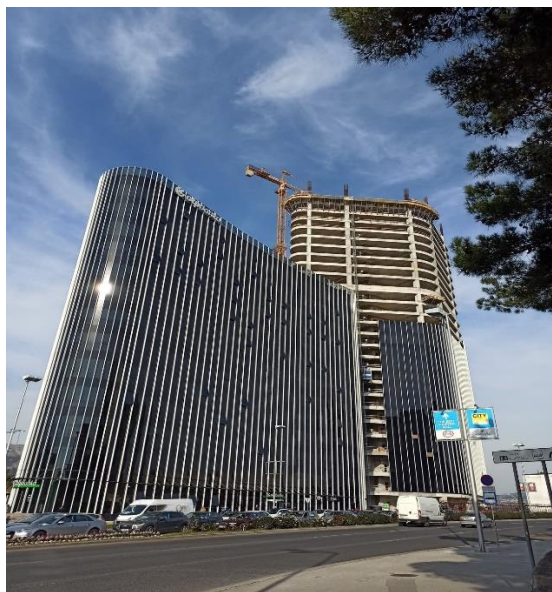
Slika 3: Sjedište OTP Banke u Splitu (lijevo) te u izgradnji (desno) najviši neboder u RH

U proteklom je desetljeću Split postao turistička hit destinacija, posebno mladih te je postao turistički šampion Hrvatske. U 2019. je ostvario 943 907 turističkih dolazaka, približujući se iznimno impresivnoj brojci od čak milijun turista, dok je broj noćenja iznosio 2,75 milijuna. 11 Te brojke su naravno i mnogo veće ako ubrojimo i okvirnu brojku od 300 000 kruzerskih posjetitelja te sve one koji prolaze kroz grad ili spavaju u neregistriranim objektima. Takve brojke iznimno potiču i lokalnu ekonomiju, od onih koji se direktno bave turističkom djelatnošću pa sve do drugih grana ekonomije koje indirektno također ostvaruju rezultate u kojima turisti igraju značajnu ulogu. U gradu buja privatni smještaj ali i sve veći broj luksuznih hotela, iznimnih ugostiteljskih objekata koji dobivaju nagrade na državnoj razini što za inovativnost i kreativnost, što za ambijent i kvalitetu hrane a iz godine u godinu novi restorani upotpunjuju i listu preporuka francuskog Michelinovog vodiča za Hrvatsku, svjetski priznatog vodiča za visoku gastronomiju. Iako brojke možda neće to direktno prikazati, financijski utjecaj turizma na ekonomiju grada Splita danas je postao toliko relevantan da se zaista može reći kako je postao glavna ekonomska pokretačka sila grada.