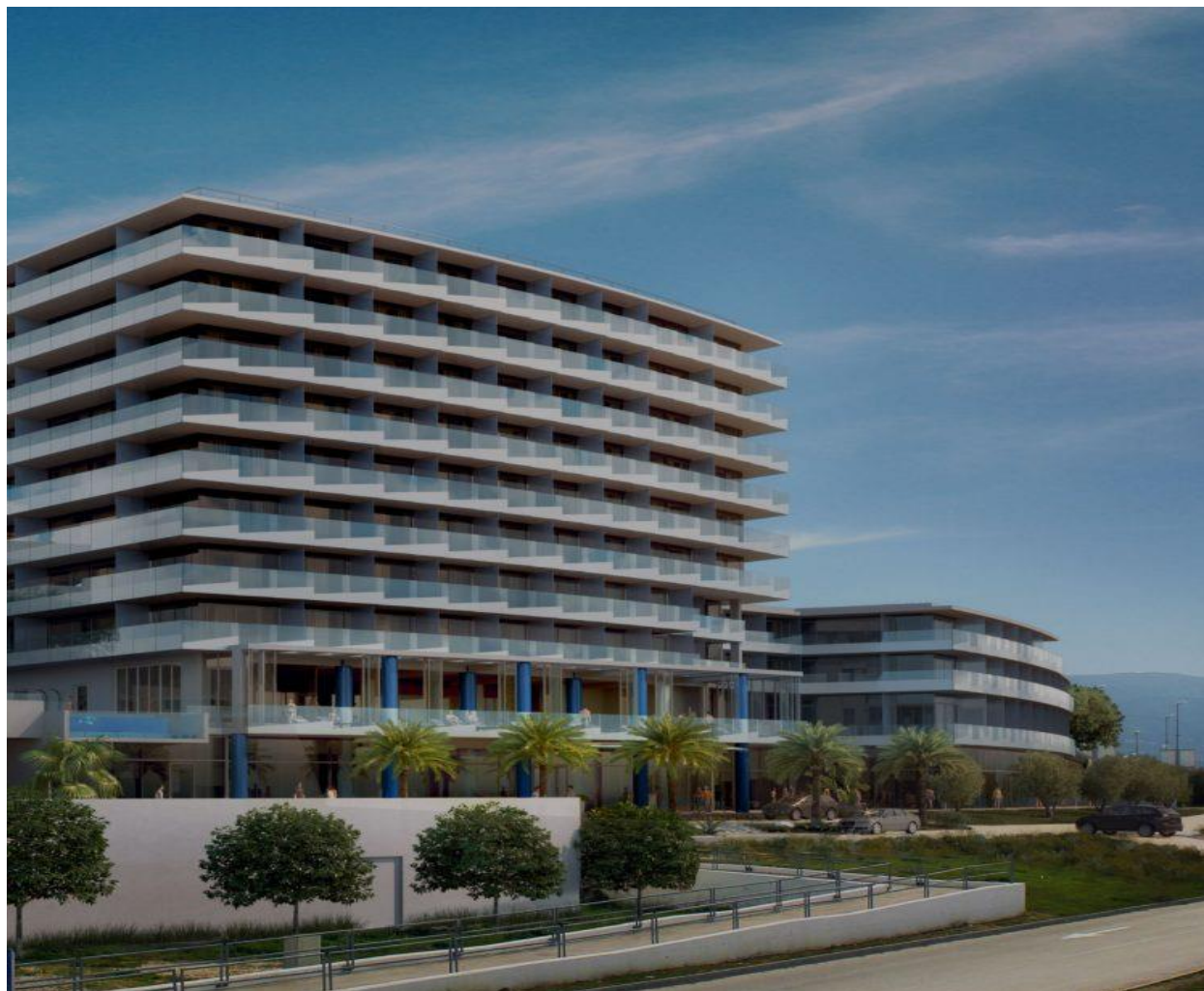
Slika 4: Hotel Amphora Split