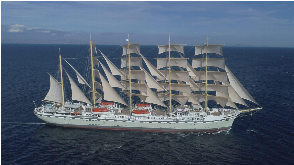
Slika 2: Flying Clipper