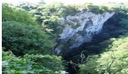
Slika 3. Pazinska jama