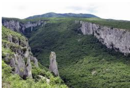
Slika 4. Vela draga