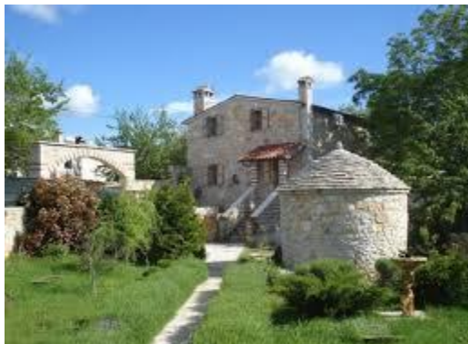
Slika 5. Kamena kuća u Istri