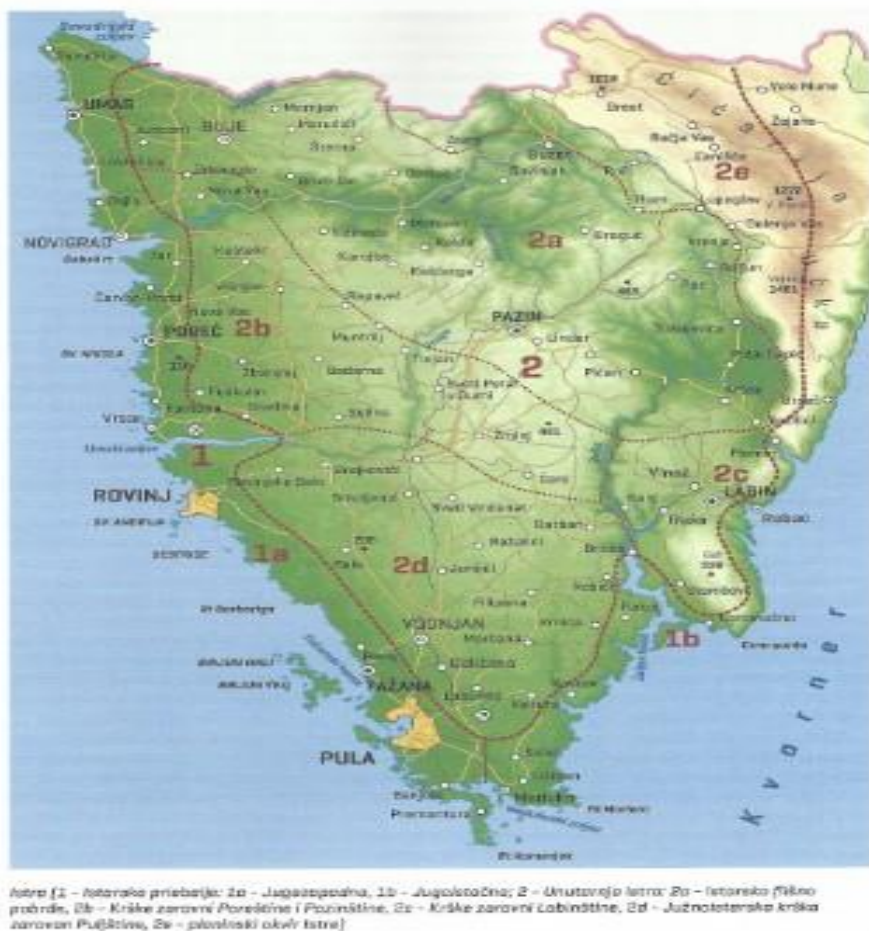
Slika 1. Geografska karta Istre