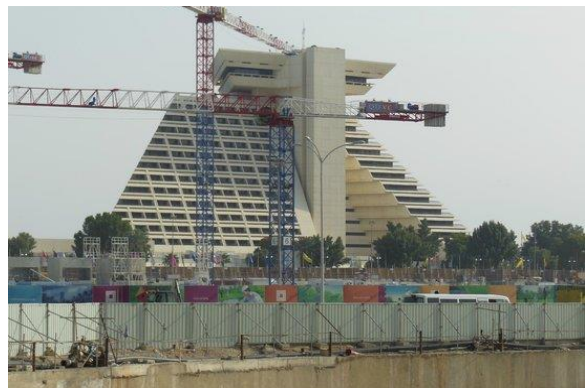
Slika 4. Gradnja Sheraton Doha Hotela

IZVOR: TripAdvisor.com, http://www.tripadvisor.com , 7.11.2015.