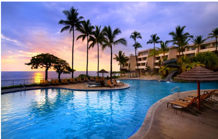
Slika 3. Sheraton Kona Resort & Spa