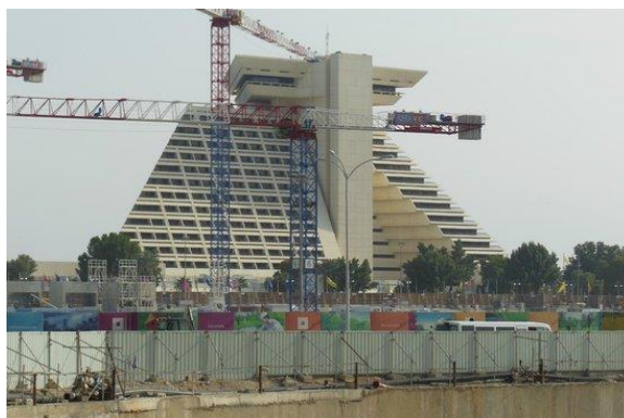
Slika 4. Gradnja Sheraton Doha Hotela