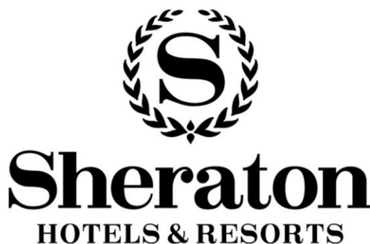
Slika 2. Logo hotelskog lanca Sheraton