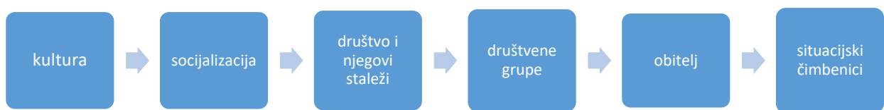
Grafikon 1. Društveni čimbenici