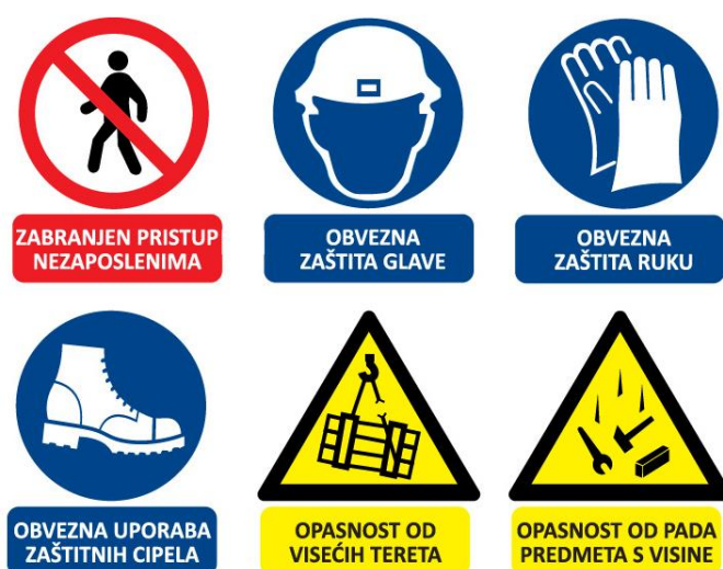
Sl. 3. Primjer ploče sa sigurnosnim znakovima

Najčešće znakovi zabrane su zabranjen pristup nezaposlenima a obaveze su obavezna zaštita glave, ruku i nogu, neke od opasnosti na gradilištu su opasnost od visećih tereta i opasnost od pada predmeta s visine. Ove znakovi se mogu razlikovati od gradilišta do gradilišta.