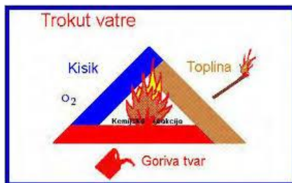
Slika 1 - trokut gorenja