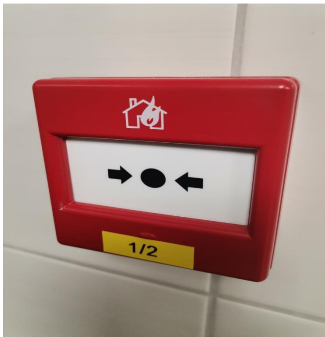
Slika 8 - Ručni javljač požara Fulleon, ugrađen u restoranu „Labudovac“