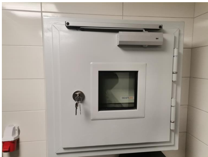
Slika 11 - Vatroporni ormar T60, ugrađen u Restoranu „Labudovac“