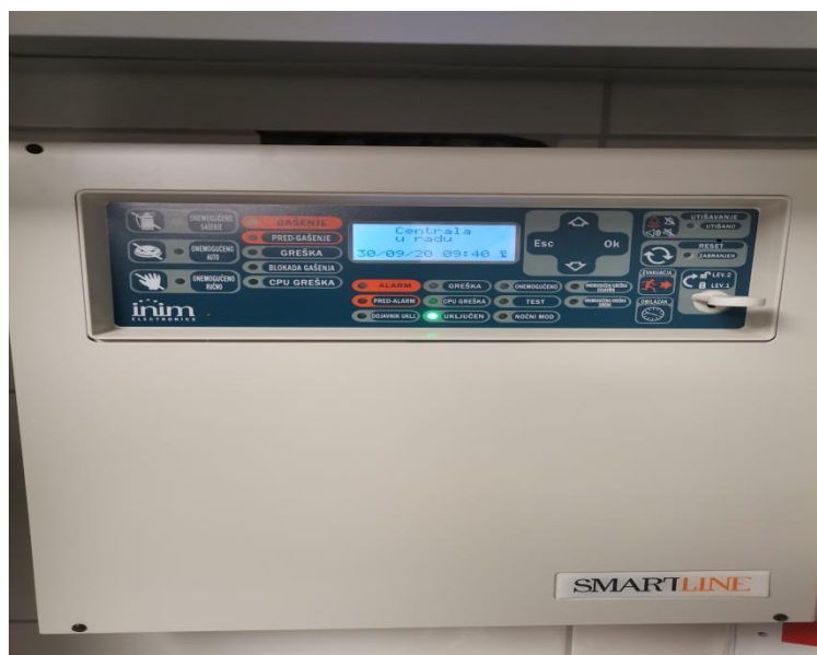
Slika 10 - Centrala dojava požara „Smartline 020/4, ugrađena u Restoran „Labudovac“