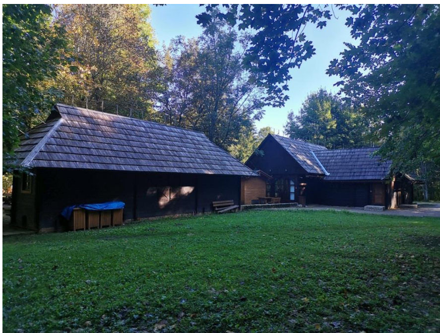
Slika 5 - Restoran „Labudovac“ gledan sa zadnje strane od strane prometnice

Lokacija Restorana „Labudovac“ povezana je sa internom prometnicom na kojoj prolazi turistički vlak.