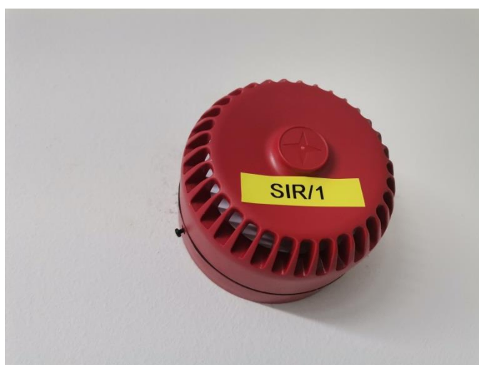
Slika 9 - Sirena Fulleon, ugrađena u restoran „Labudovac“