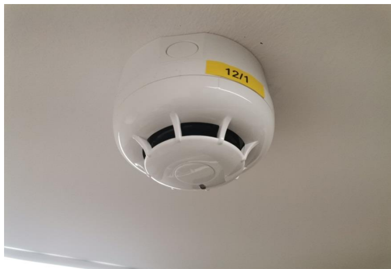
Slika 6 - Optički javljač S-ID 100, ugrađen u restoranu „Labudovac“