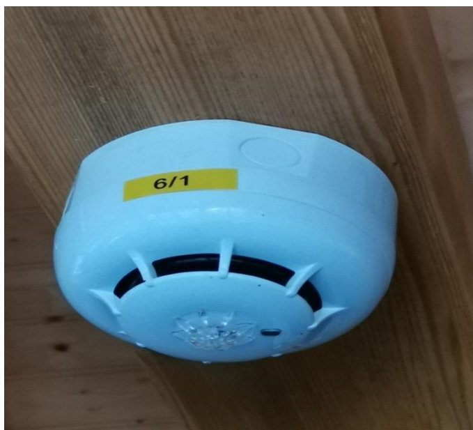
Slika 7 - Termički javljač S-ID200, ugrađen u restoranu „Labudovac“