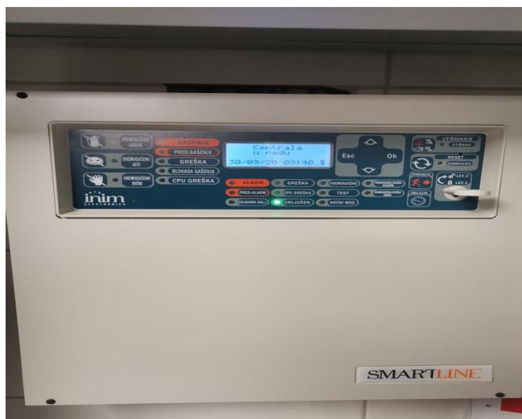
Slika 10 - Centrala dojava požara „Smartline 020/4, ugrađena u Restoran „Labudovac“