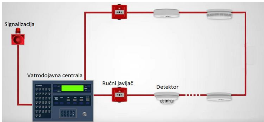
Slika 3 - Primjer sustava vatrodjavne centrale

Centrale koje upravljaju sustavima vatrodjave se već duži niz godina izvode s mikroprocesorima koji u djeliću sekunde reagiraju na svaku promjenu signala koji im elementi sustava šalju, a kako bi reakcija na eventualno stvaranje požara bila što brža, odnosno kako bi dežurna osoba imala što bolji pregled događaja na štíćenom objektu.[8]