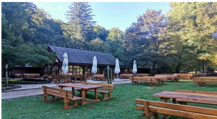
Slika 4 - Restoran „Labudovac“ prednji dio objekta sa terasom