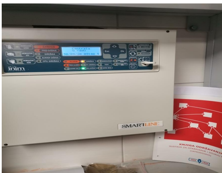
Slika 12 - knjiga održavanja uz vatrodjavnu centralu, Restoran „Labudovac“

Prema članku 57. Pravilnika o sustavima za dojavu požara korisnik predmetnog objekta je dužan voditi „ Knjigu održavanja “.