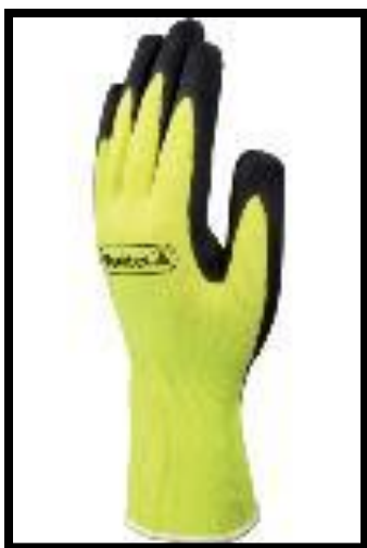
Slika 5.: Zaštitne gumene rukavice