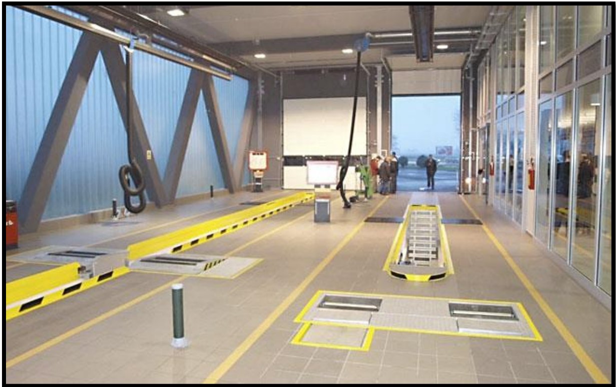
Slika 3.: Moderno opremljena stanica za tehnički pregled motornih vozila