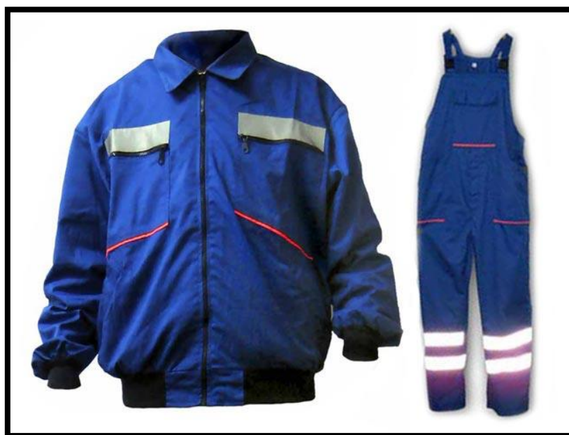
Slika 7.: Dvodijelno pamučno radno odijelo