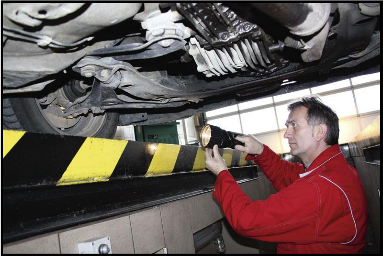
Slika 4.: Pregled motornih vozila u stanici za tehnički pregled