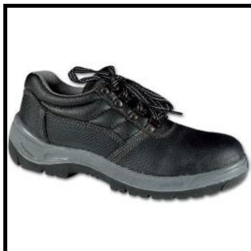
Slika 6.: Zaštitne cipele s čeličnom