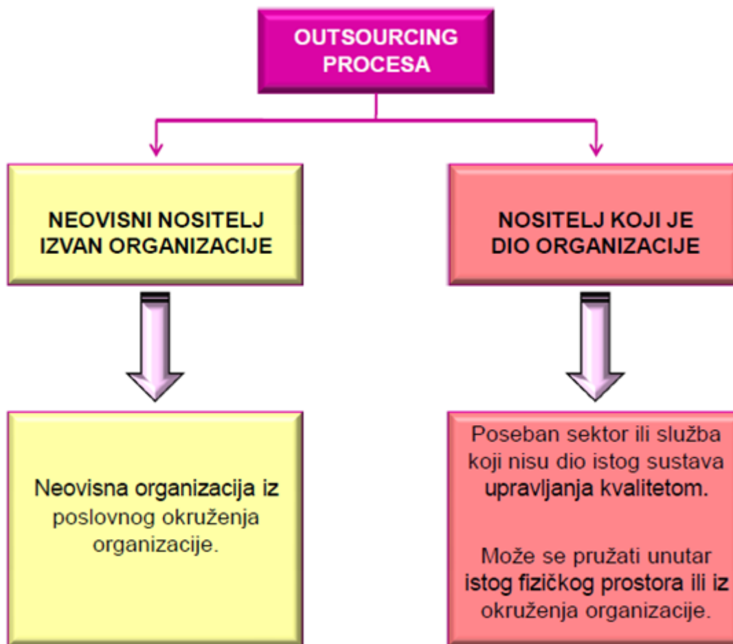
Slika 4. Nositelji procesa u outsourcingu