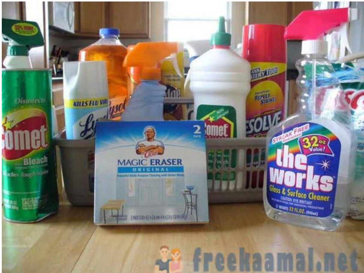
Slika 3. opasni otpad u kućanstvu

otpada. Nije opasan po zdravlje ljudi, i za okoliš jer ne ispušta nikakve štetne tvari (SOFILIĆ, BRNARDIĆ, 2015.).