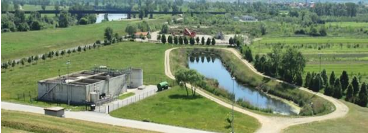
Slika 11. Uređaj za pročišćavanje procjednih voda