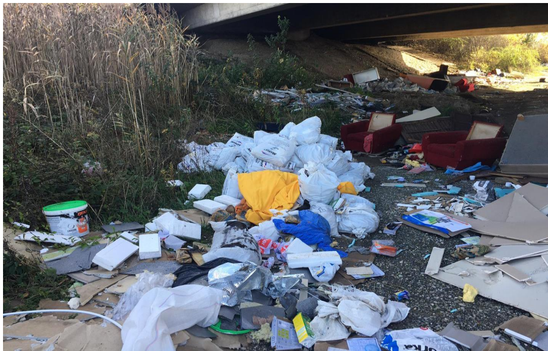
Slika 4. Divlje odlagalište otpada

smanjila količinu ambalažnog otpada Europska unija donijela je posebnu direktivu kojom su svi oni koji ambalažu stavljaju na tržište, dužni pobrinuti se za njezino zbrinjavanje. Proizvođači ambalaže moraju osigurati najmanje 50% iskorištavanja otpadne ambalaže, pri čemu trebaju izravno reciklirati najmanje 25% ukupne ambalaže, ovi uvjeti obavezni su za svaku članicu EU, kao i za zemlje koje će postati buduće članice (SPRINGER, 2001.).