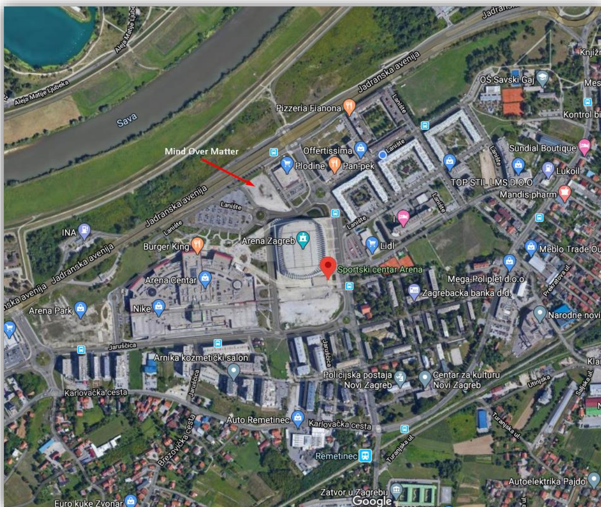
Slika 2. Lokacija projekta i konkurencije

U radijusu od 3 kilometra nalazi se svega jedan fitness centar koji je konkurencija projektu. Naime, radi se o centru koji je u neposrednoj blizini, ali uzimajući u obzir velik broj građana „može se zaključiti da im je konkurencija i potrebna i da problema sa dovoljnim brojem korisnika i članova neće biti.