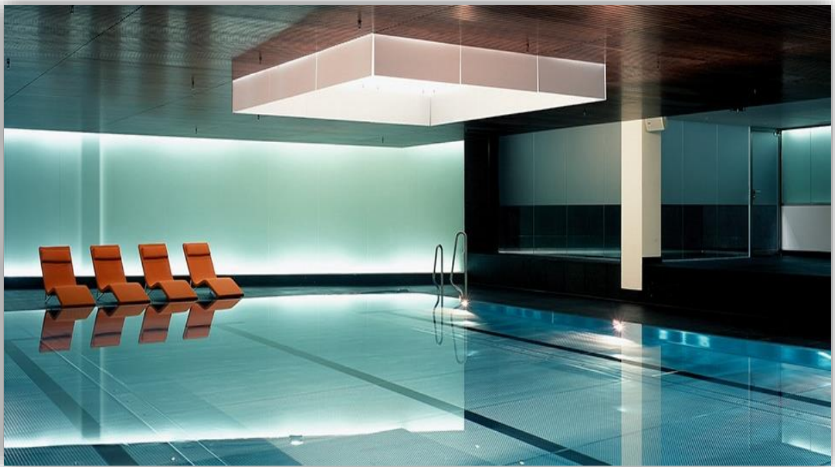
Slika 5. SPA prostorija