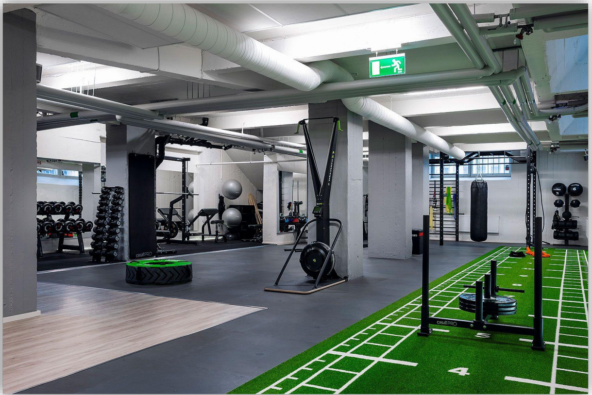
Slika 3 . Teretana