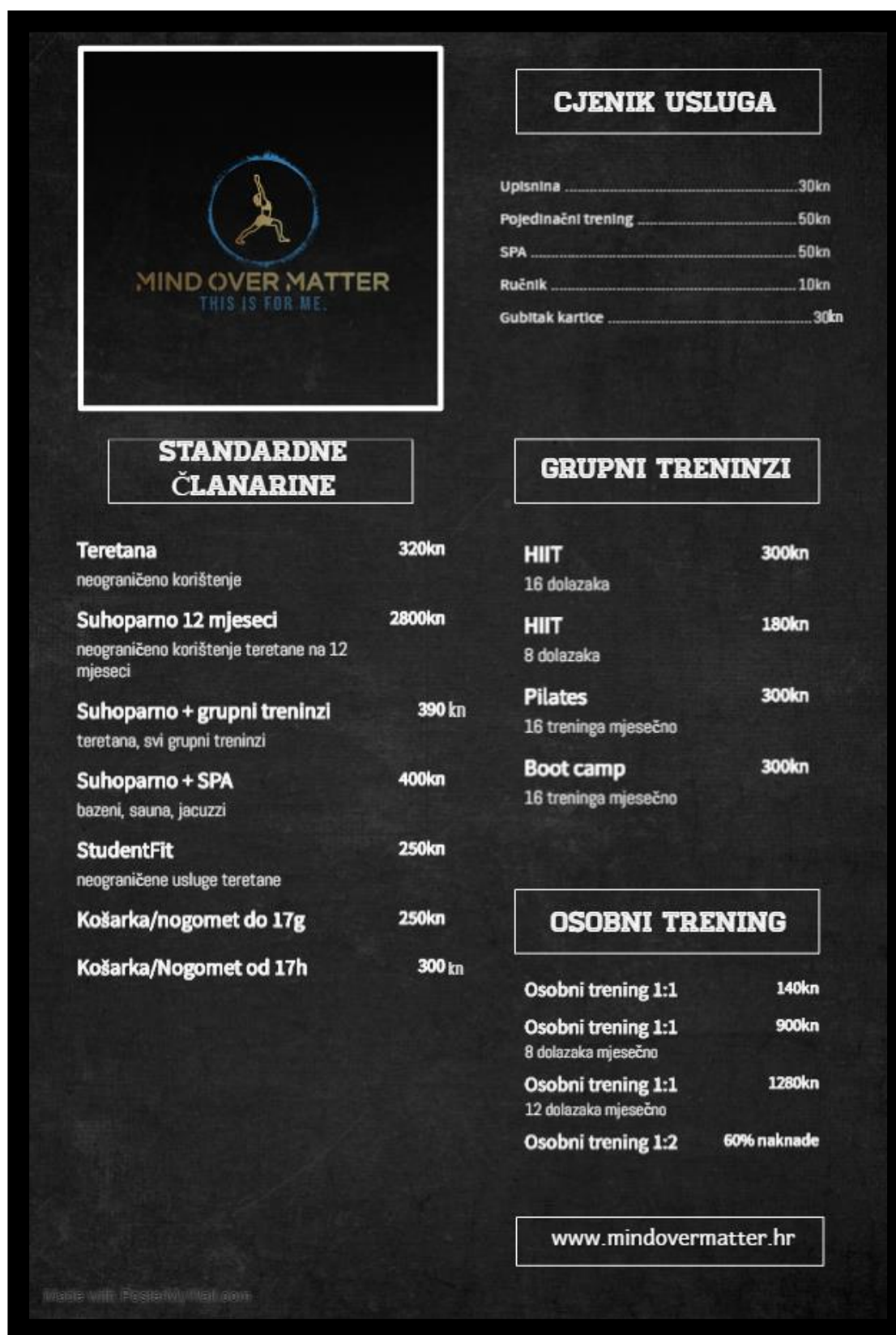
Slika 1. Cjenik usluga