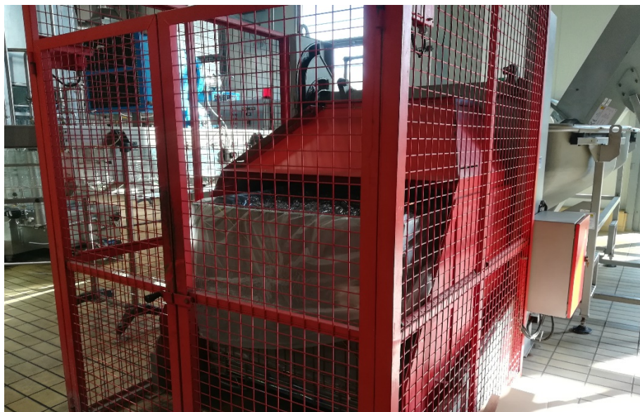
Slika 5. Spremnik za predobljke.