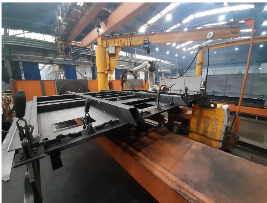
Slika 17. Daihnn Var stroj za zavarivanje