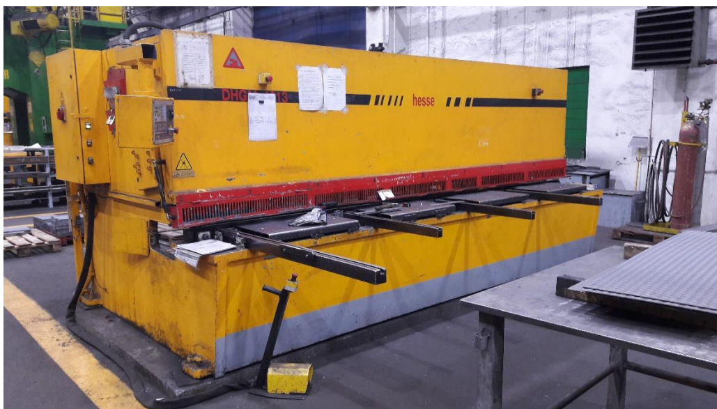
Slika 15. Hidraulične škare za lim