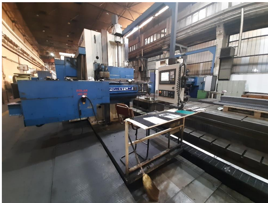
Slika 7. Obradni centar modumill 1751 i 1752