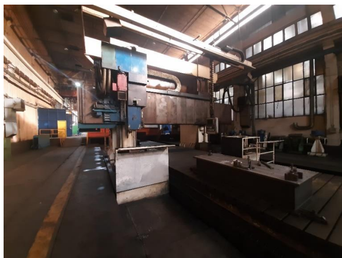
Slika 4. Portalna glodalica