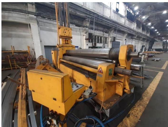
Slika 13. Stroj za savijanje lima