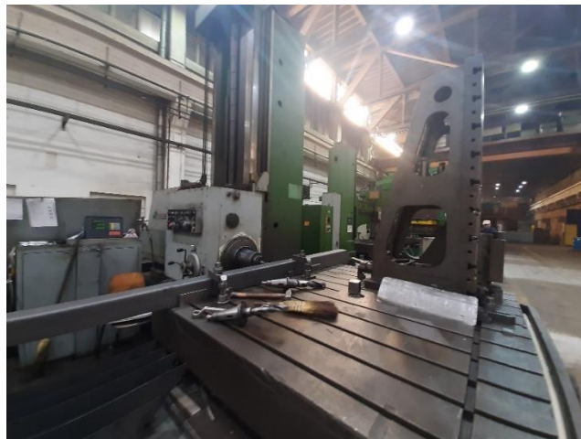
Slika 3. Horizontalna bušilica i glodalica WHN 13 A