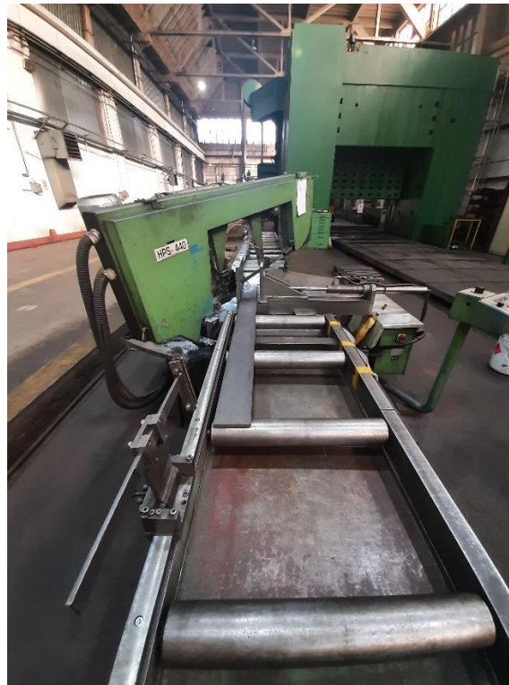
Slika 18. Pila horizontalna tračna HPS 440