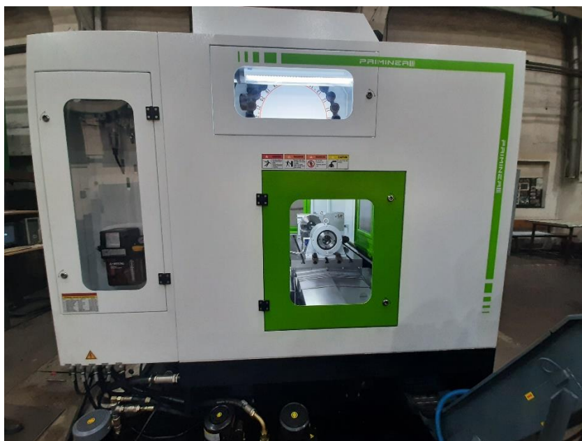
Slika 8. CNC obradni centar 4 osni