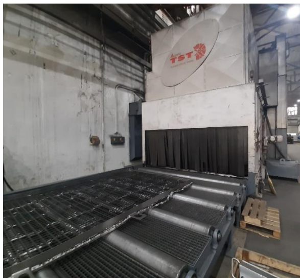
Slika 11. Stroj za sačmarenje