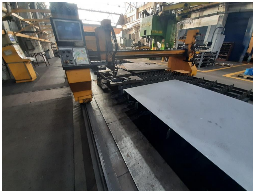
Slika 9. CNC stroj za plinsko rezanje "Ivana 30"