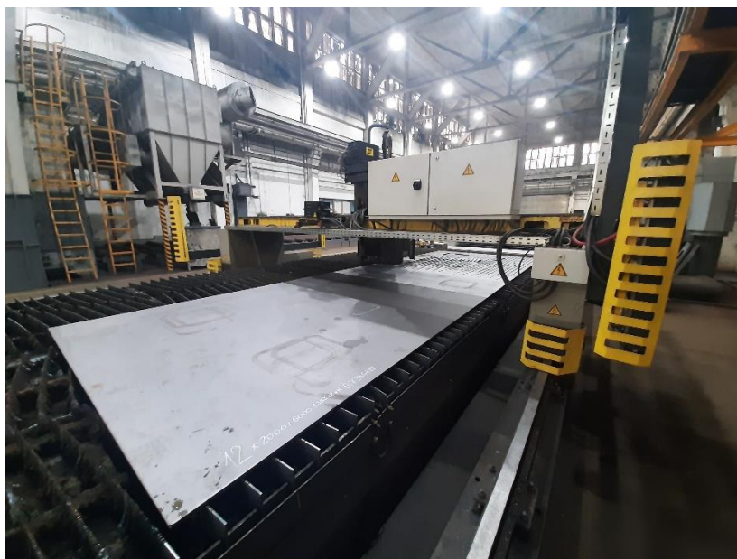
Slika 10. CNC plasma ESAB