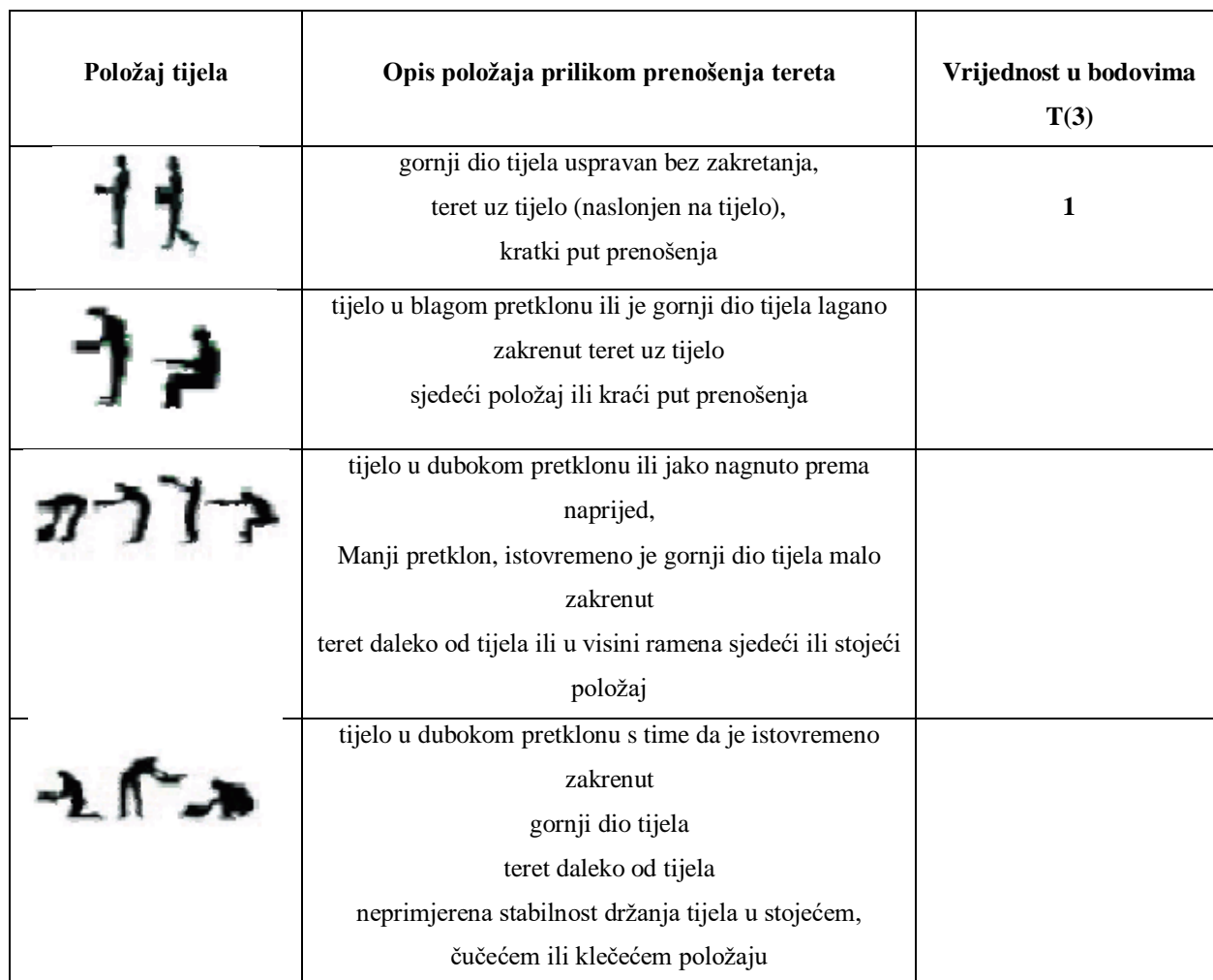
Tablica 17. Stanje na mjestu rada gdje se prenosi teret