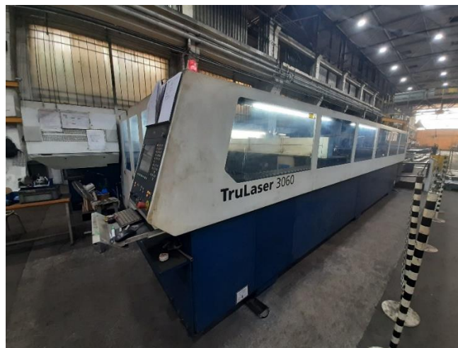
Slika 12. Laser za rezanje lima