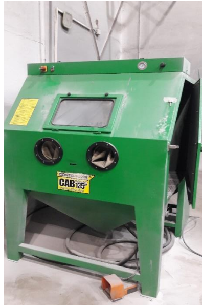
Slika 6. Uređaj za pjeskarenje