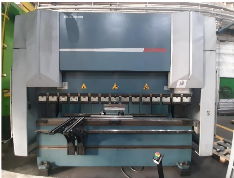
Slika 14. Hidraulična preša za savijanje lima