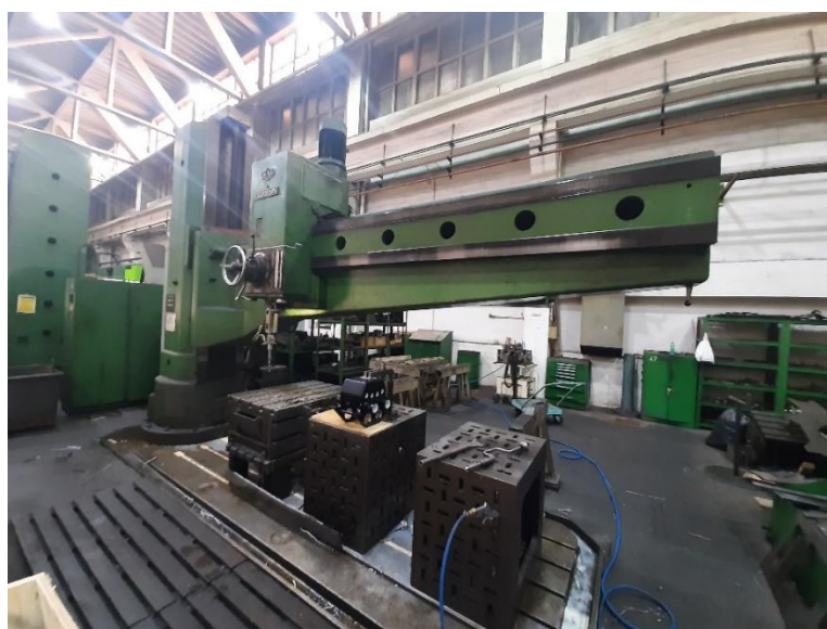
Slika 5. Radijalna bušilica