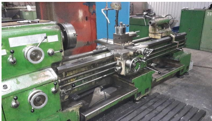
Slika 2. Tokarilica PA 631