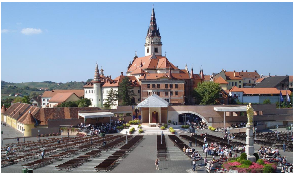
Slika 3. Svetište Majke Božje Bistričke