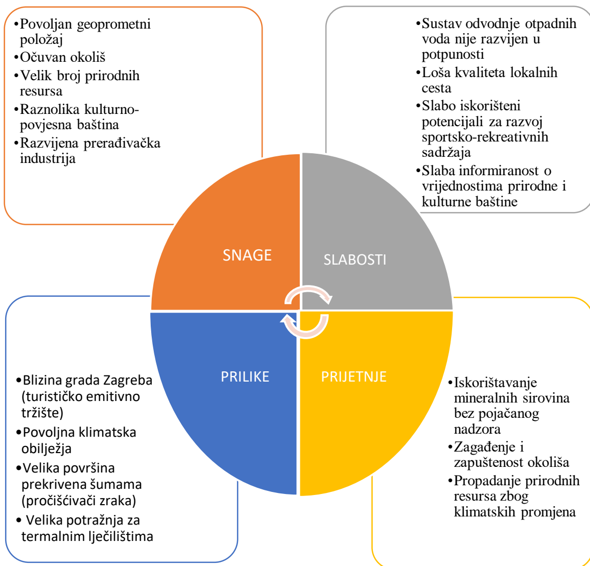
Grafikon 2. Swot analiza Krapinsko-zagorske županije