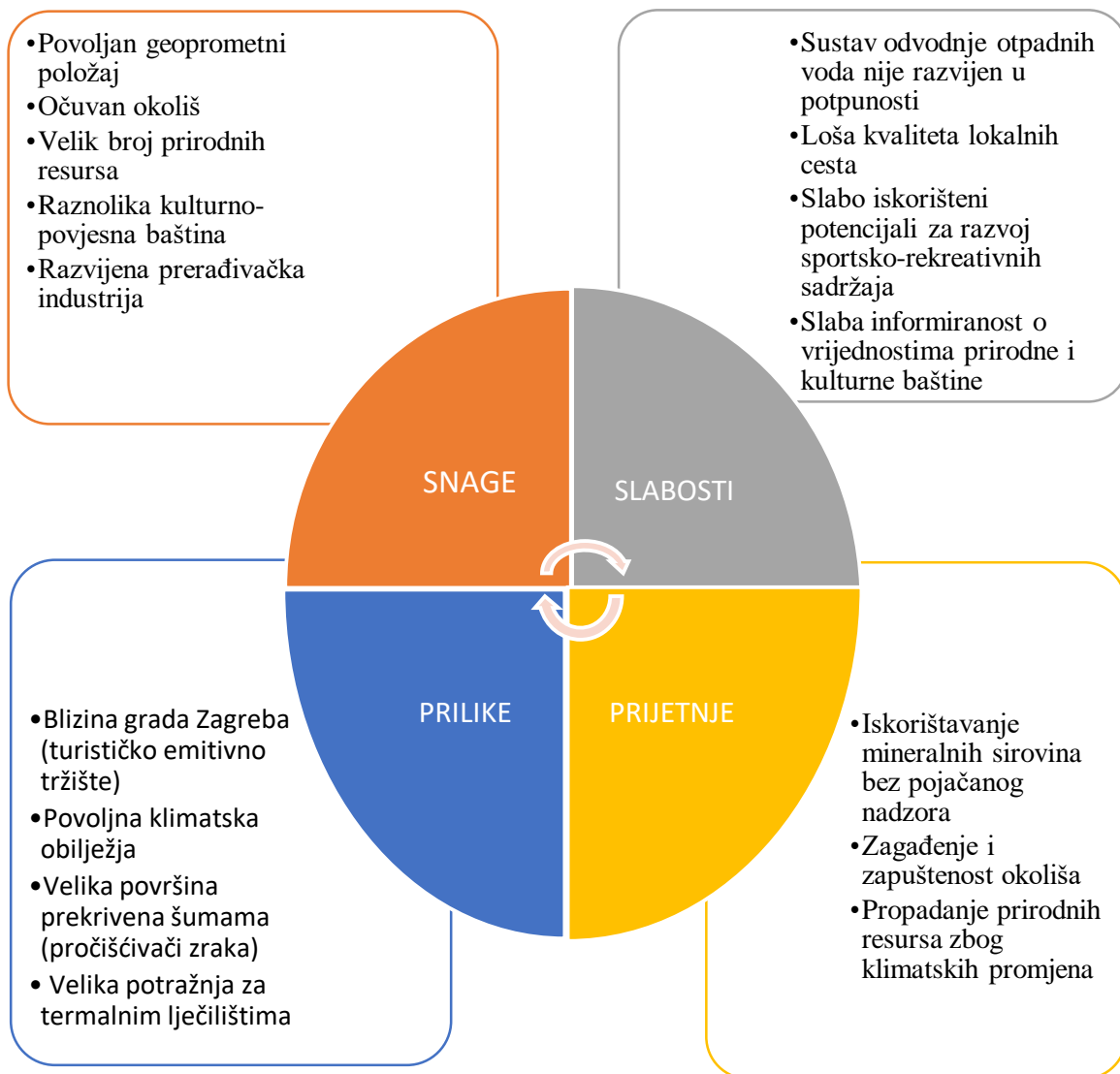
Grafikon 2. Swot analiza Krapinsko-zagorske županije