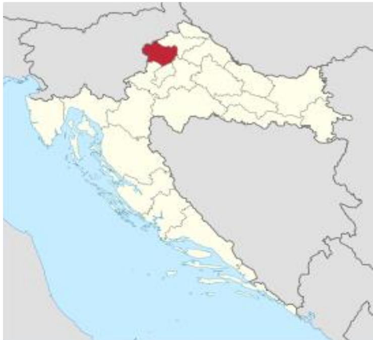
Slika 1. Smještaj Krapinsko-zagorske županije