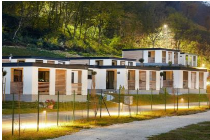
Slika 5. Kamp "Terme Jezerčica"