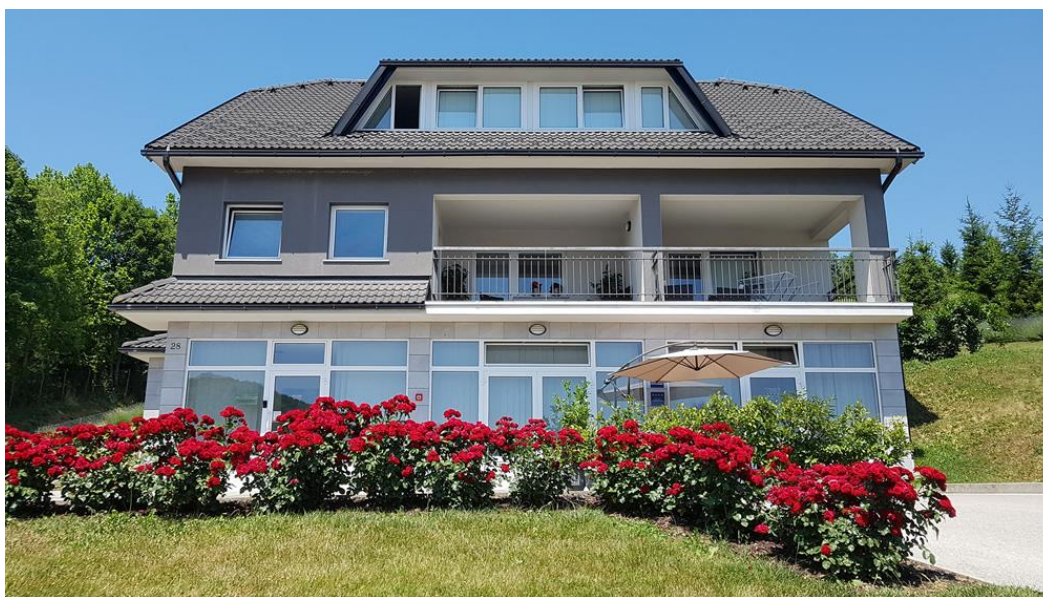
Slika 6. Apartmani Sanja u Krapinskim Toplicama