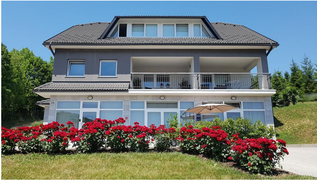
Slika 6. Apartmani Sanja u Krapinskim Toplicama