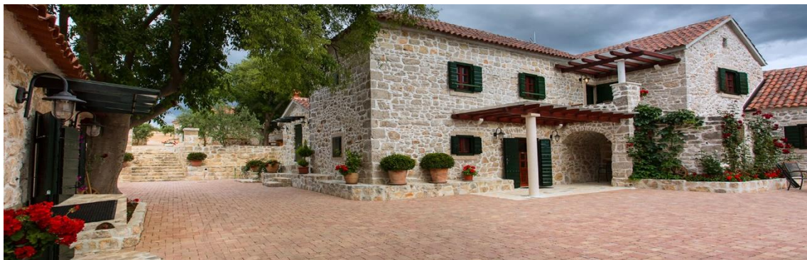
Slika 4. Difuzni hotel "Ražnjevića dvori"