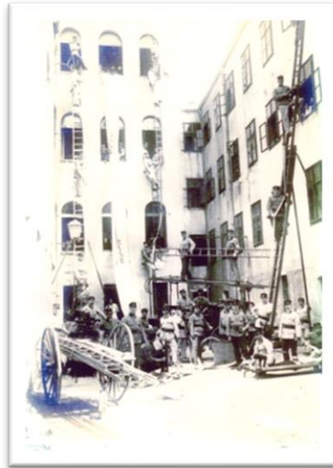
Slika 1. Počeci vatrogastva u Splitu [14]

namjesništva 19. lipnja 1883. godine s naznačenom svrhom djelovanja: Braniti život i imanja splitskih stanovnika i okolice. [17]