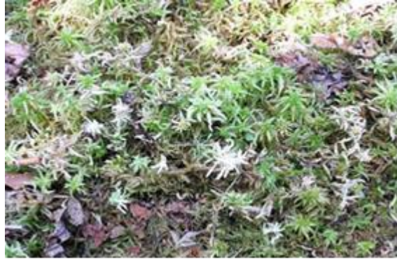
Slika 1. Cret Banski Moravci