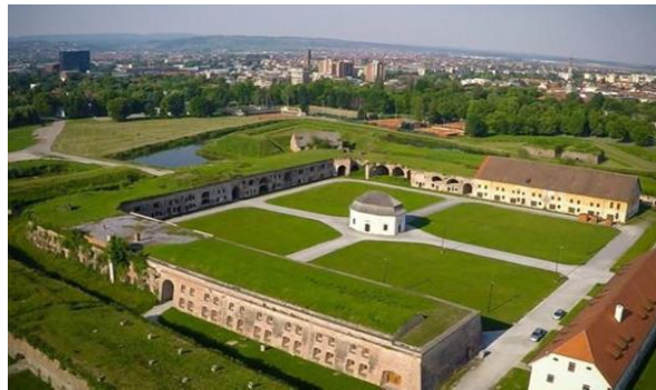
Slika 6. Brodska tvrđava