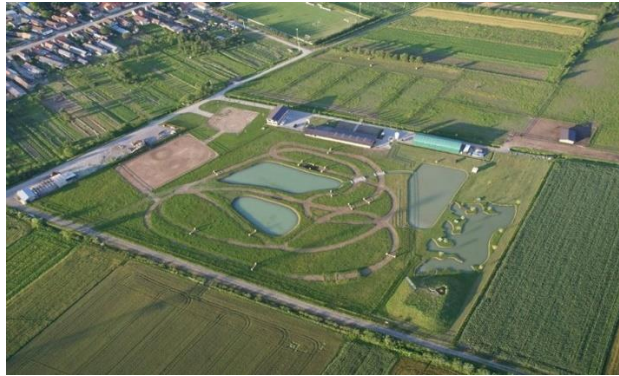
Slika 8. Ugostiteljsko – smještajni objekt i ergela Ranč Ramarin