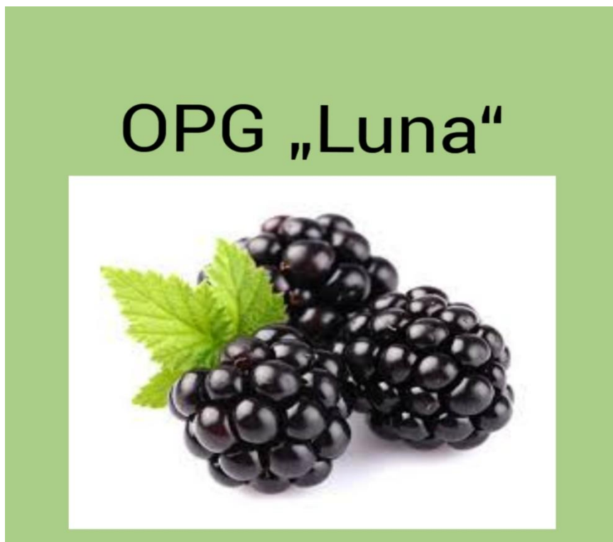
Slika 1: Zaštitni znak Obiteljskog poljoprivrednog gospodarstva Luna

U nastavku će se predložiti promidžbeni program tvrtke (ekonomska propaganda, osobna prodaja, unapređenje prodaje, odnosi s javnošću te ekonomski publicitet).