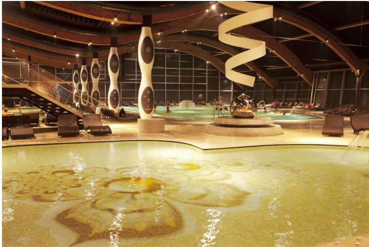
Slika 14. Life Class Terme Sveti Martin