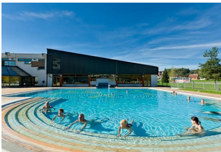
Slika 20. Top Terme Topusko