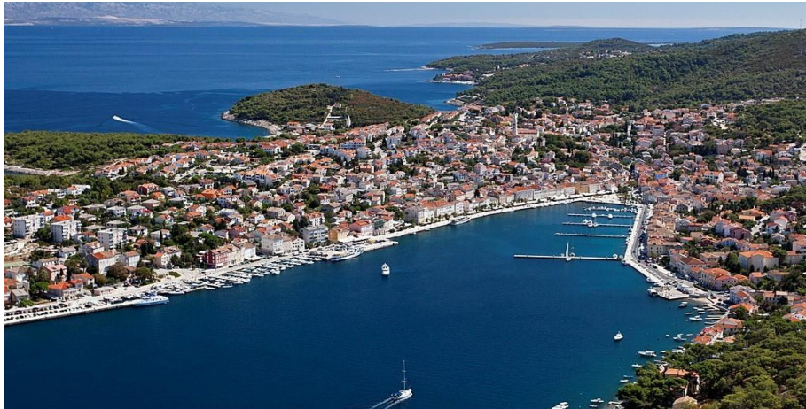
Slika 4. Mali Lošinj