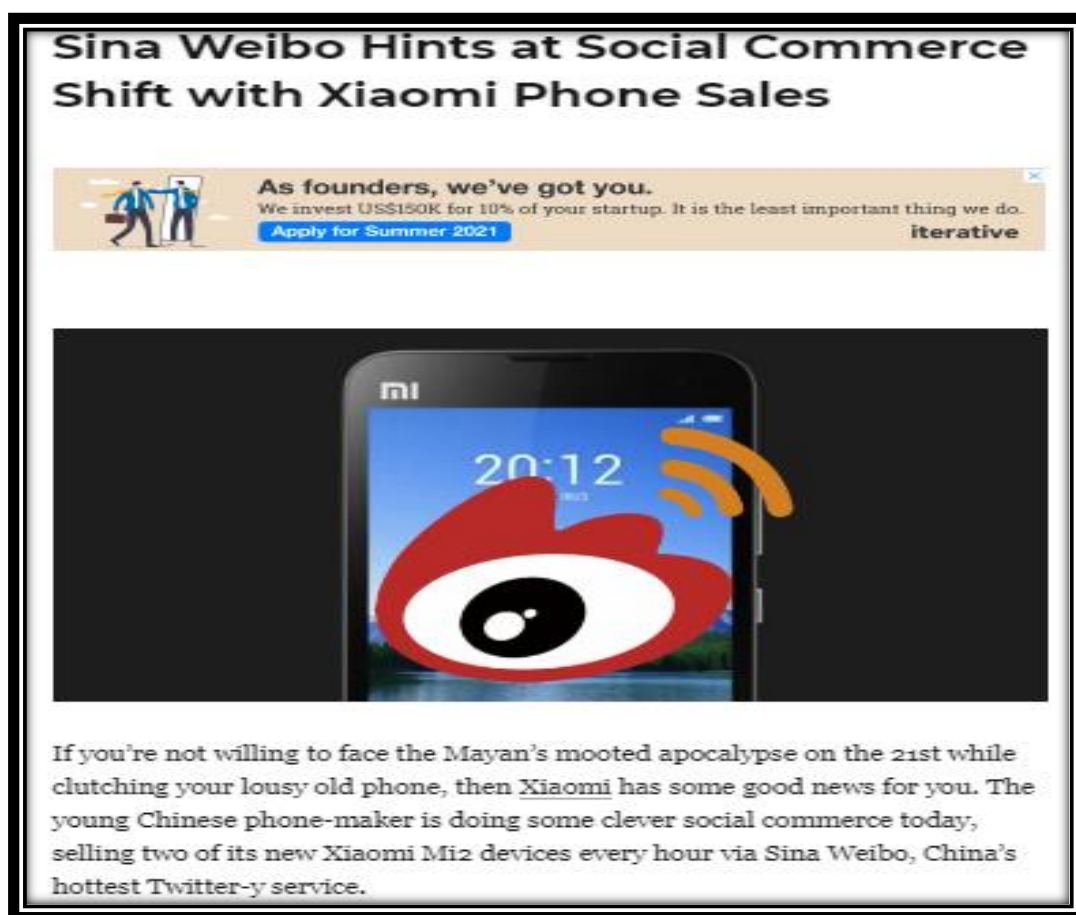
Slika 10. Weibo - popularna kineska platforma za društvene medije