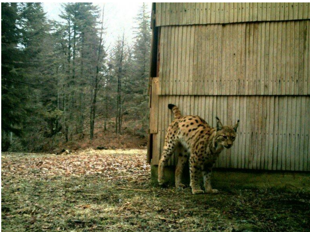
Slika br 1: Euroazijski ris na markiralištu

Ris je najveća europska divlja mačka te po sistematici spada u : razred sisavaca ( Mammalia ), red mesoždera ( Carnivora ), porodice mačaka ( Felidae ), potporodice pravih mačaka ( Felinae ), roda mačke ( Felis ) te vrsta obični ili euroazijski ris ( Lynx lynx ). Osim euroazijskog risa Europu još nastanjuje i iberijski ris ( Lynx pardinus ) i može ga se naći samo na Iberijskom poluotoku, dok je euroazijski ris rasprostranjen na području od Skandinavije, preko Baltičke regije, Srednje i Istočne Europe, Dinarida i Balkana do Anatolije, Irana, Iraka, Sjeverne i Srednje Azije. Širokim geografskim rasponom ris obuhvaća i različita staništa; stepe, polupustinje, šume umjerenog pojasa, tajge, a na Himalaji čak i područja iznad pojasa šume.