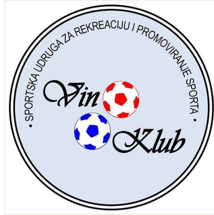
Slika 2: Logo sportske udruge za rekreaciju i promoviranje sporta „Vin klub“