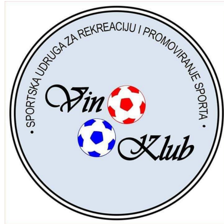
Slika 2: Logo sportske udruge za rekreaciju i promoviranje sporta „Vin klub“