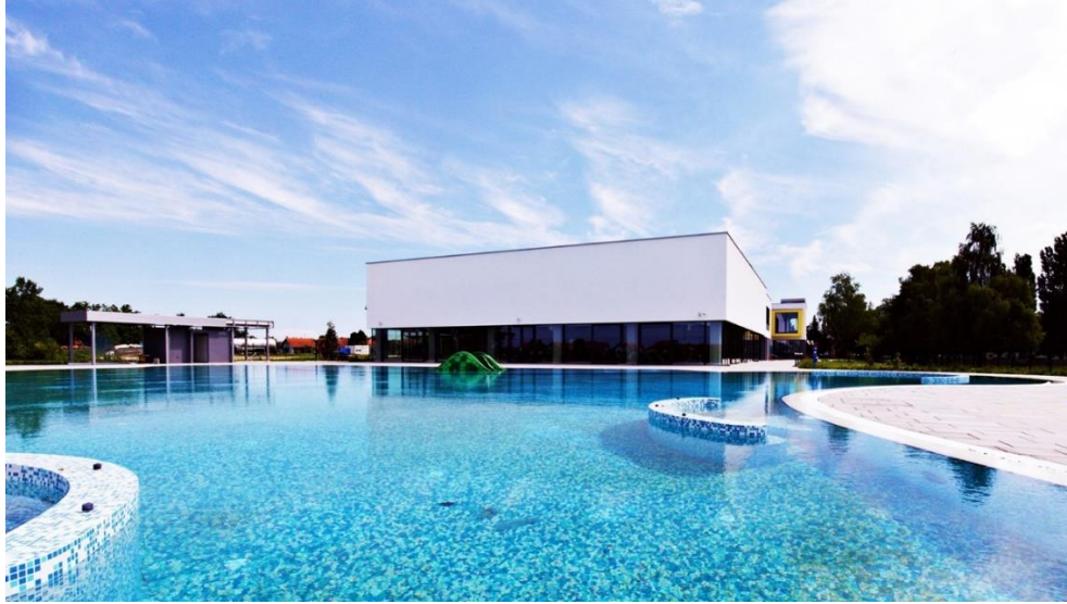
Slika 11: Vanjski bazen Specijalne bolnice Naftalan