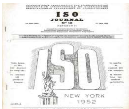
Slika 1. naslovnica ISO časopisa iz svibnja 1952.

Priča o ISO, skraćeno od International Organization for Standardization, odnosno Internacionalna organizacija za standardizaciju, počinje davne 1946. godine u Londonu, kada se sastalo 65 delegata iz 25 zemalja svijeta kako bi razgovarali o budućnosti međunarodne standardizacije. Već 1947. ISO useljava u svoje urede u jednu privatnu kuću u Ženevi. Godine 1951. nastaje prva norma koja se nazivala preporukom, nazvana ISO/R1:1951 Standardna referentna temperatura za mjerenja industrijske duljine. Od tada je norma više puta ažurirana i sada je ISO 1: 2002 Geometrijske specifikacije proizvoda (GPS) - Standardna referentna temperatura za geometrijske specifikacije proizvoda. Naslovnica ISO časopisa (slika 1) prikazuje časopis iz svibnja 1952.