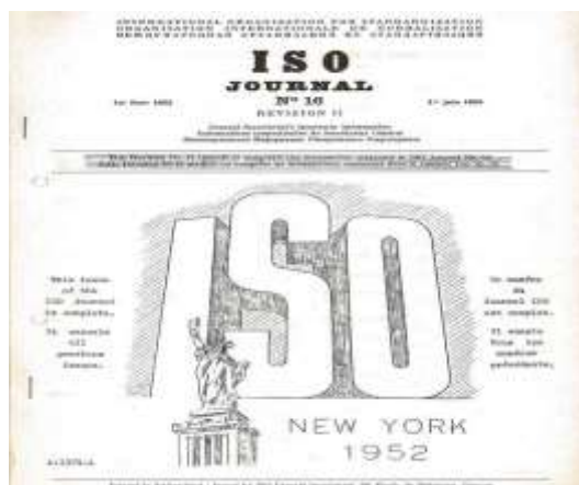
Slika 1. naslovnica ISO časopisa iz svibnja 1952.

Priča o ISO, skraćeno od International Organization for Standardization, odnosno Internacionalna organizacija za standardizaciju, počinje davne 1946. godine u Londonu, kada se sastalo 65 delegata iz 25 zemalja svijeta kako bi razgovarali o budućnosti međunarodne standardizacije. Već 1947. ISO useljava u svoje urede u jednu privatnu kuću u Ženevi. Godine 1951. nastaje prva norma koja se nazivala preporukom, nazvana ISO/R1:1951 Standardna referentna temperatura za mjerenja industrijske duljine. Od tada je norma više puta ažurirana i sada je ISO 1: 2002 Geometrijske specifikacije proizvoda (GPS) - Standardna referentna temperatura za geometrijske specifikacije proizvoda. Naslovnica ISO časopisa (slika 1) prikazuje časopis iz svibnja 1952.