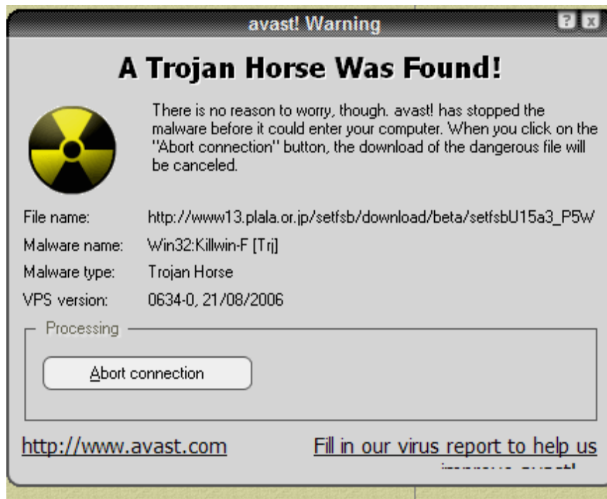
Slika 2. Upozorenje o pronalasku trojanskog konja na računalu [9]

Na slici 2. je prikazana poruka koja se može pojaviti u slučaju pronalaska trojanskog konja na računalu preko antivirusnog programa. Antivirusni programi mogu predstavljati vrlo važan alat u pronalasku i eliminaciji potencijalno sumnjivih programa.