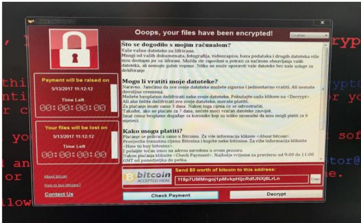
Slika 3. Primjer obavijesti ransomwarea [11]

Na slici 3. se može vidjeti jedan primjer ransomwarea . Mogu se uočiti tri dijela. Prvi sadrži poruku sa objašnjenjem nastale situacije. Drugi dio je vezan za upute za ispunjavanje zahtjeva i vraćanja kontrole nad računalom, a treći i posljednji dio sadrži podatke o načinu plaćanja. U slučaju neisplate navedene svote novca u određenom vremenu spominje se sankcija u obliku brisanja podataka sa računala, trajnog zaključavanja pristupa računalu i sličnog.