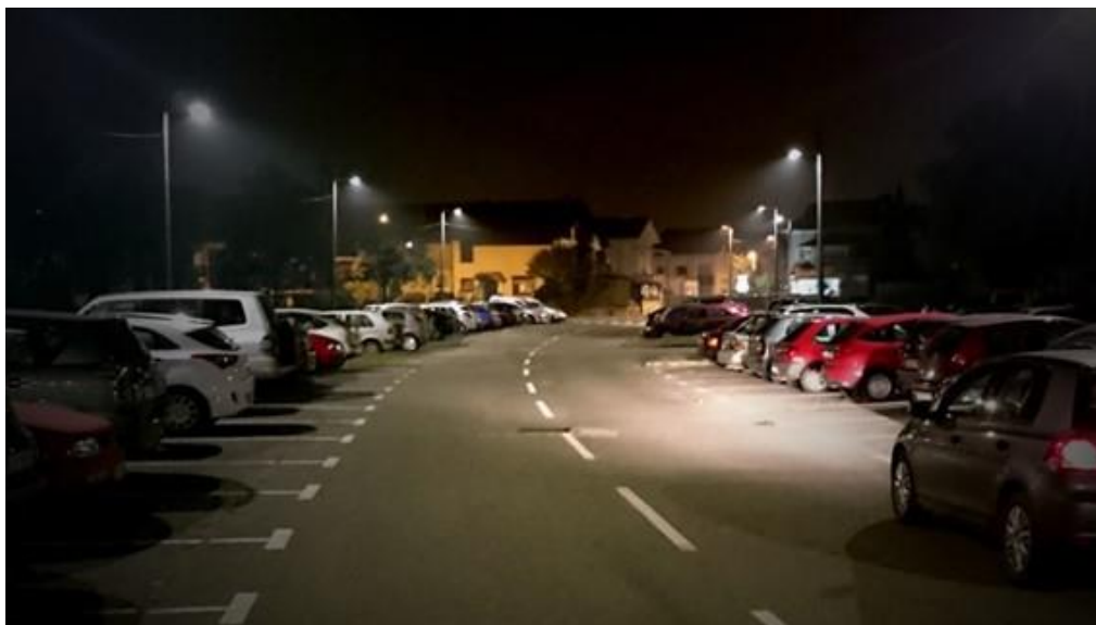
Slika 17. Ulična LED rasvjeta [30]

Smanjenju svjetlosnog onečišćenja i zagađenja ugljičnim monoksidom također pomažu LED rasvjetni sustavi. LED rasvjeta pruža svjetlost koristeći minimalnu snagu koju generiraju generatori kao što su solarni paneli i hidroelektrični sustavi. [29]