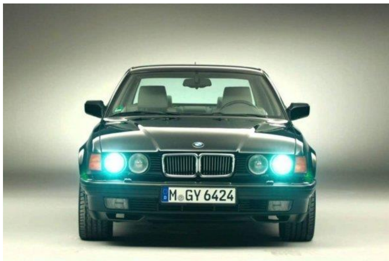
Slika 14. BMW serija 7 (E32 iz 1991.)- ksenonska tehnologija prednjih svjetala [23]

Ksenonske ili HID (eng. High Intense Discharge) žarulje spadaju u vrstu rasvjetnih tijela kod kojih se, umjesto žarnih niti od volframa, koriste dvije elektrode, fizički odvojene, od volframa u izoliranom staklenom prostoru ispunjenom nekim od plemenitih plinova kao što su argon, ksenon, kripton ili neon. Odnosno, kombinacijama nekih od njih. Iako je uobičajeno da se zovu ksenonske, riječ je o metalnom halidu koji svijetli, a ksenon služi samo za paljenje.