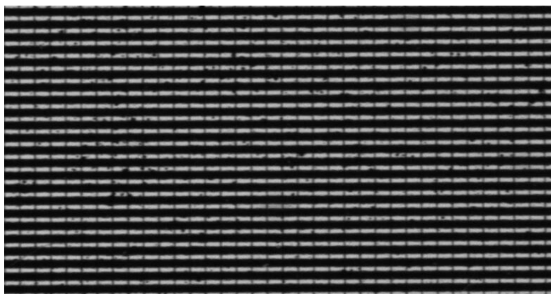
Slika 9. Stari OLED zaslon koji pokazuje potrošenost [13]

U usporedbi sa starijim tehnologijama, OLED je skup. [15]