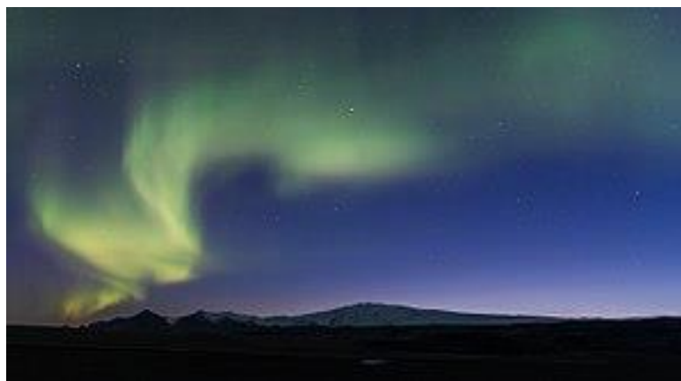
Slika 2. Polarna svjetlost iznad Islanda [4]

U prirodne izvore svjetlosti spadaju, uz već spomenute zvijezde, munje, vatra, krijesnice te čak i polarna svjetlost koja je prikazana na slici 2. [3]