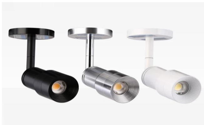
Slika 5. Spot LED svjetiljke [11]