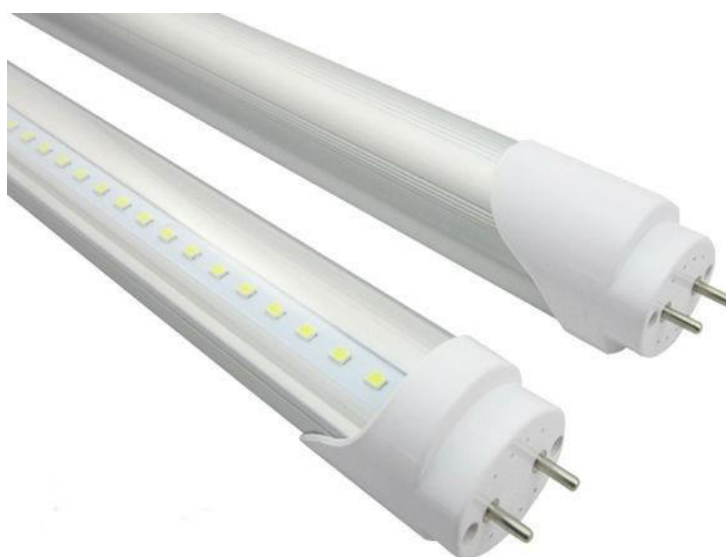
Slika 6. LED cijevi [12]

LED cijevi projektirane su za rasvjetu prostorića opće namjene, kao što su hodnici, garaže, dvorane, učionice, benzinske postaje i slični prostori. Svjetleće diode visokog intenziteta povezane su i smještene u staklenu ili plastičnu cijev istih dimenzija kao i fluorescentne cijevi (FC). U potpunosti zamjenjuju FC i za svoj rad ne trebaju kondenzator za kompenzaciju, prigušnicu ili starter. Prednost im je što imaju dug radni vijek, nemaju štetne UV zrake te nema štetnih i opasnih tvari. [10]