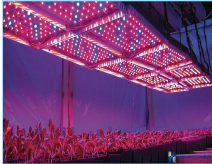
Slika 11. LED rasvjeta u stakleniku [21]