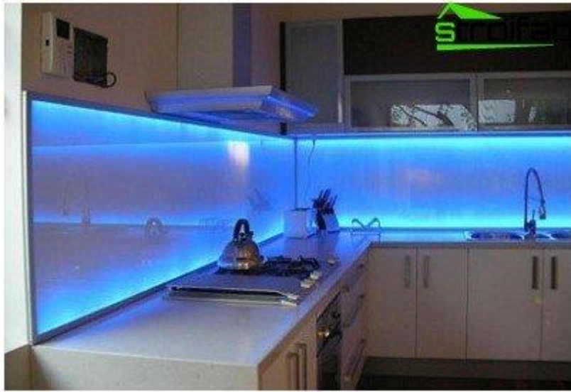
Slika 12. Primjer LED rasvjete u kućanstvu