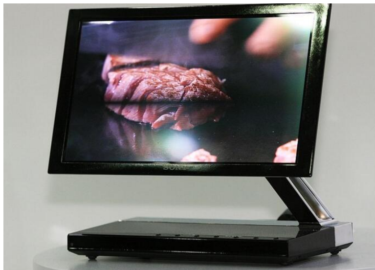
Slika 7. Sony WEL-1, prvo OLED TV [13]

U usporedbi s LED tehnologijom, OLED ima sljedeće prednosti: