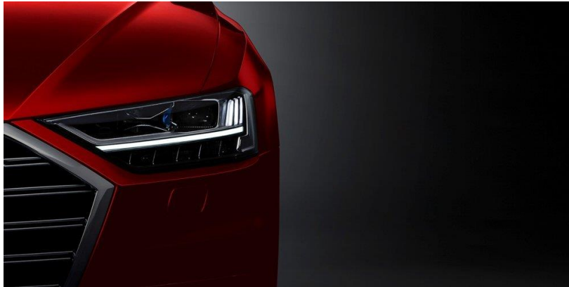
Slika 15. LED svjetla, Audi A8 [24]