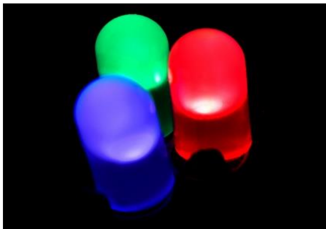
Slika 3. Svjetleće diode [6]

Svjetleća dioda ili LED (skr. od eng. Light Emitting Diode) je poluvodički elektronički element koji pretvara električni signal u optički, svjetlost. (Slika 3)