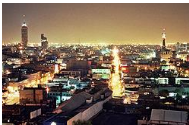
Slika 16. Svjetlosno onečišćenje [28]

Svjetlosno onečišćenje okoliša globalni je problem kojem se pripisuju astronomski, ekonomski, sigurnosni, ali i zdravstveni problemi koji izazivaju brojne neželjene zdravstvene učinke i utječu na čovjeka. [27]