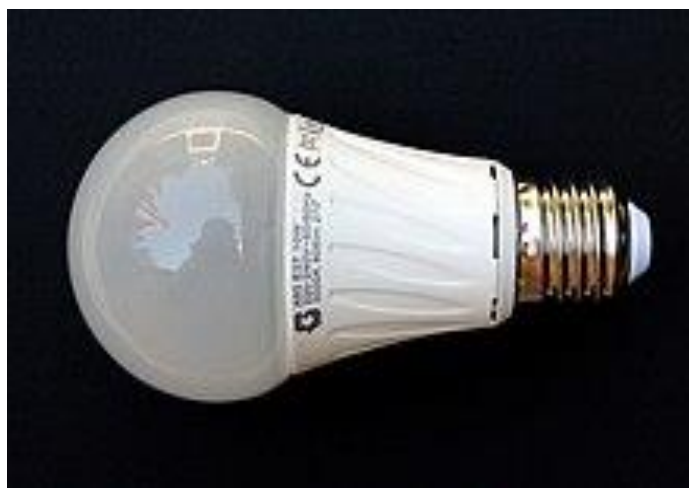
Slika 4. LED žarulja [9]

LED svjetiljke (Slika 4.) imaju duži vijek trajanja i znatno su učinkovitije od većine ostalih svjetiljki. Slično žaruljama sa žarnom niti, LED žarulje postaju pune svjetline bez zakašnjenja zbog zagrijavanja. Također, često uključivanje i isključivanje ne smanjuje im životni vijek što je slučaj kod fluorescentne rasvjete. [9]