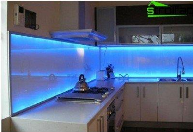
Slika 12. Primjer LED rasvjete u kućanstvu