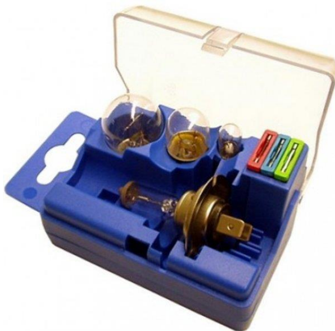
Slika 13. Set halogenih žarulja H7 [23]

Princip rada im je takav da kada kroz elektrode prođe struja, zbog električnog otpora dolazi do zagrijavanja niti od volframa na visokoj temperature i emitiranja svjetlosti. Unutar staklenog kućišta žarulje nalazi se plin, brom ili jod, koji osigurava da volframova nit ne pregori. [25]