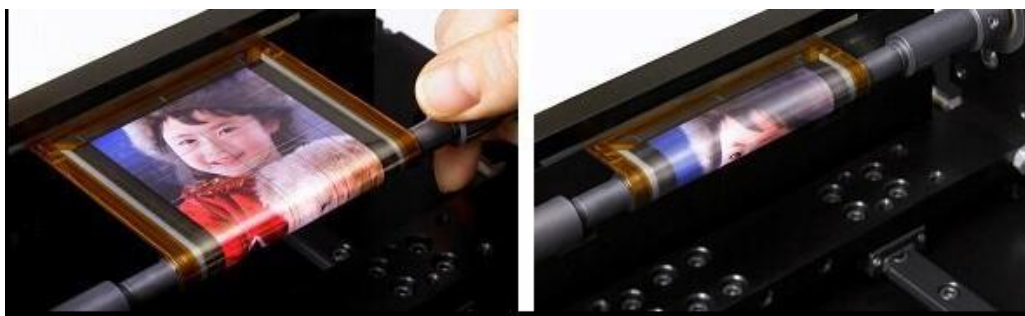
Slika 8. Demonstracija prototipa fleksibilnog OLED zaslona tvrtke Sony [13]