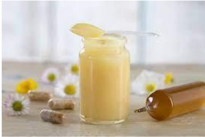
Slika 4. Matična mliječ [4]

Propolis je tekućina tamnozeleno do smeđecrvene boje. Kemijski sastav mu je raznolik te najviše sadrži biljne smole i balzama, aromatičnih i eteričnih ulja, voska i peludi. Ima antiseptička, bakteriostatična, anestetična i antitoksična svojstva. Dobar je biostimulator, jer aktivira specifična antitijela u organizmu. U narodnoj medicini koristi se za liječenje gnojnih rana, opekotina, žuljeva, ogrebotina i upala. Upotrebljava se i za lakiranje drvenih predmeta (Agroklub.hr).