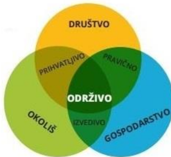
Slika 1 Održivi razvoj turizma