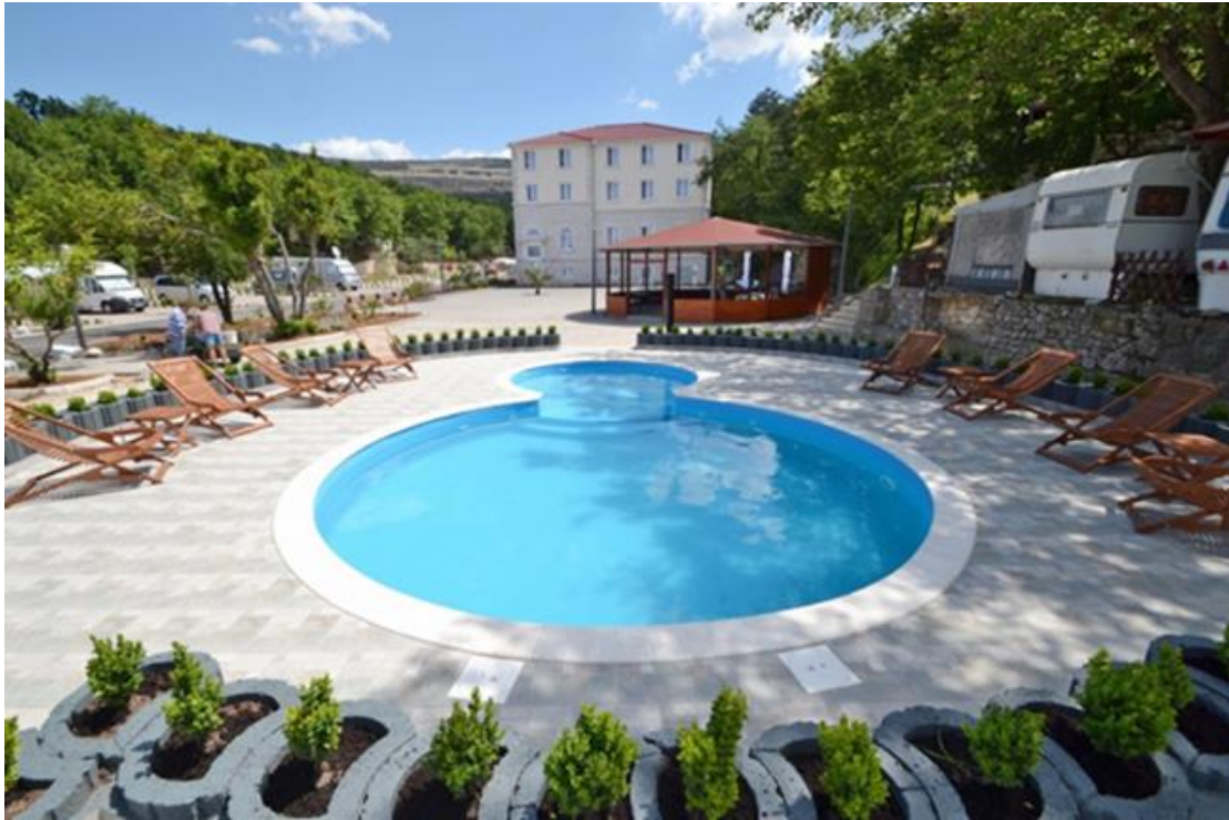
Slika 4 Kamp Selce