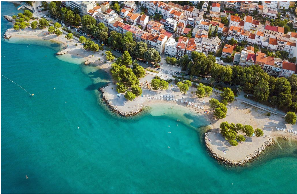
Slika 3 Gradsko kupalište Crikvenica