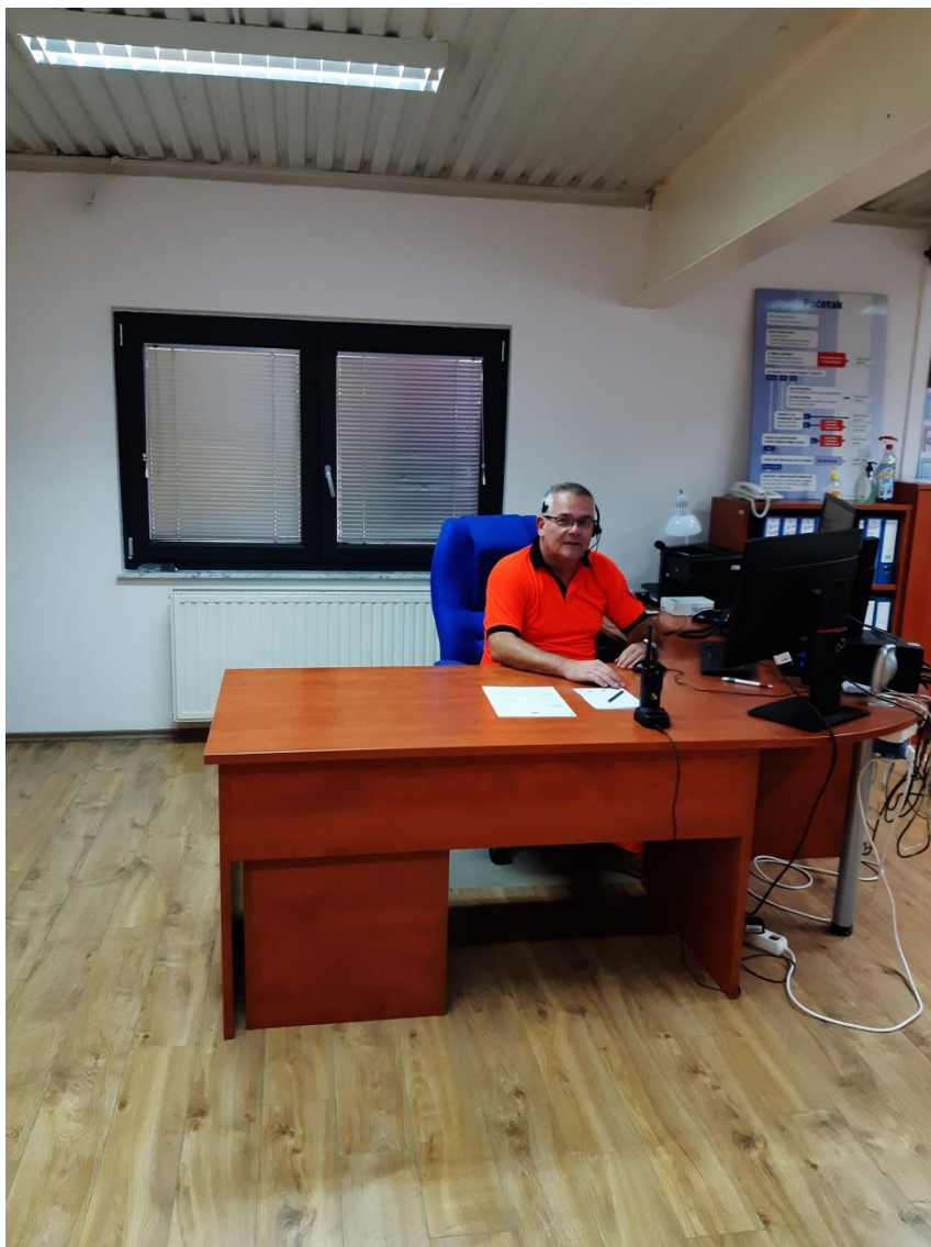
Slika 4. Medicinska prijavno dojavna jedinica SMŽ