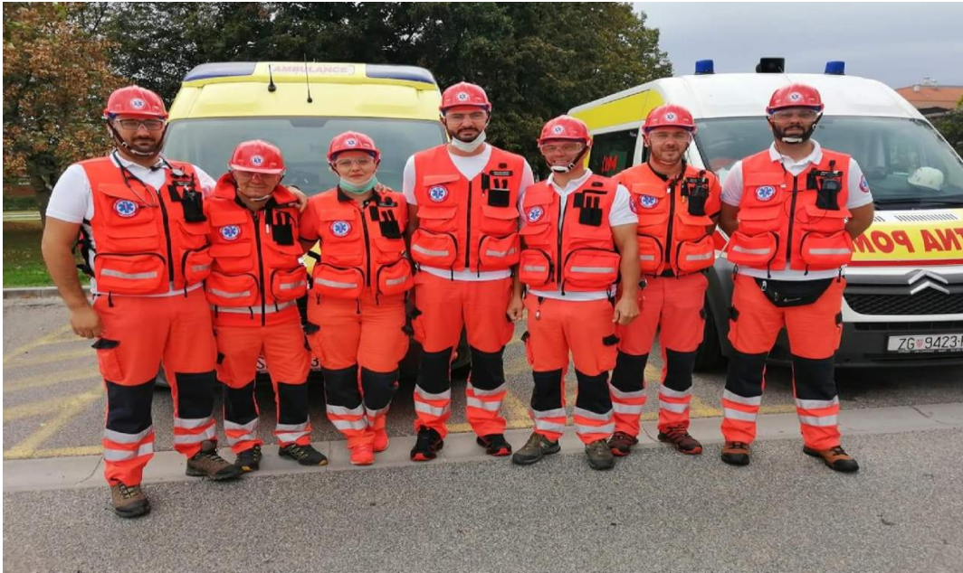
Slika 6. Prikaz osobne zaštitne opreme za intervencije u masovnim nesrećama