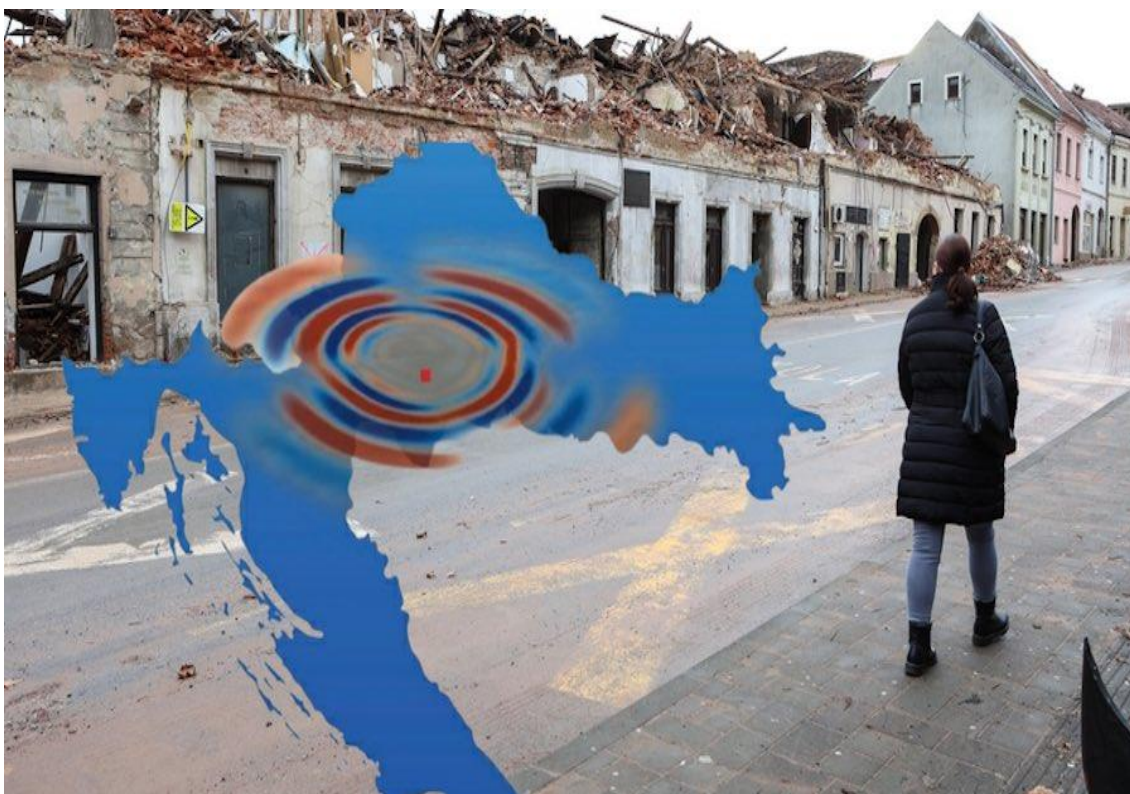
Slika 1. Grad Petrinja nakon potresa