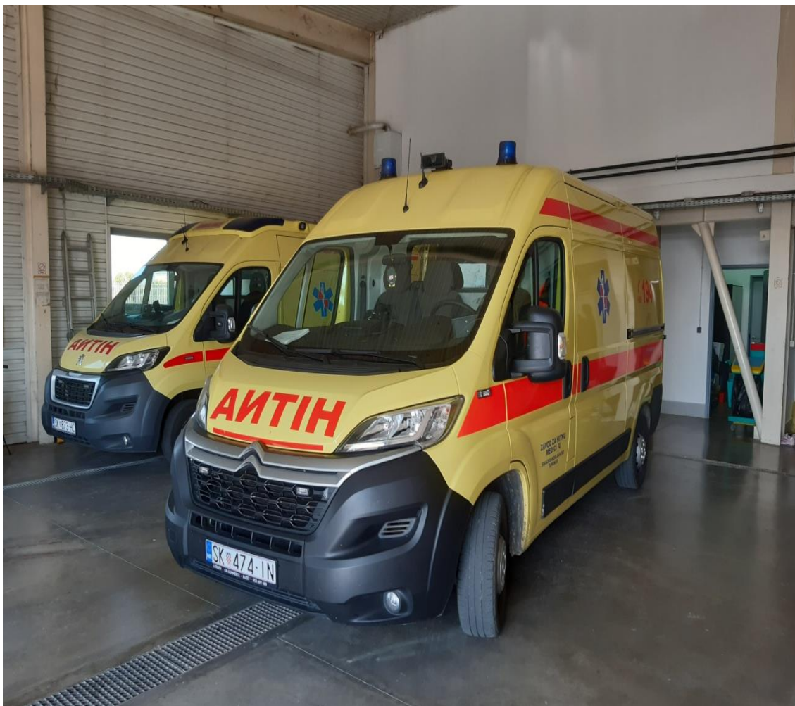
Slika 3. Vozila hitnih timova