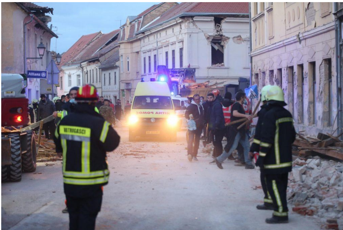
Slika 5. Intervencija nakon potresa objedinjenih hitnih službi

Kordinira i upravlja zdravstvenim ustanovama u slučaju većih incidenata, procjenjuje mogući nastanak kriznog stanja i donosi preventivne mjere i planove pripravnosti i provodi aktivnosti kao bi se zajednica mogla vratiti u prvobitno stanje. U slučaju katastrofe krizni stožer se može uljučiti u odgovor zdravstvenog sustava. Zapovjedništvo krinog stožera čine: ministar zdravlja, zamjenik predsjednika, načelnik kriznog stožera i pomoćnik.